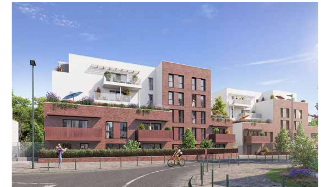
Les Terrasses du Comminges à Colomiers Architecte : Miralles Architectes