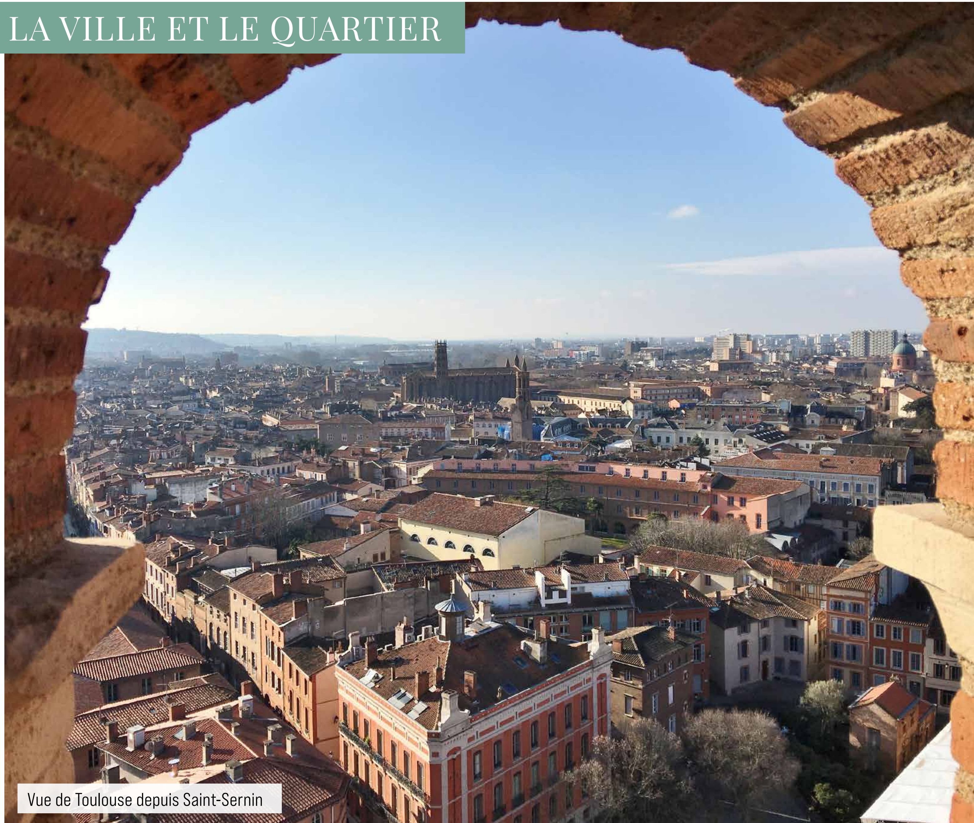
Vue de Toulouse depuis Saint-Sernin