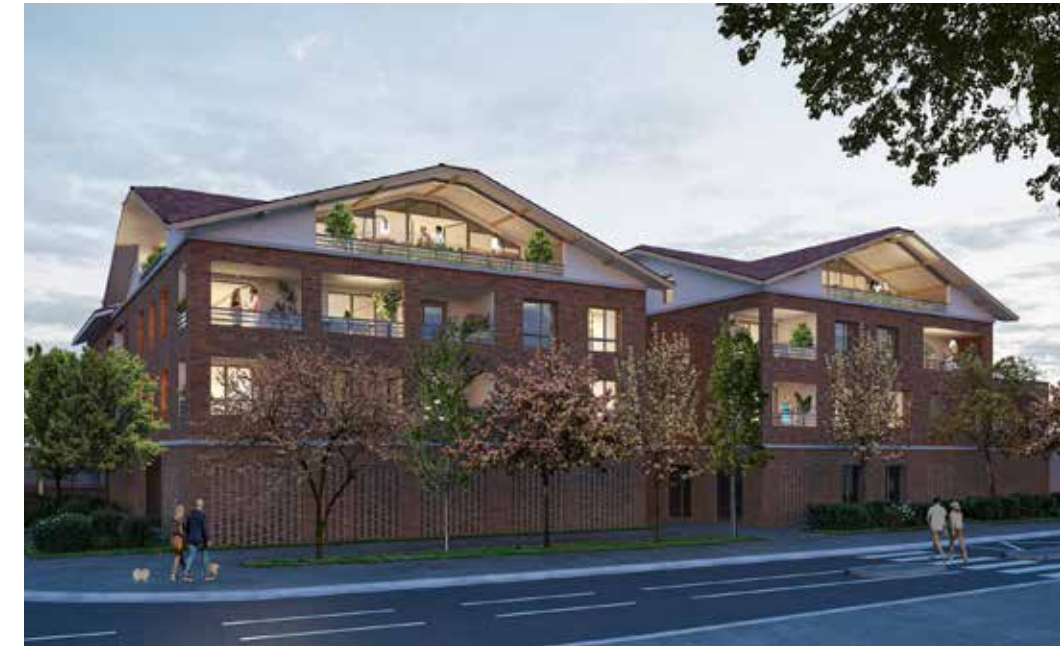
Le 141 Côte Pavée à Toulouse Architecte : Agence Bellouard, Montlaur & Balducci Architectes