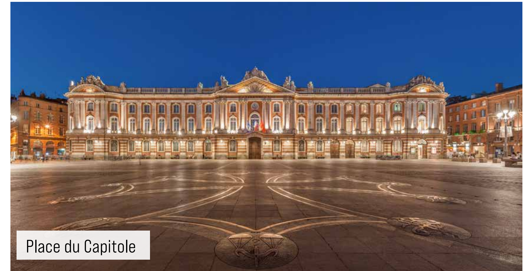
Place du Capitole