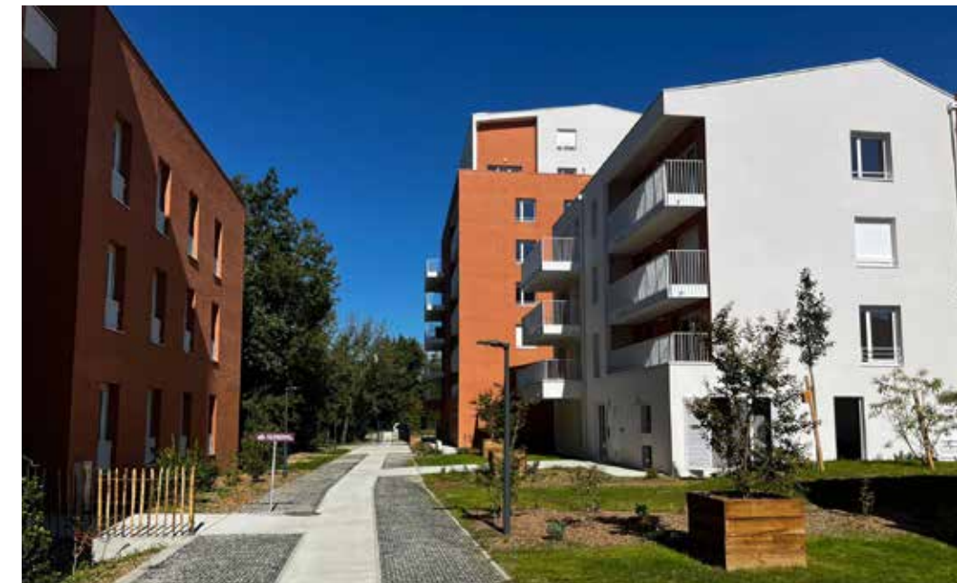
Vert Eden à Toulouse Architecte : Groupe A et Syn Architectures