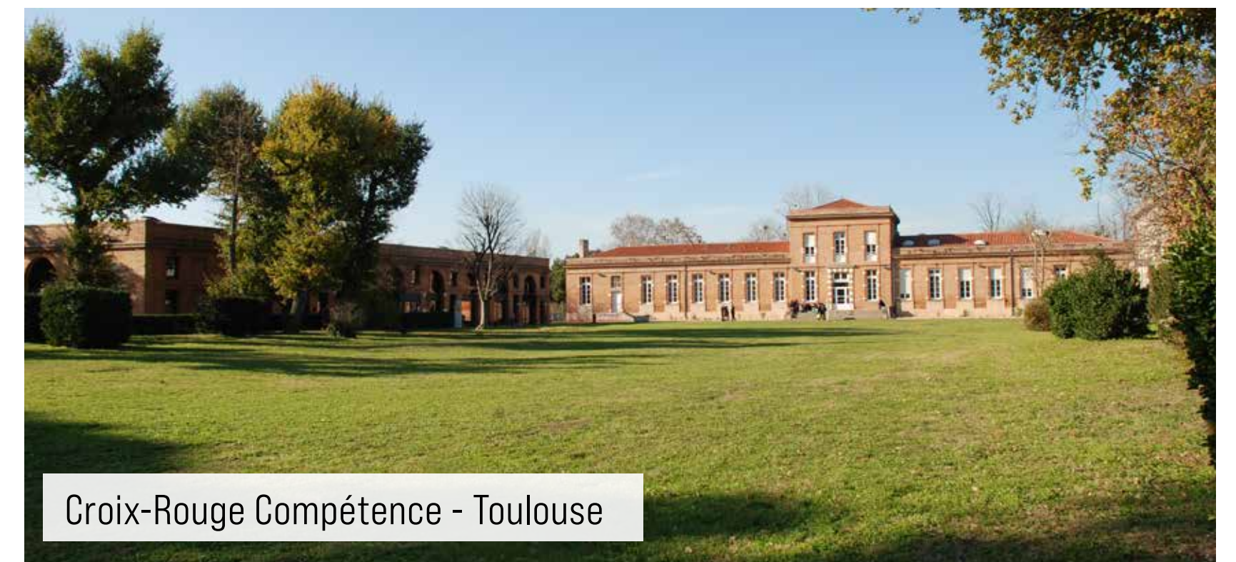
Croix-Rouge Compétence - Toulouse