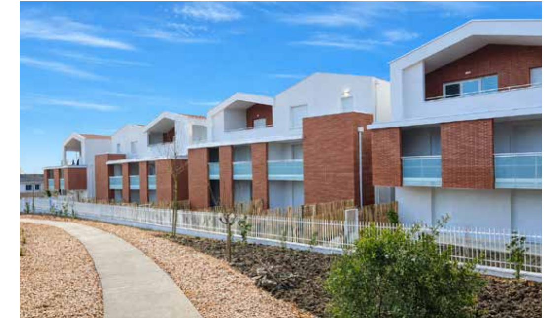
Confidence Balma à Balma Architecte : Agence ABC Architecture