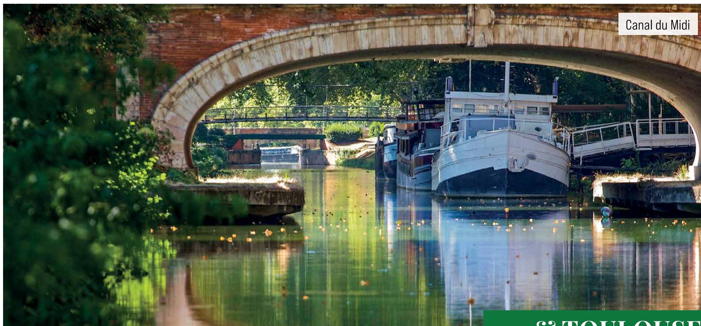
Canal du Midi