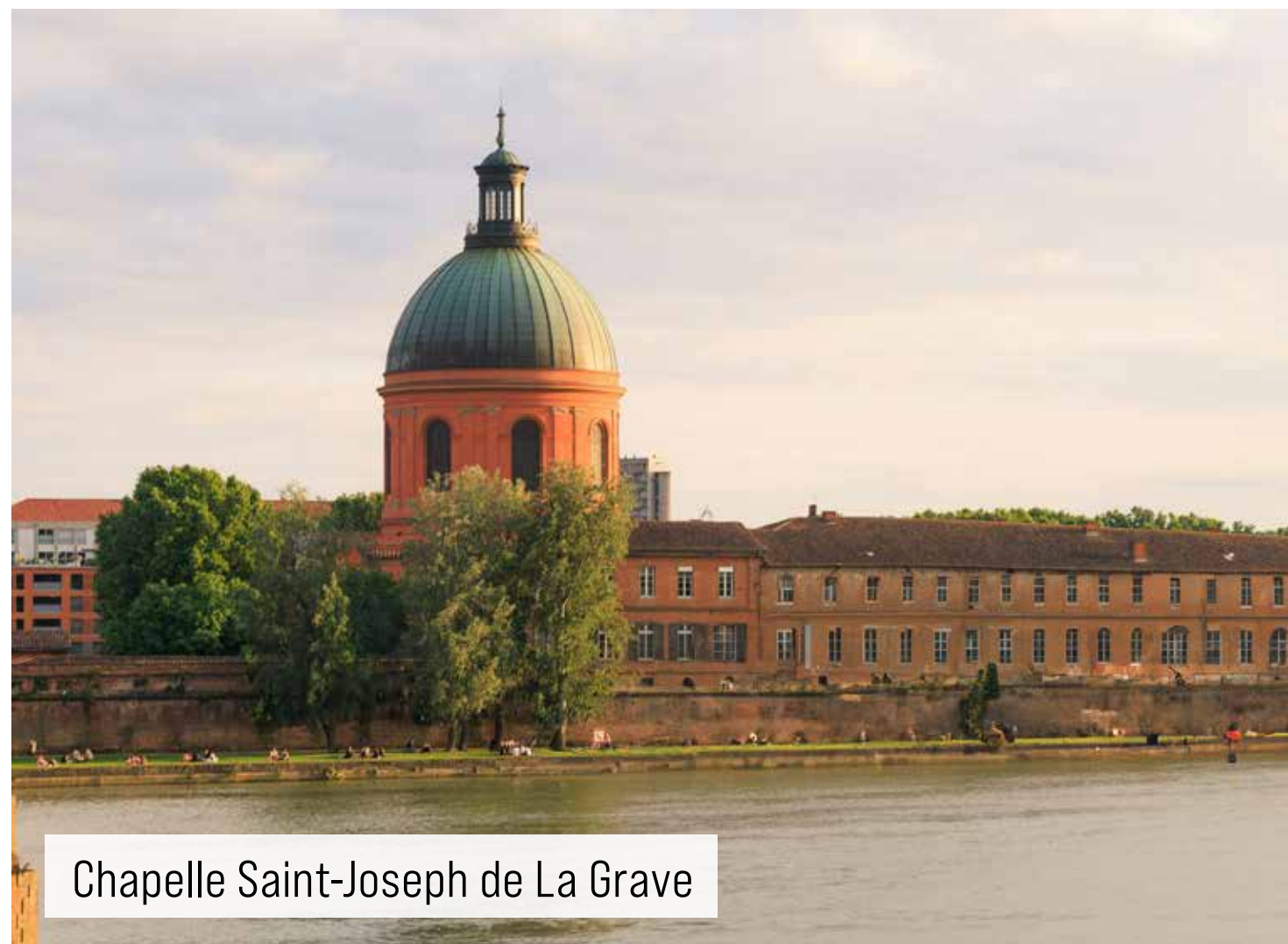
Chapelle Saint-Joseph de La Grave