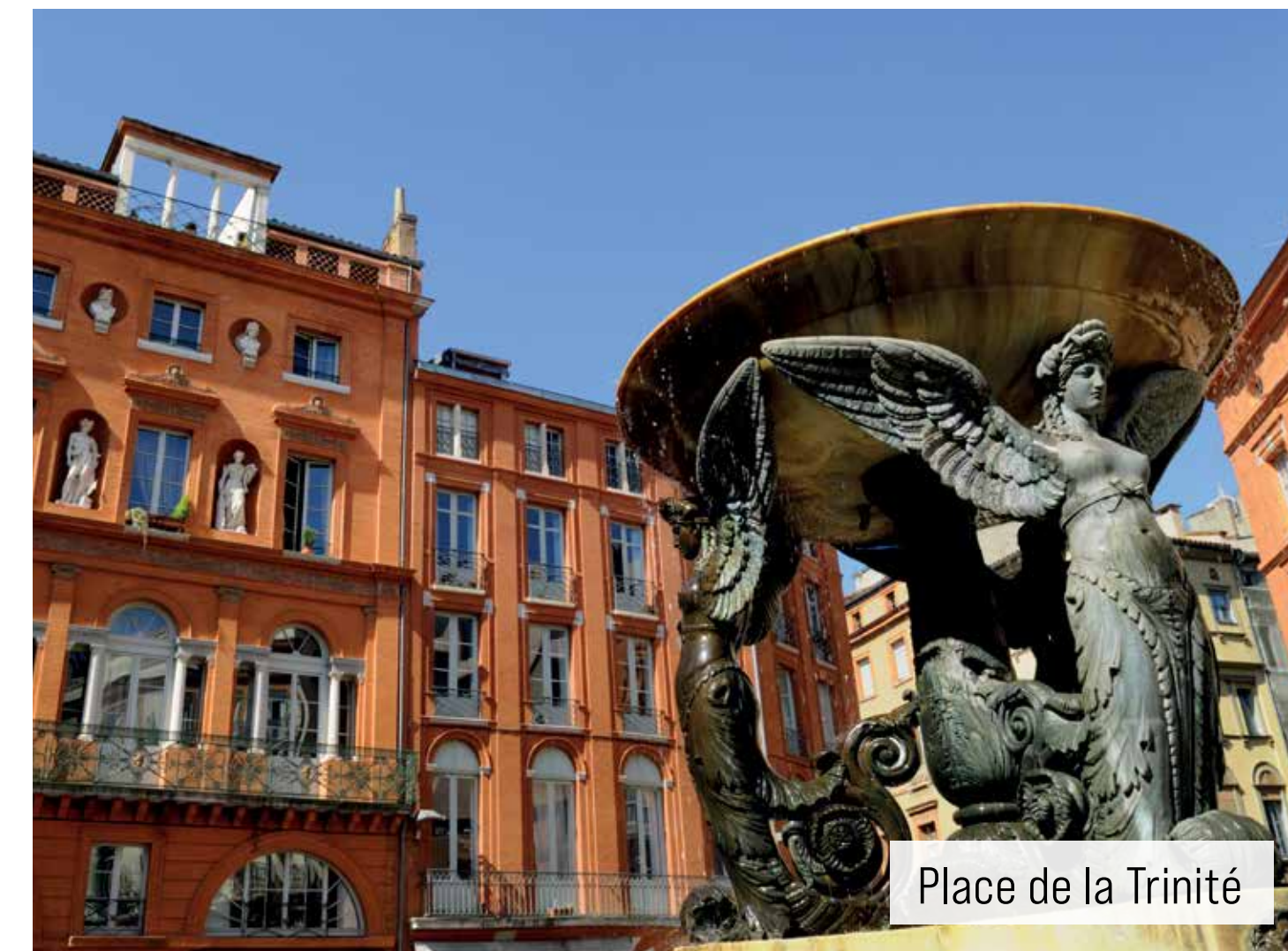
Place de la Trinité