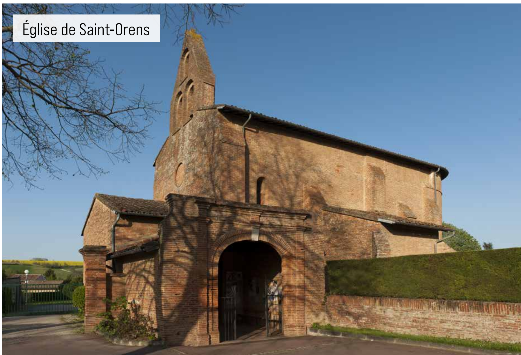
Église de Saint-Orens