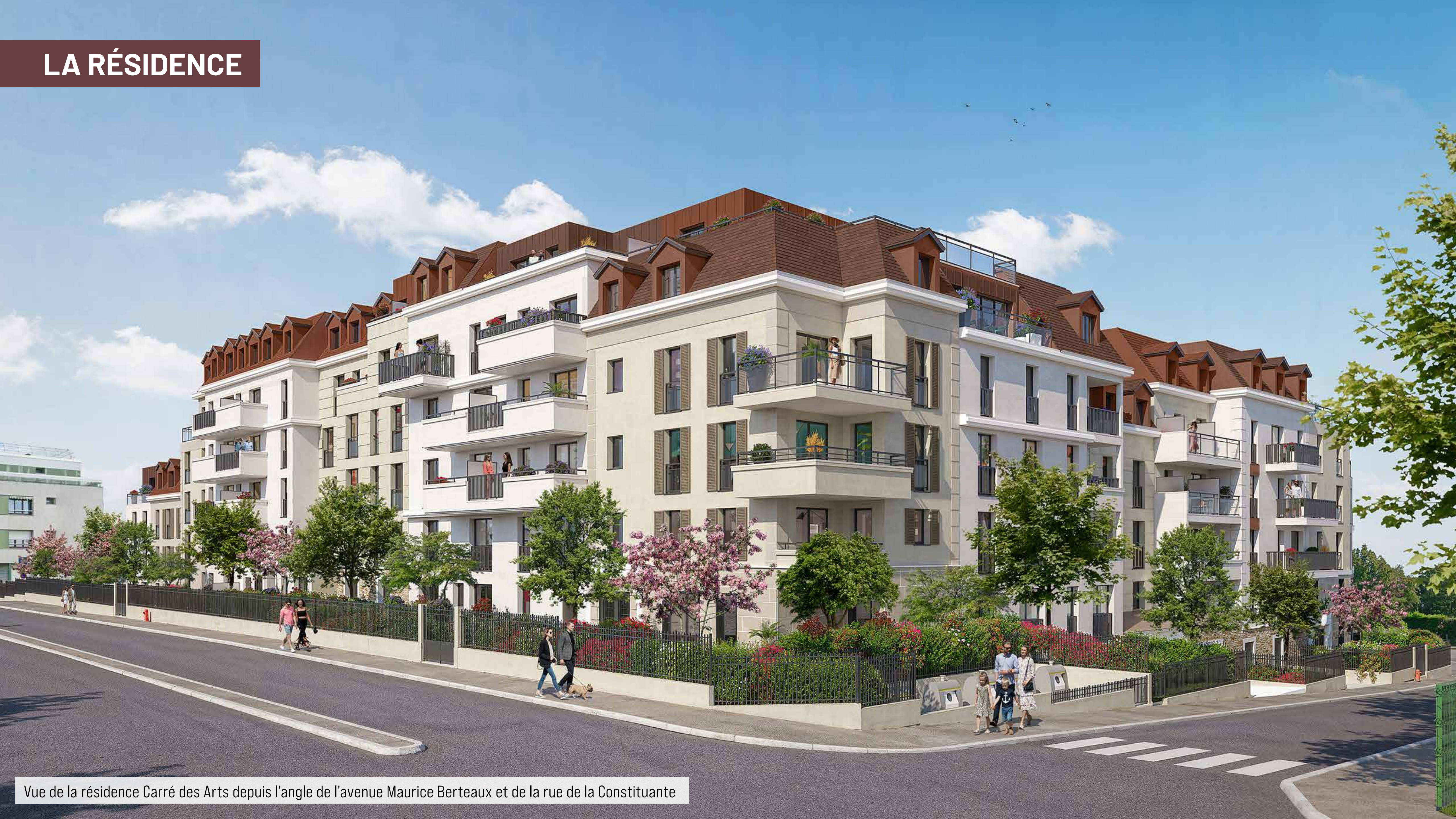
Vue de la résidence Carré des Arts depuis l'angle de l'avenue Maurice Berteaux et de la rue de la Constituante