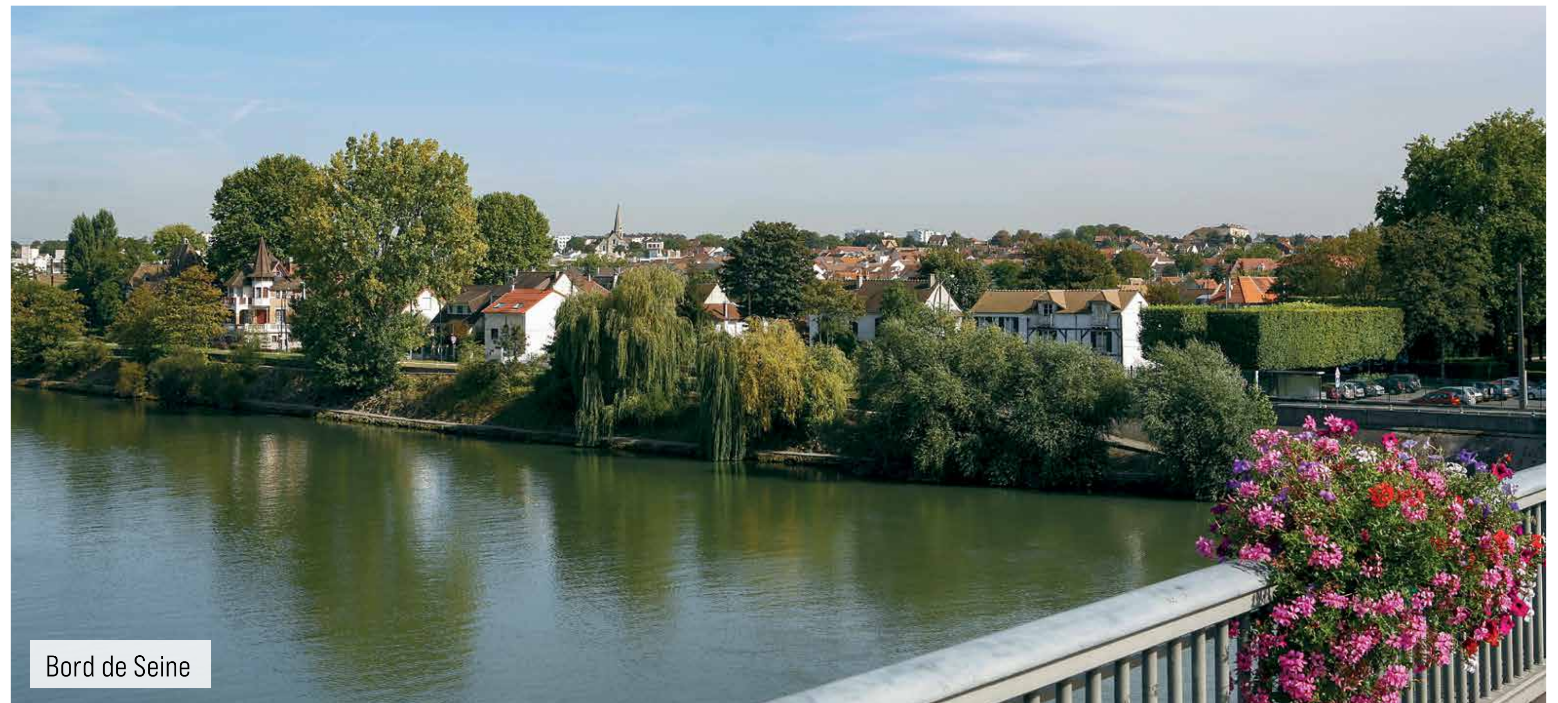
Bord de Seine