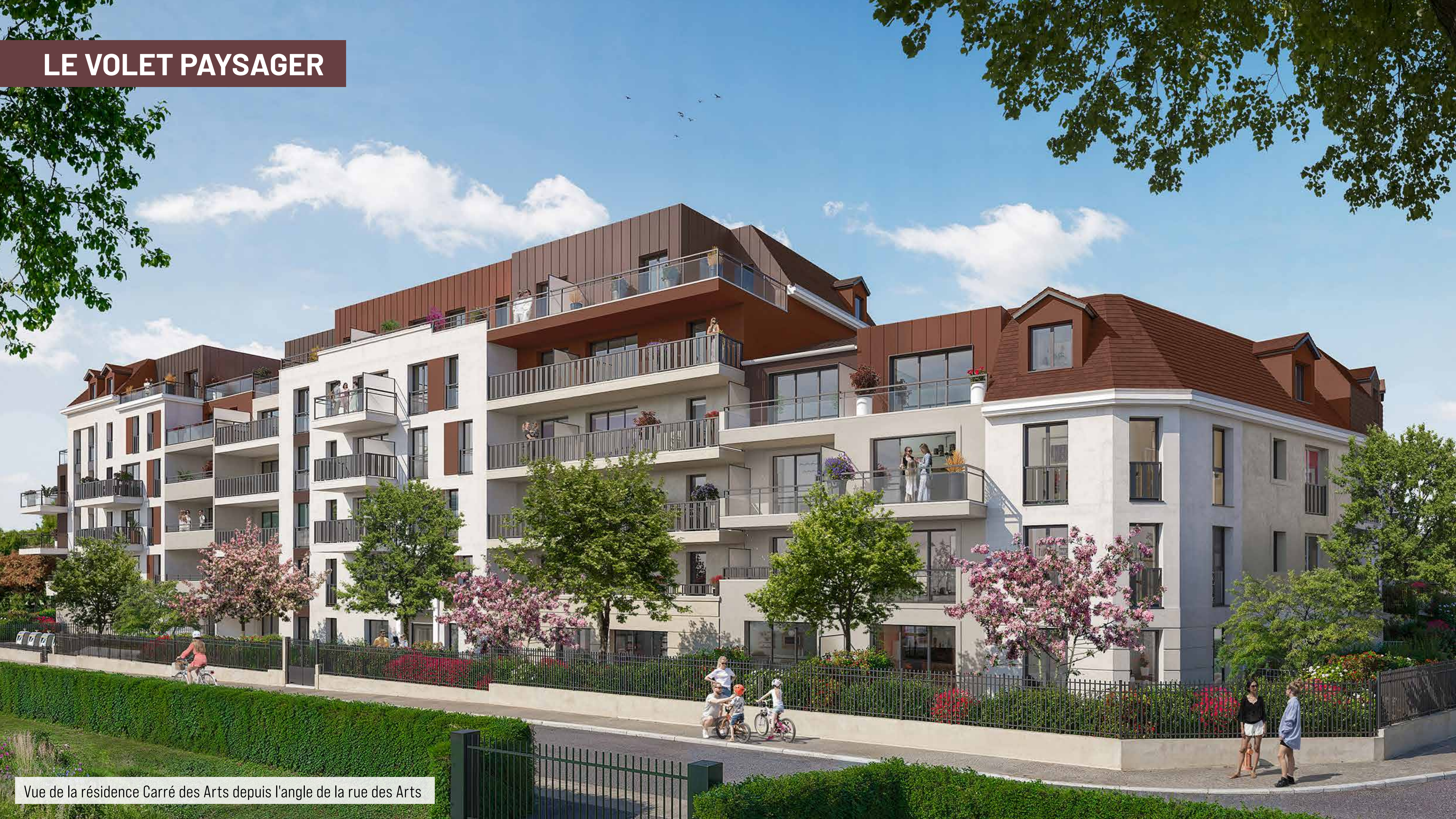
Vue de la résidence Carré des Arts depuis l'angle de la rue des Arts