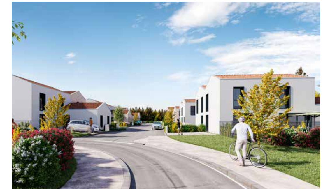
Villa Brugeaise à Bruges Architecte : Atelier Alonso Sarraute Associés