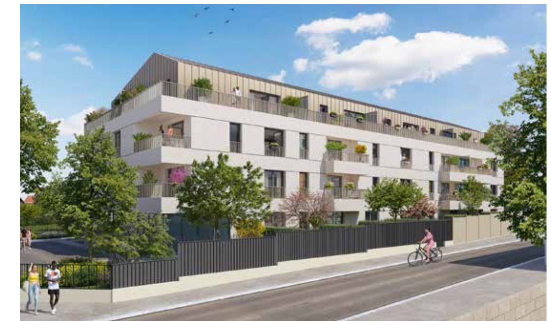
Résidence Le Coty à Ambarès-et-Lagrave Architecte : M2L Architectes