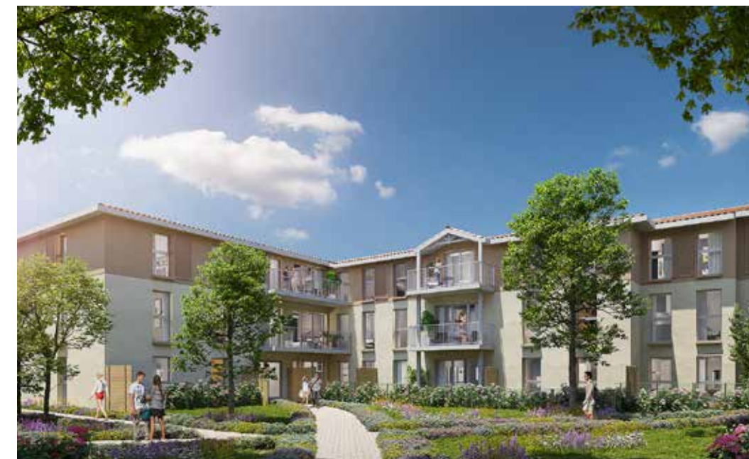
Hameau du Minoy à Salles Architecte : Agence Urb1n