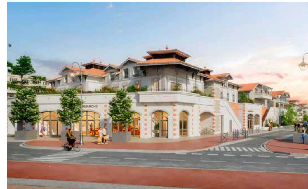
Villas Beurivage à Arcachon Architecte : Agence De Folmont et Camus