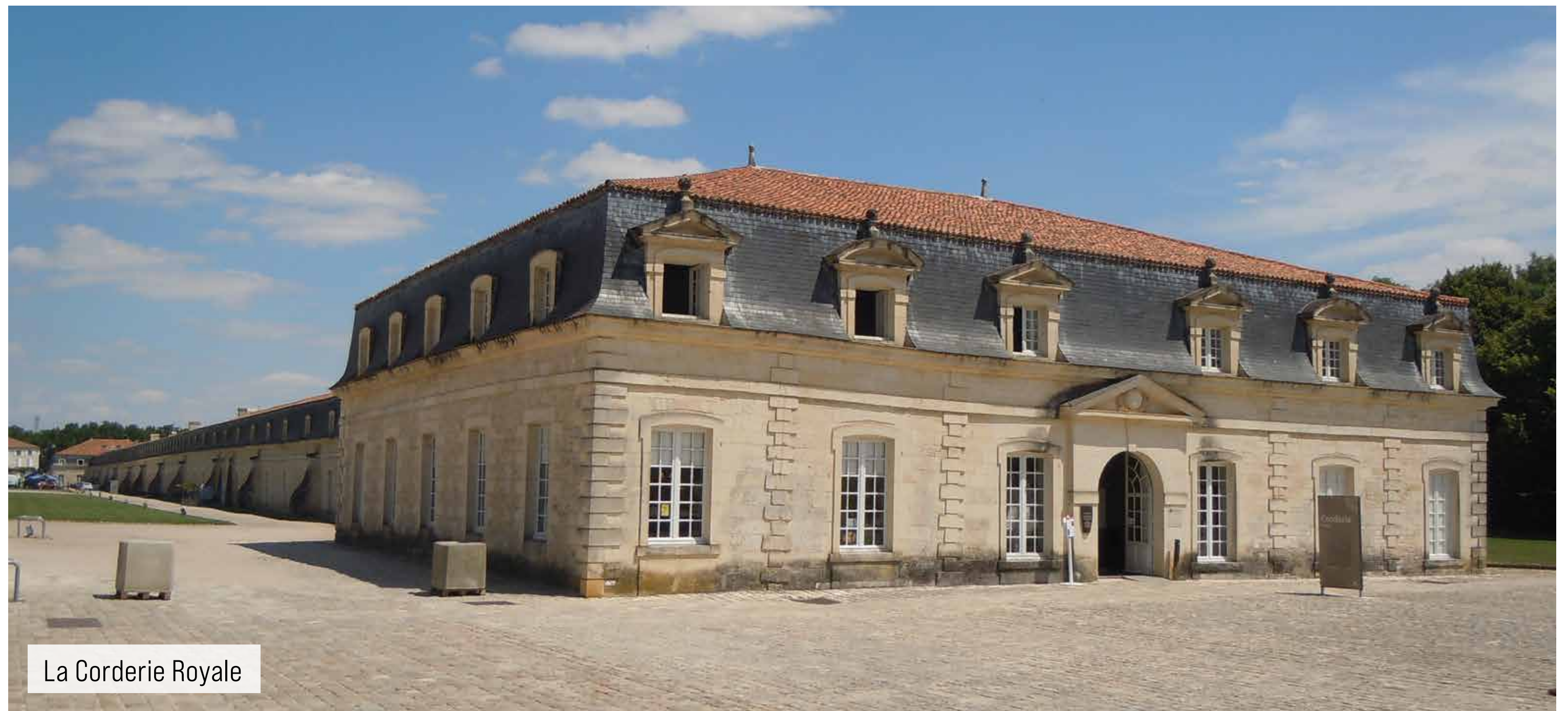
La Corderie Royale