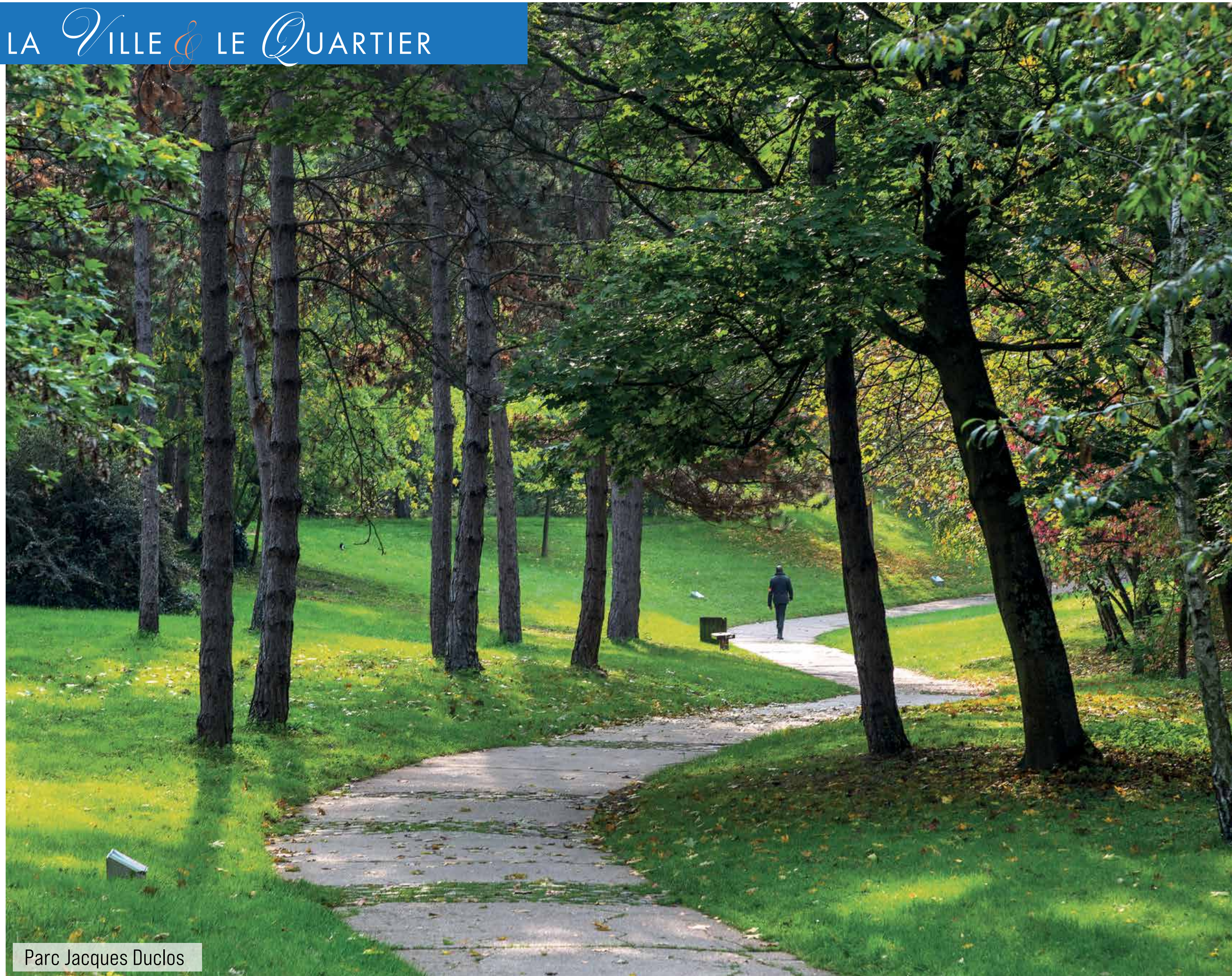
Parc Jacques Duclos