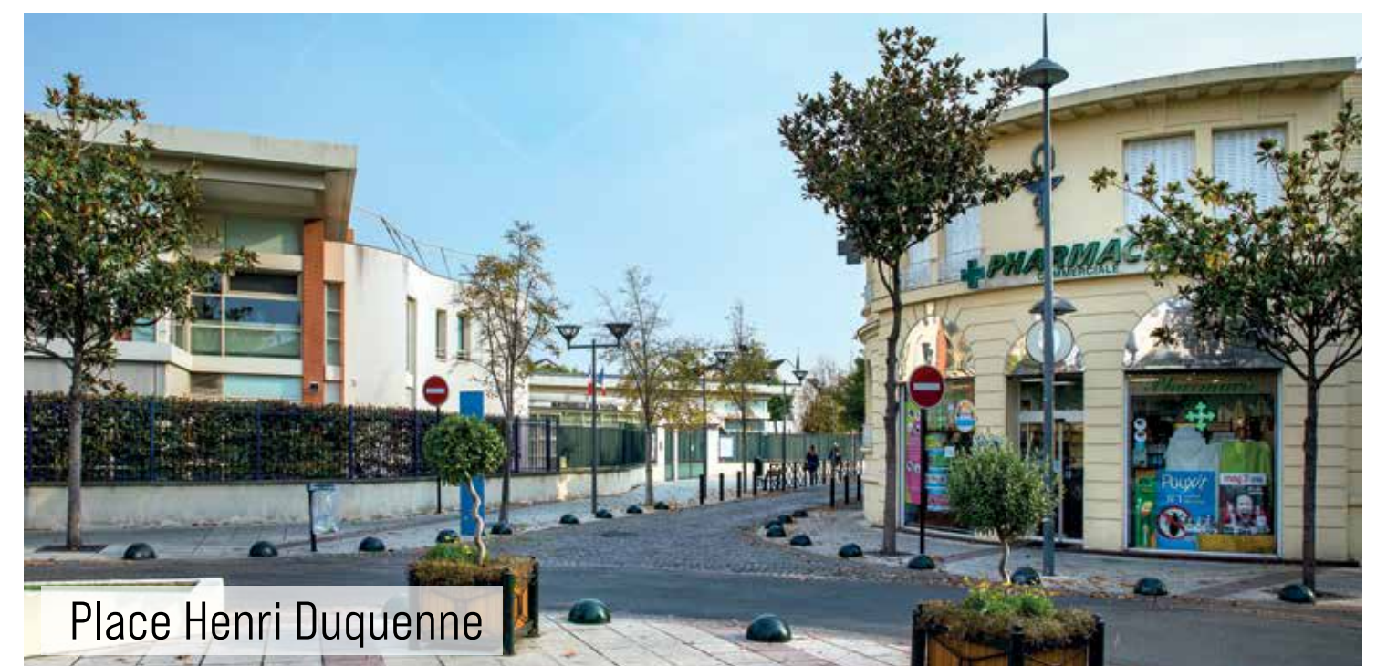
Place Henri Duquenne