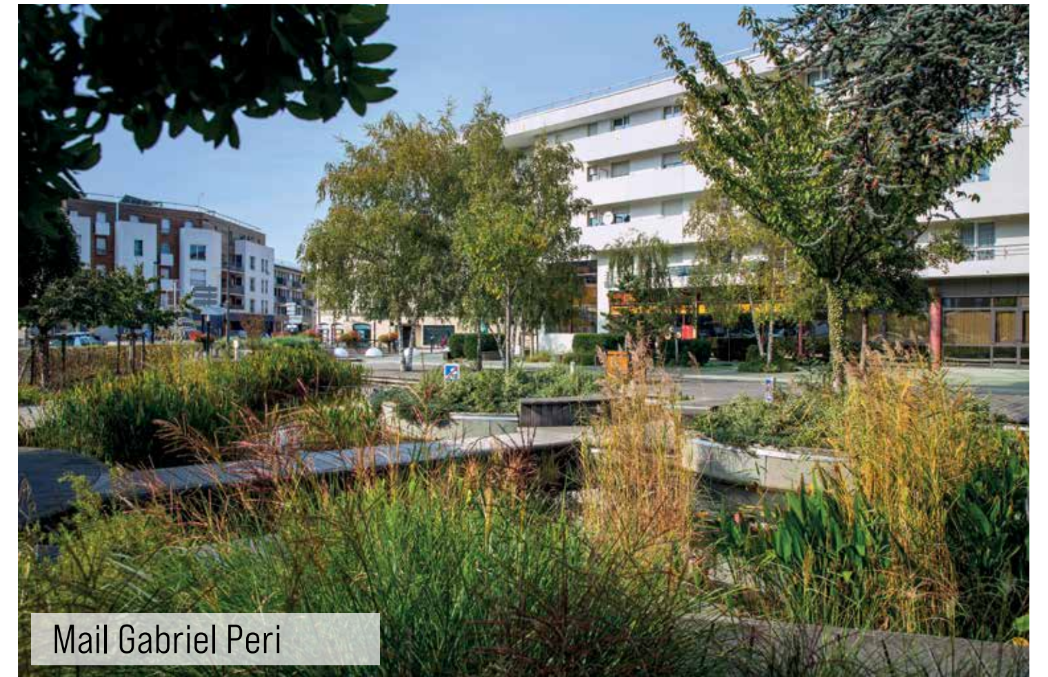
Mail Gabriel Peri