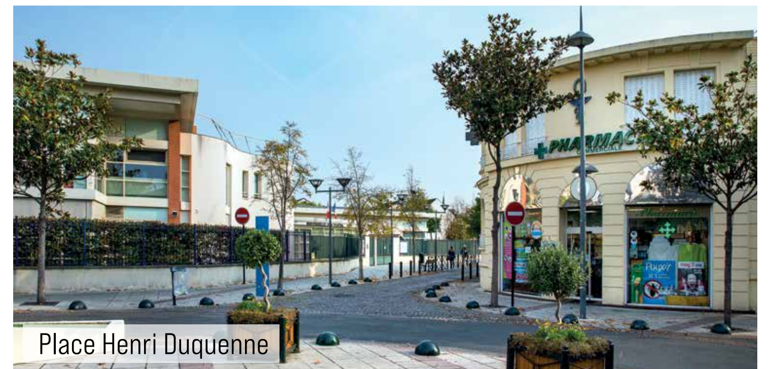
Place Henri Duquenne