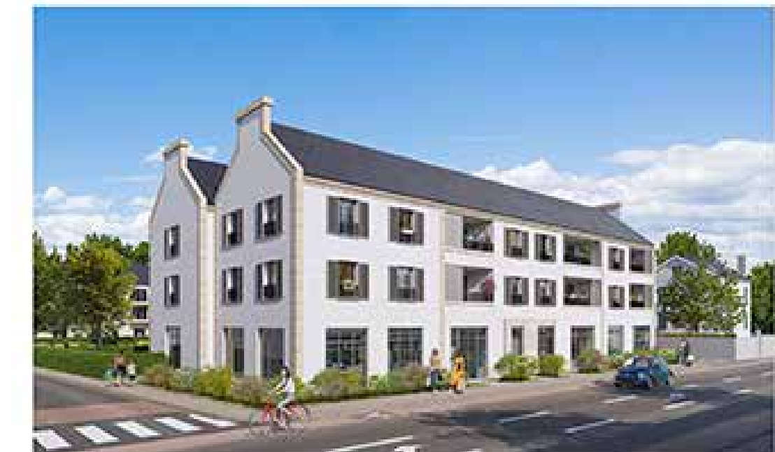
Le Clos Ty Guen à Auray Architecte : Atelier CAP Architecture