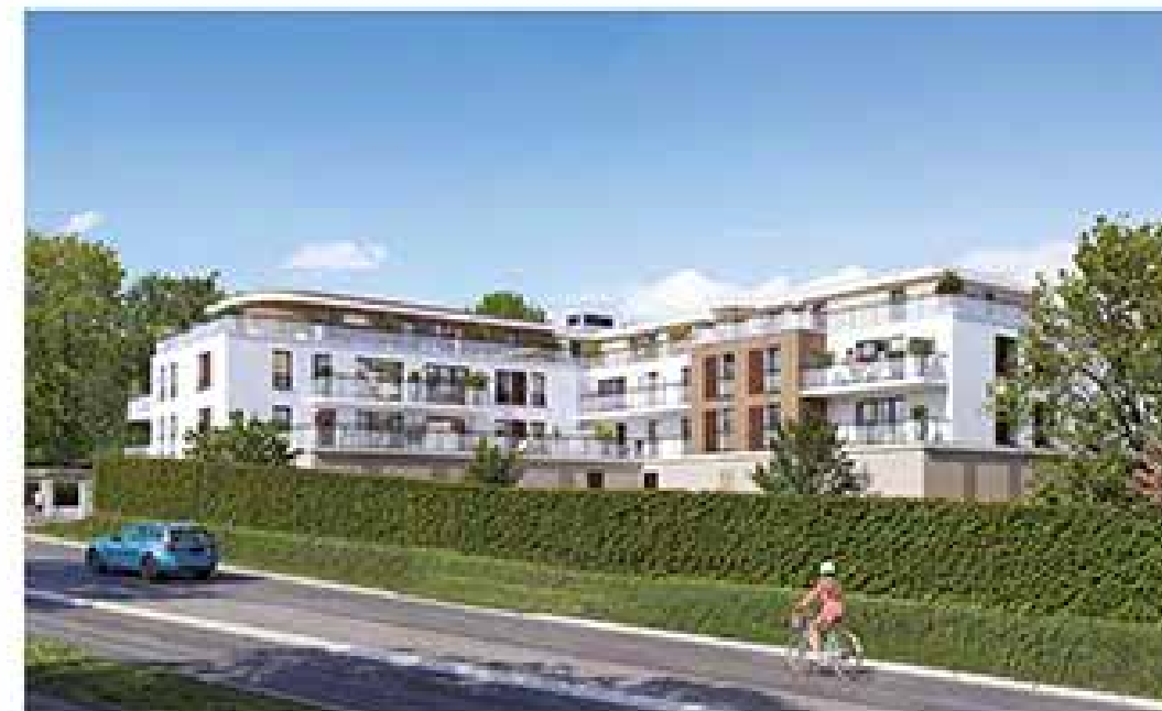
Les Terrasses du Golfe à Arradon Architecte : Agence Organic Architecture