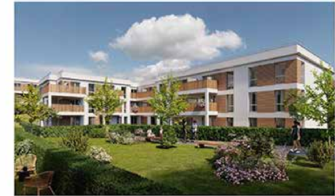
Les Jardins des Rives à Pontivy Architecte : ESGB Architectes