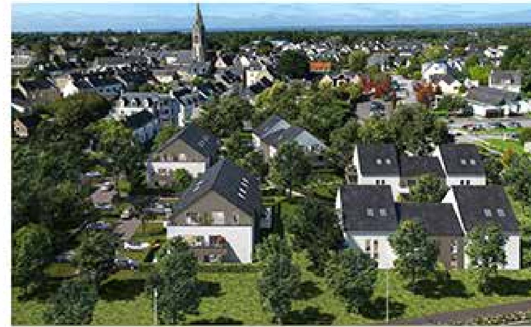
Domaine de Ker Bihan à Surzur Architecte : Archi & Partners International