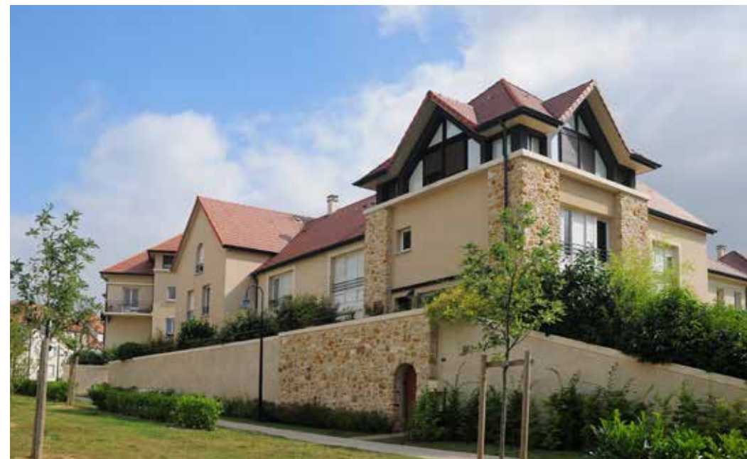
Chessy Village à Chessy Architecte : Lionel de Segonzac