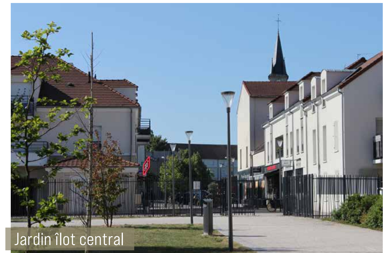
Jardin îlot central