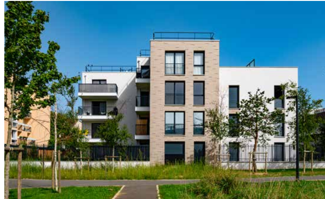
Nouvel Horizon à Roissy-en-Brie Architecte : Agence Marie-Odile Foucras