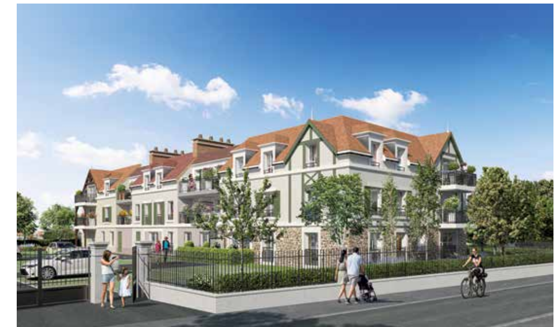
Les Jardins Jasmin à Tournan-en-Brie Architecte : Organic Architecture