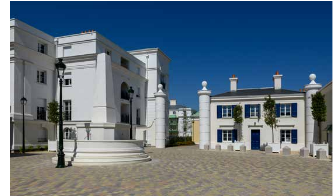
Domaine Régence à Serris Architectes : John Simpson Architects, Paris Classical et Architecture et Atelier BLM