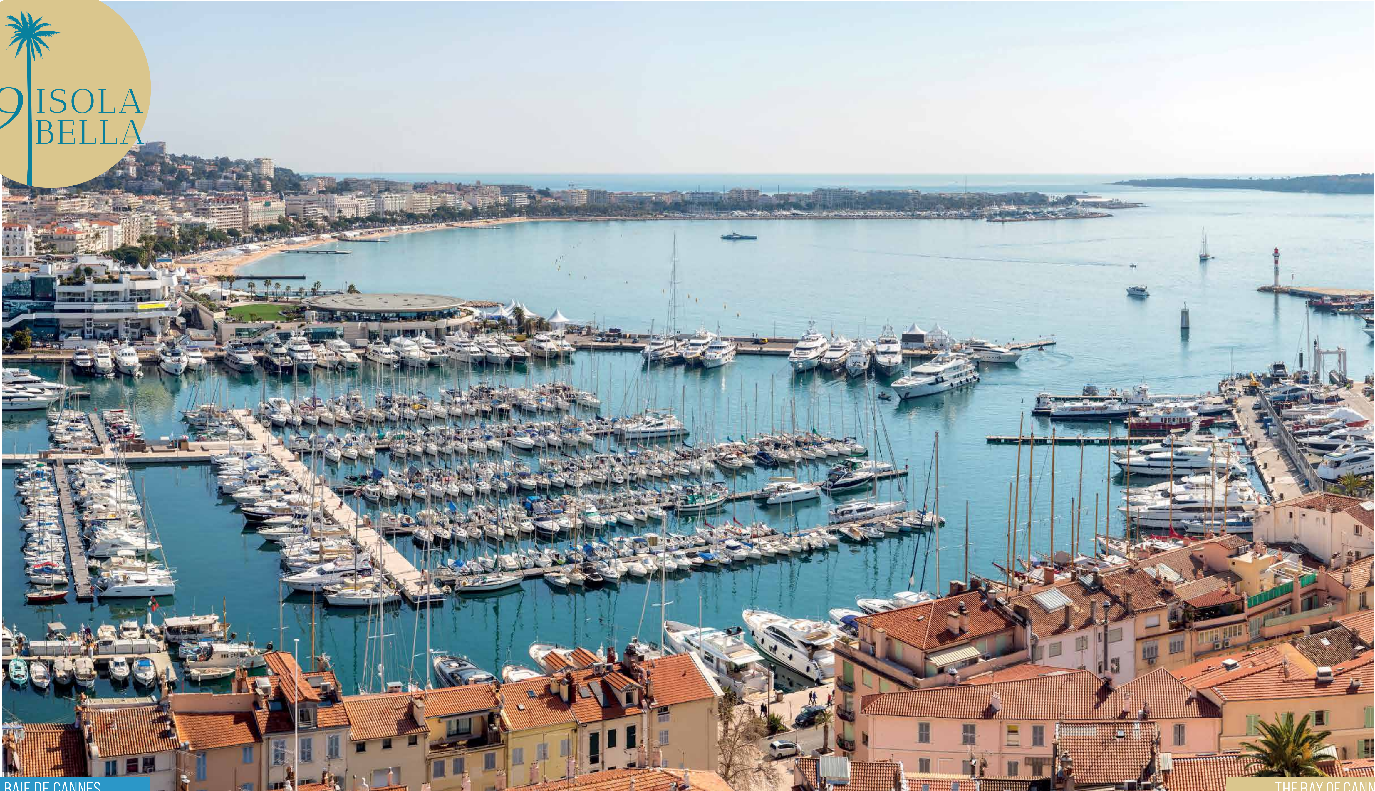
LA BAIE DE CANNES