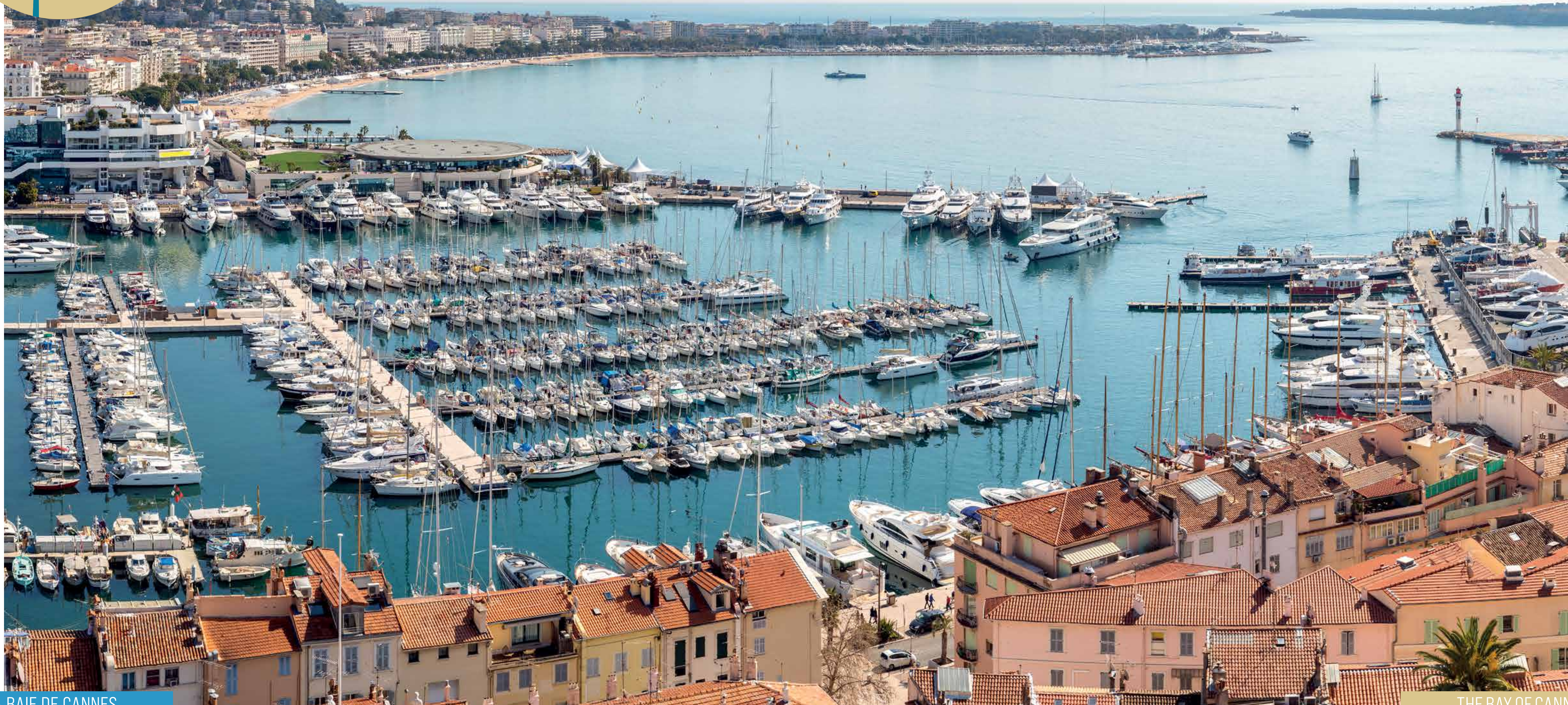
LA BAIE DE CANNES