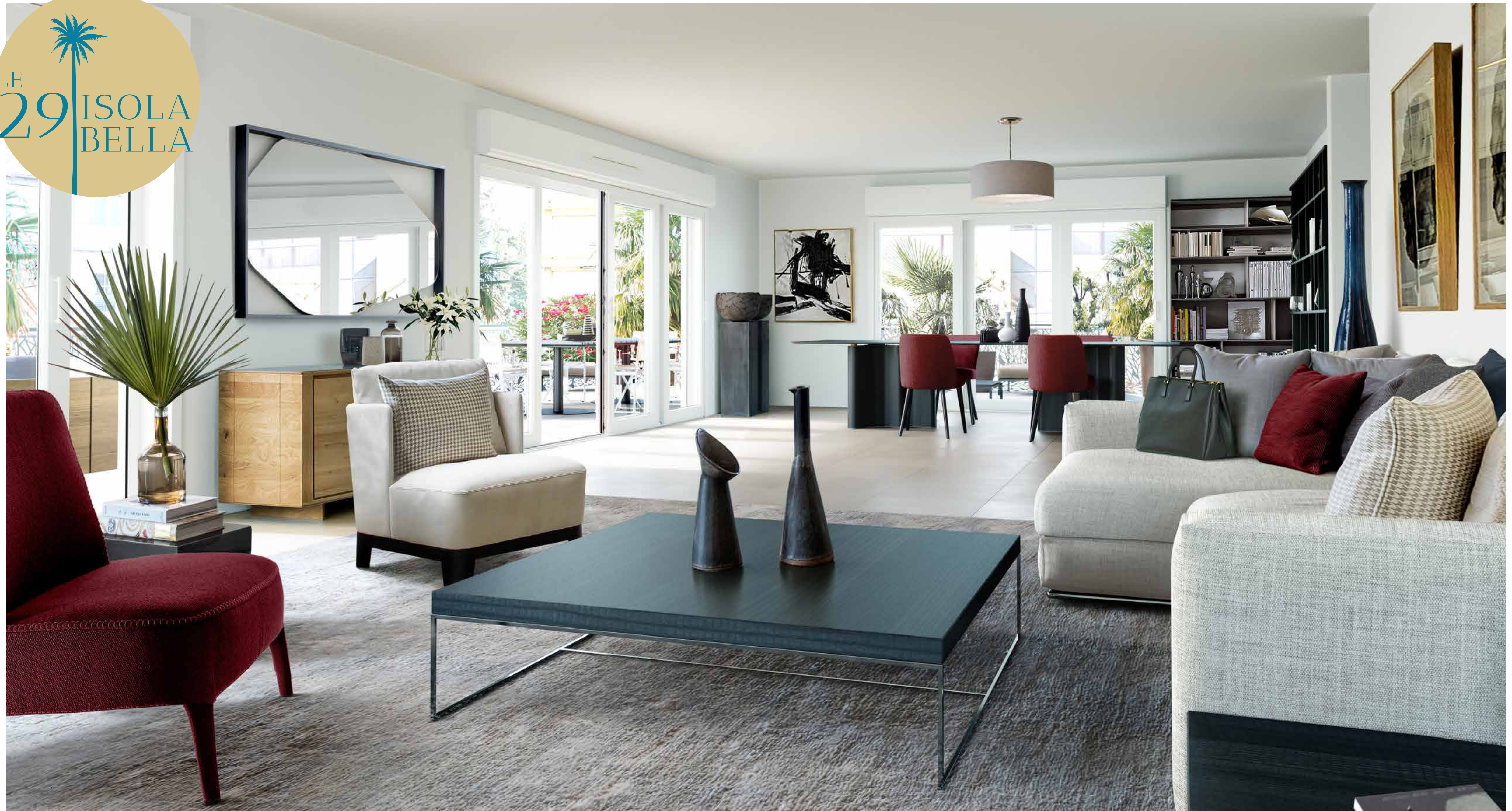
Plan non contractuel à caractère d'ambiance