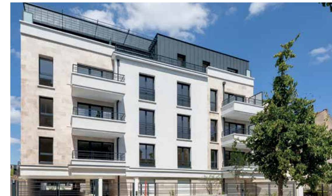
Villa Flora - Fontenay-sous-Bois