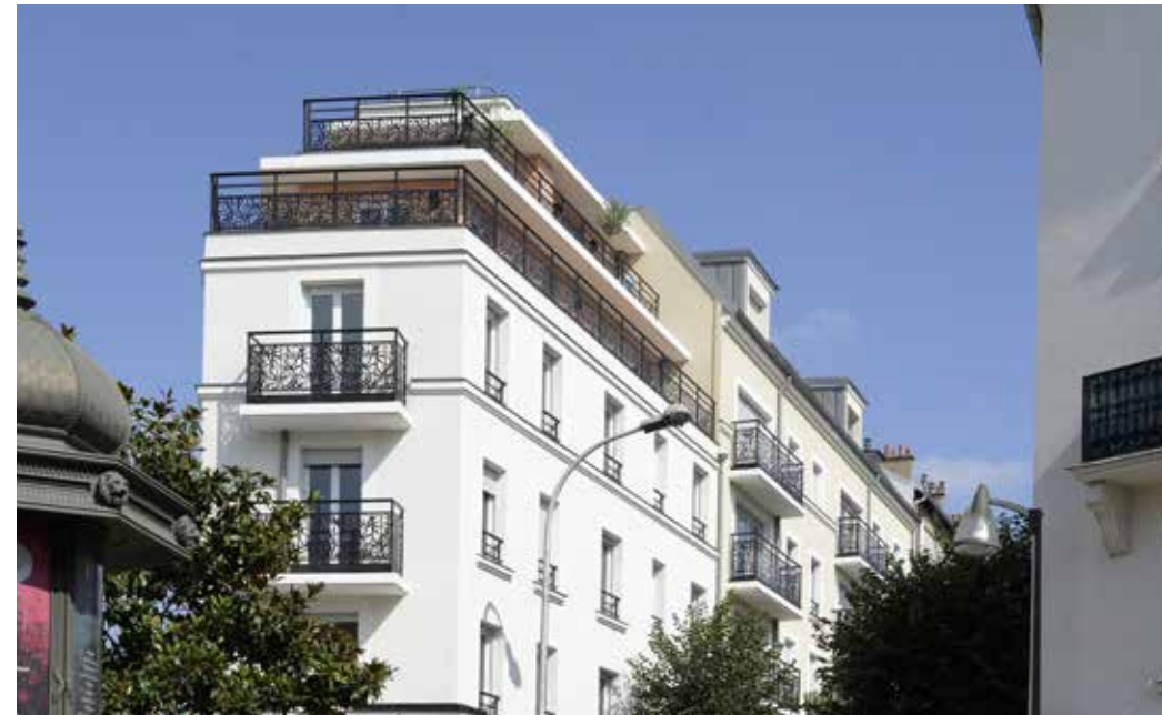
Côté Ville - Le Perreux-sur-Marne