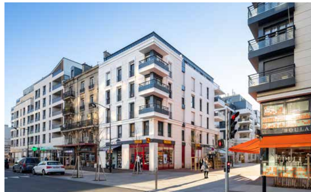
26 rue de Paris - Joinville-le-Pont