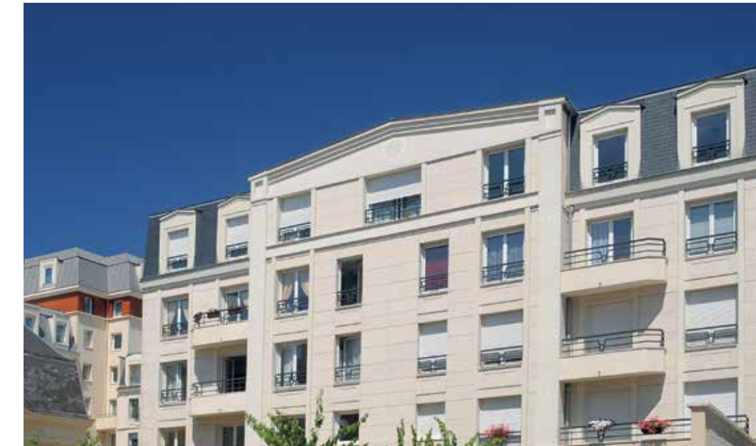
Les Chartreuses - Charenton-le-Pont