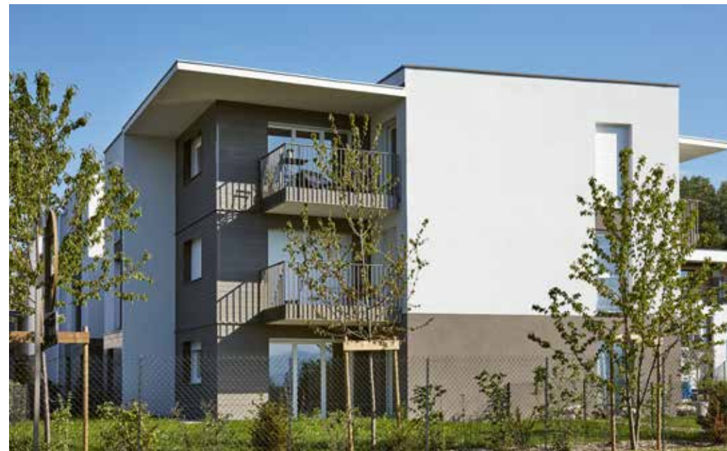
Les Hauts du Lac à Anthy-sur-Léman Architecte : David Ferré