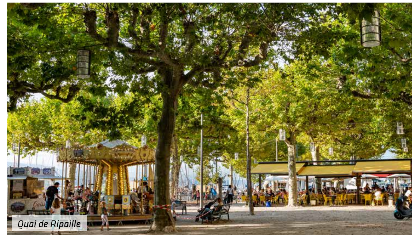
Quai de Ripaille