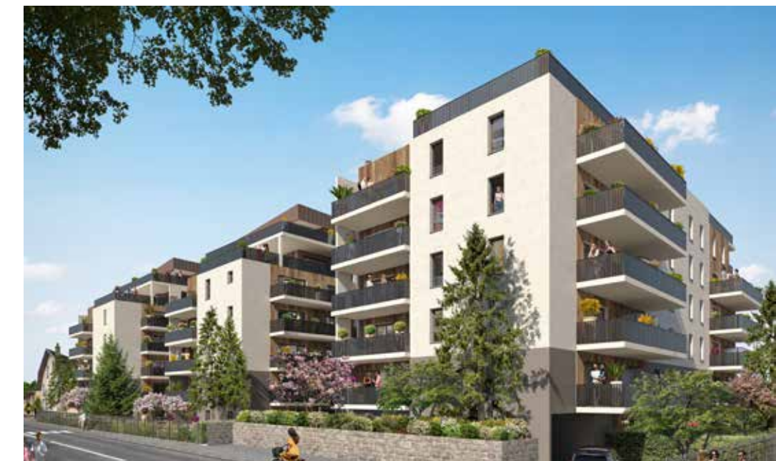
Le Belvédère du Léman à Thonon-les-Bains Architecte : Chambre & Vibert