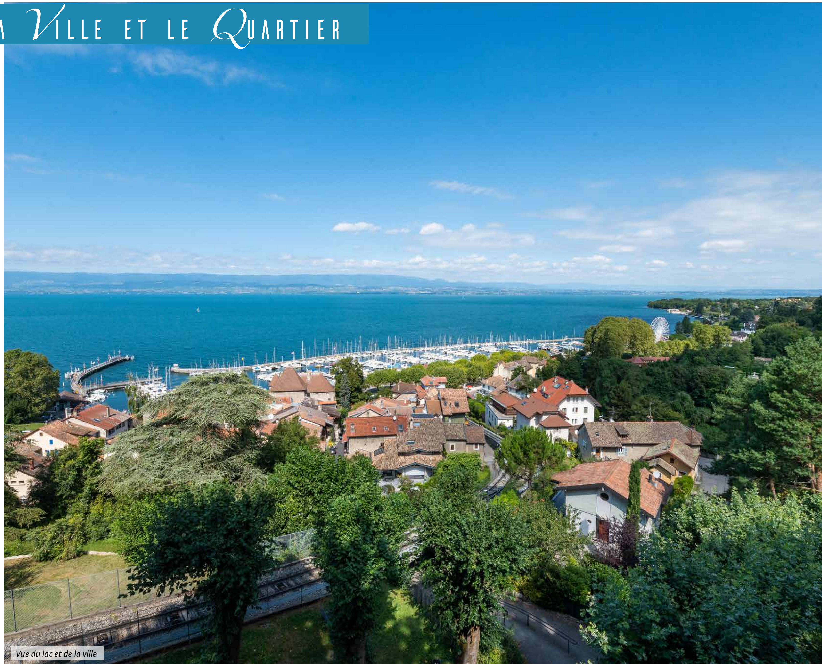
Vue du lac et de la ville