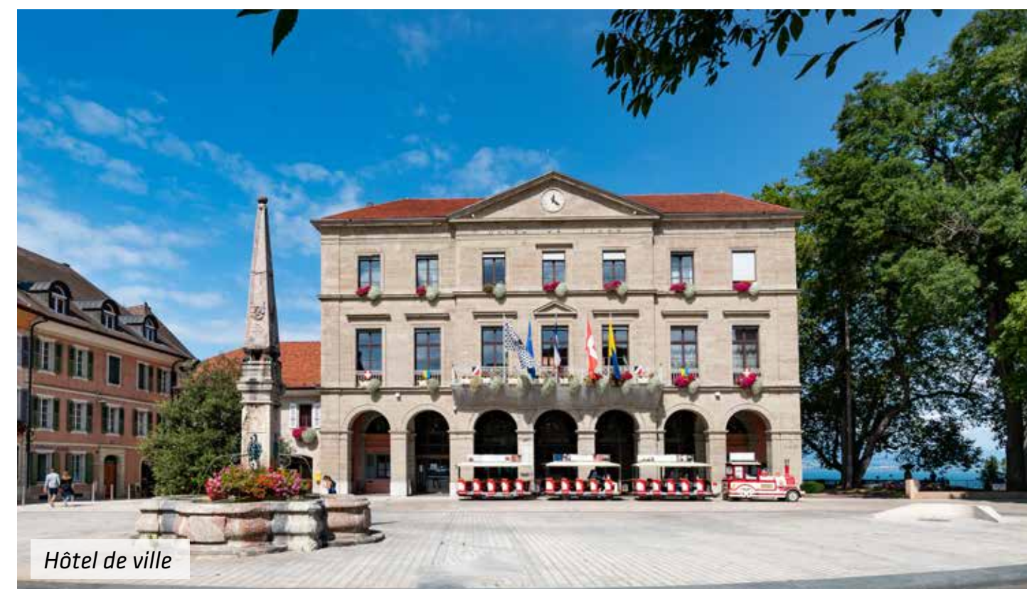
Hôtel de ville