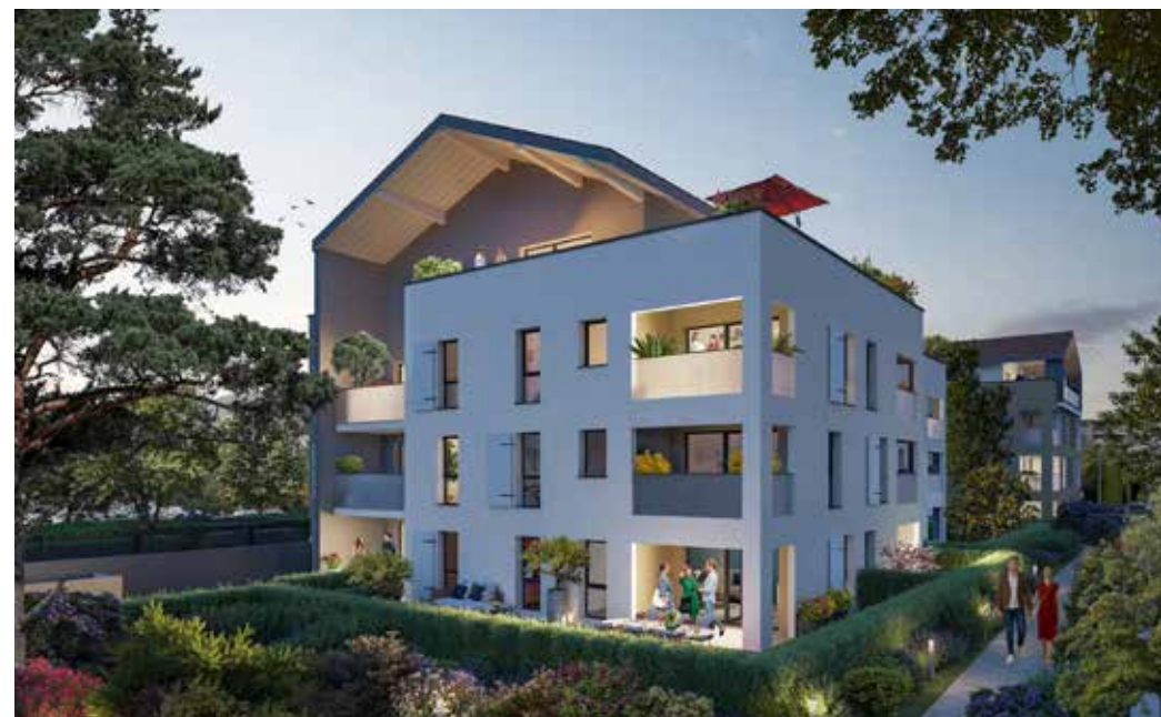
XIII Concise à Thonon-les-Bains Architecte : Unanime Architectes