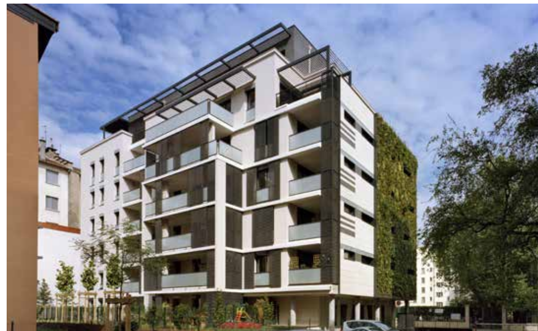
34 Rue Lt Col Prévost à Lyon 6 ème Architecte : Franck Dreidemie