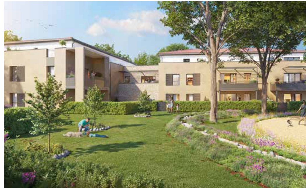
Le Hameau Bellevue à Brindas Architecte : Archigroup