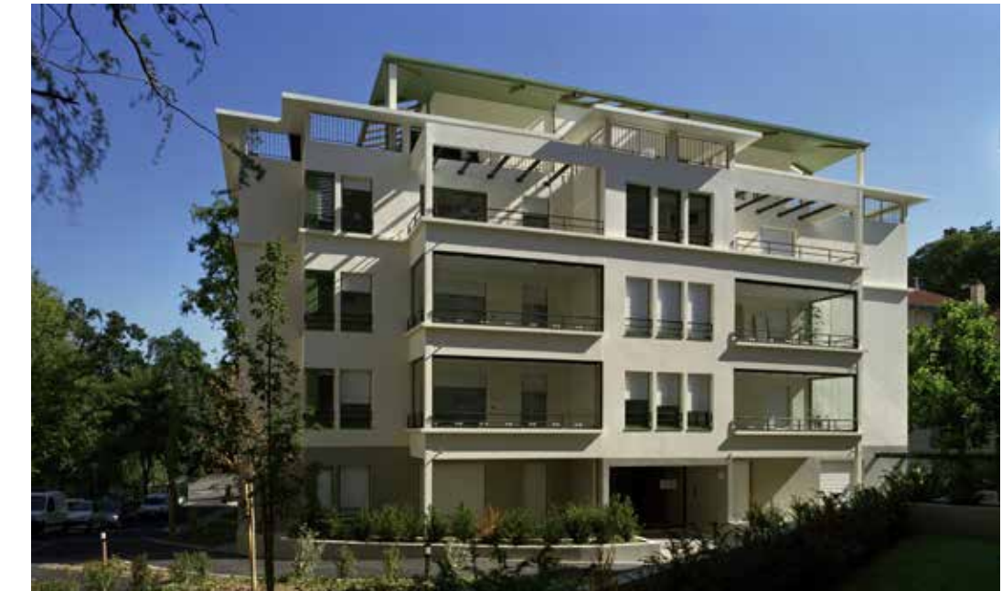
Le Parc des Ombelles à Lyon 5 ème Architecte : Maurice Angel Architecte