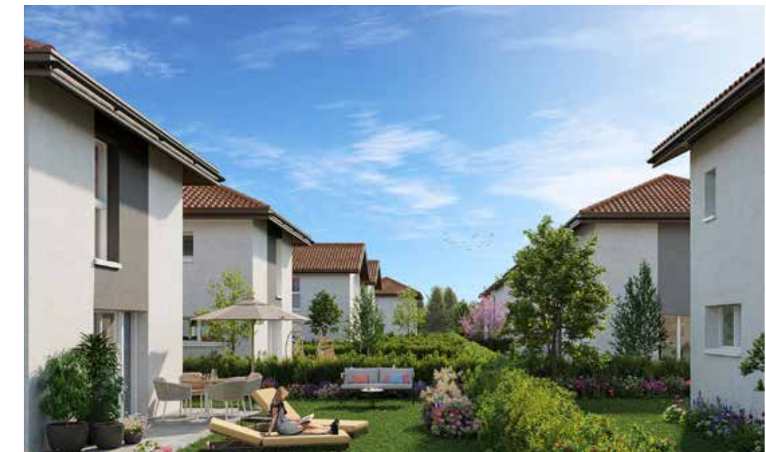
Le Clos des Frênes à Marignier Architecte : Cabinet Ferré