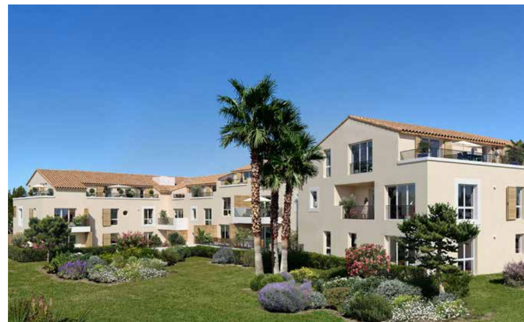
Grand Large à Martigues