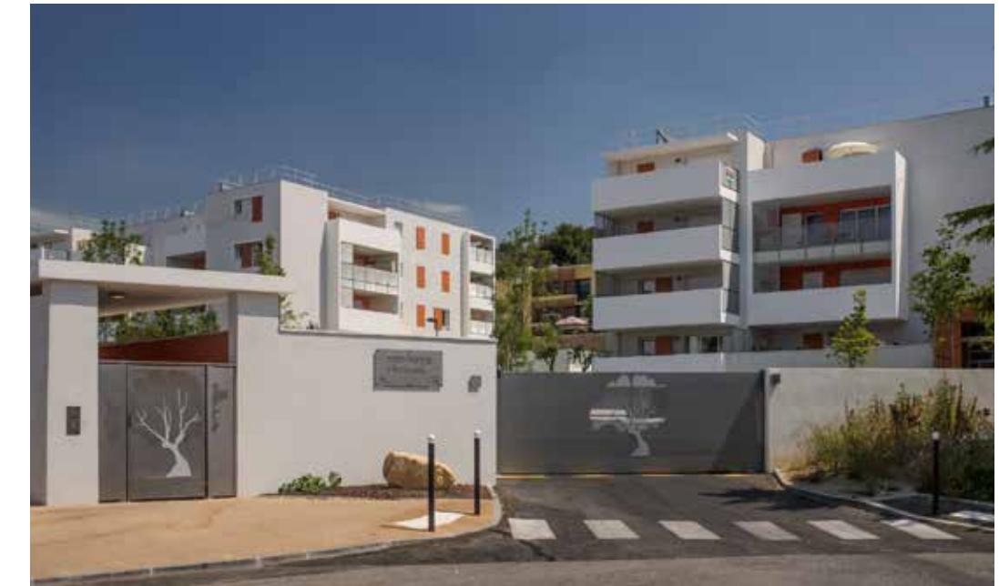
Résidence Monticelli à Vitrolles