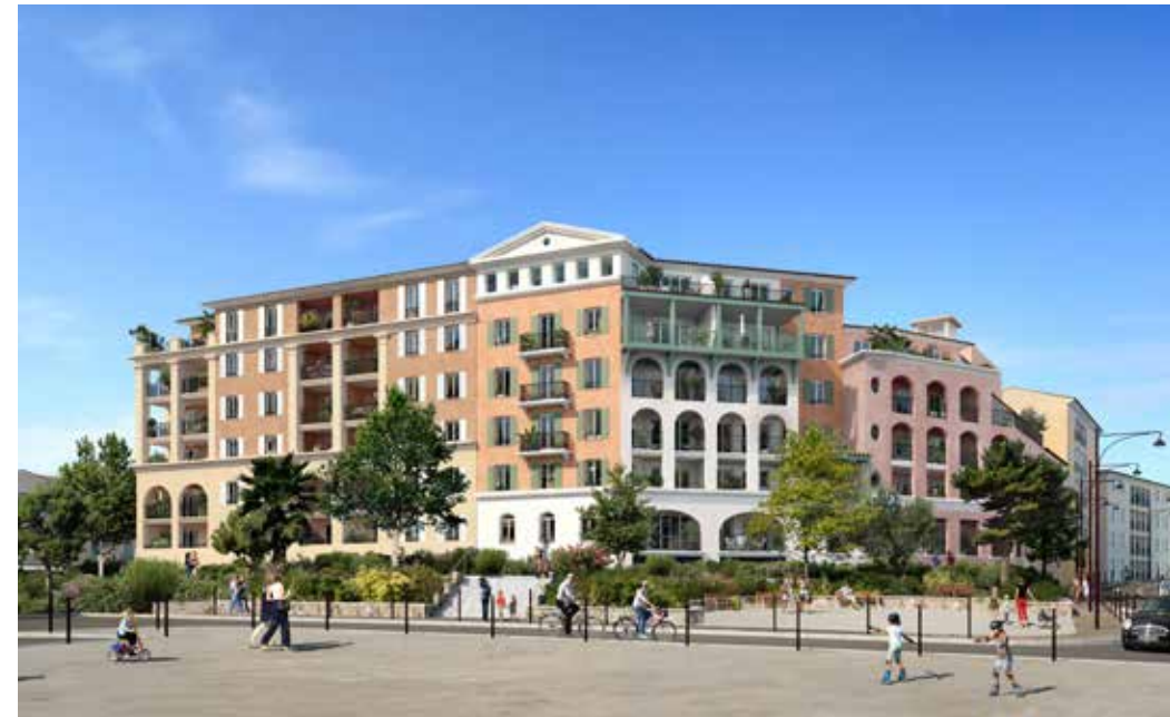
Villa Marina à Port-de-Bouc