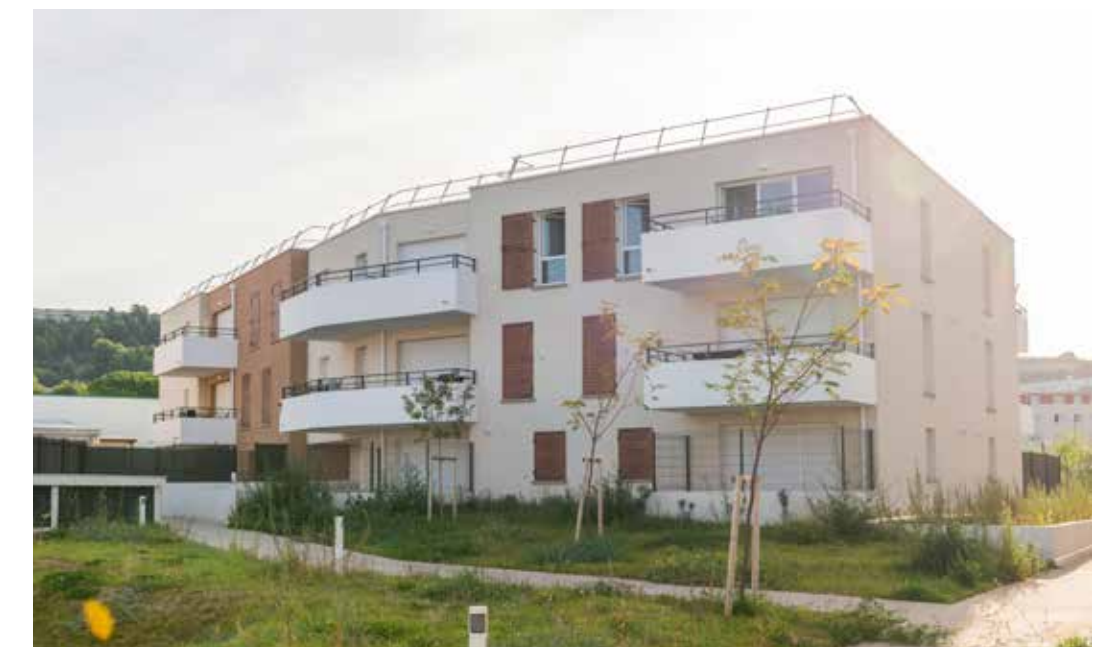
Jardins de l'Étang à Vitrolles