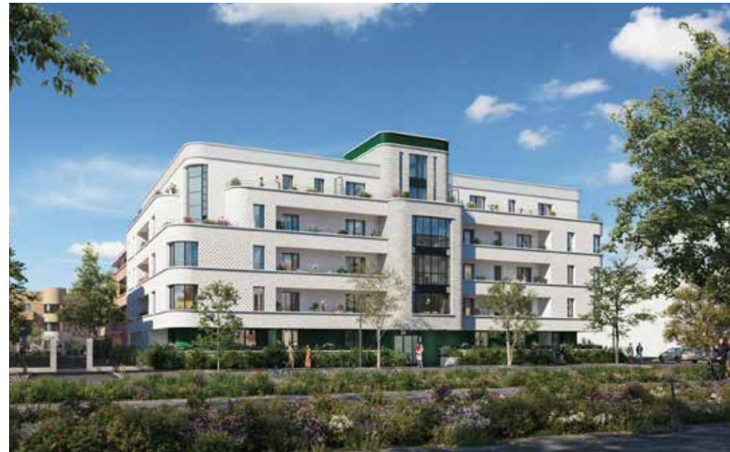
Le Liberty à Chessy Architecte : Barbarito Bancel