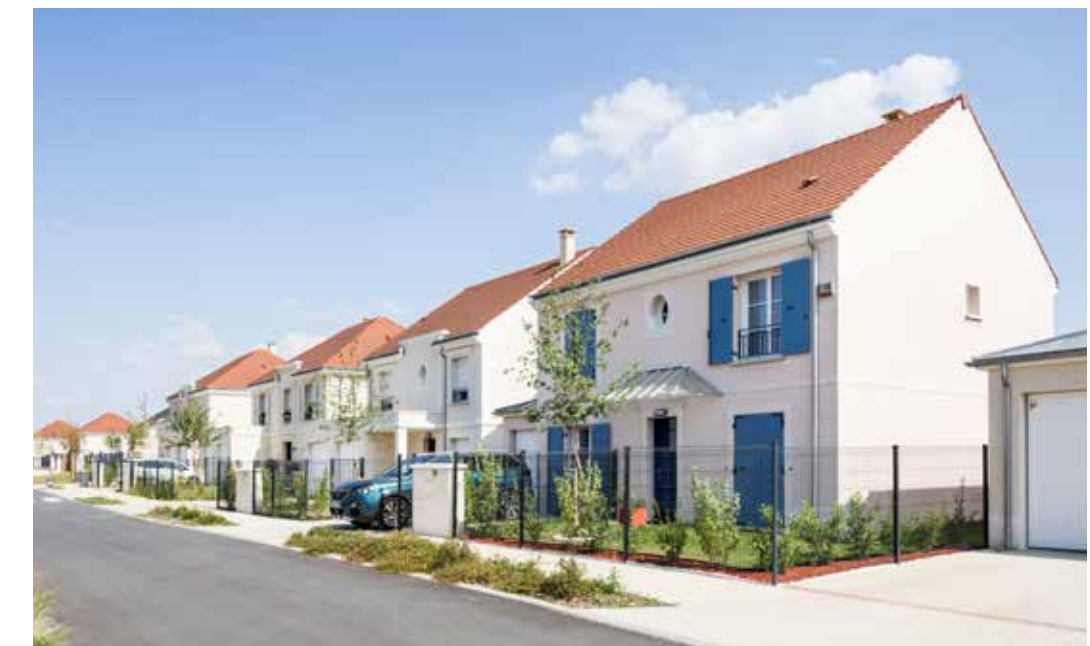
Domaine de l'Orangerie à Montévrain Architecte : Emmanuel GUTEL et Paul MEYER