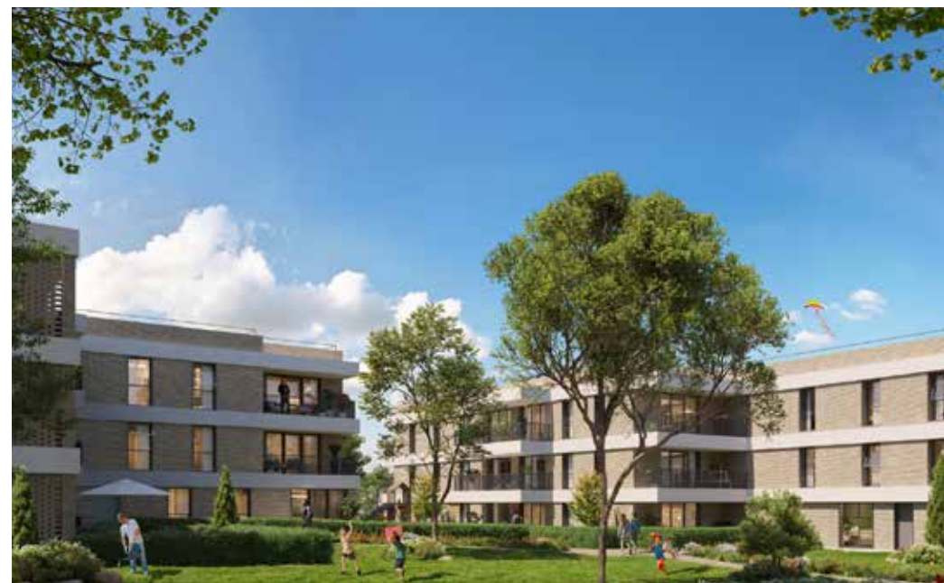
Plein Sud à Pomponne Architecte : Didier Zozio