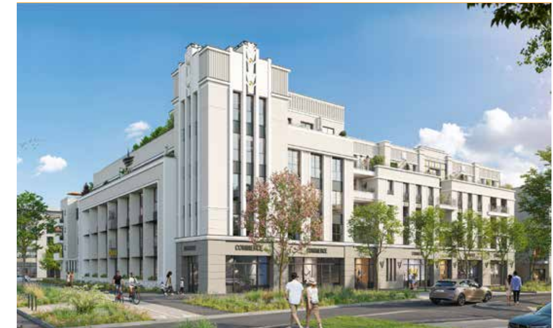
Le Dandy à Chessy Architecte : Agence Jenny & Lakatos