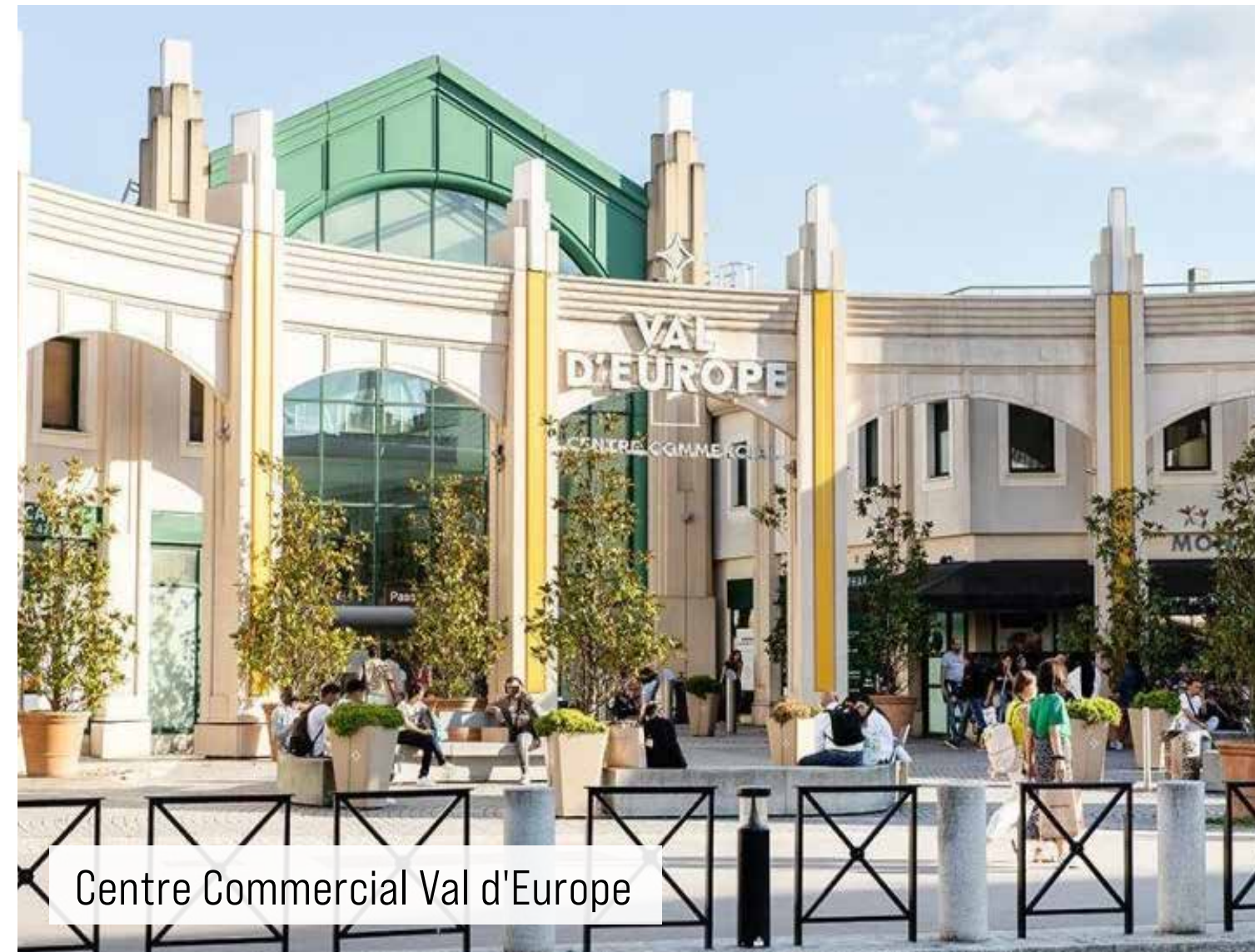
Centre Commercial Val d'Europe