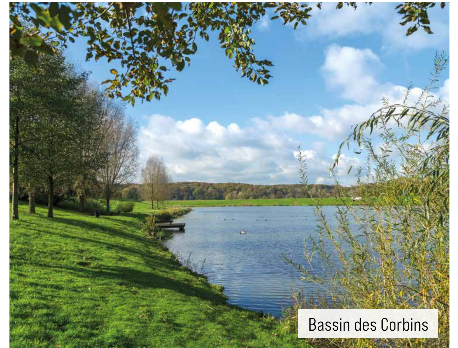
Bassin des Corbins