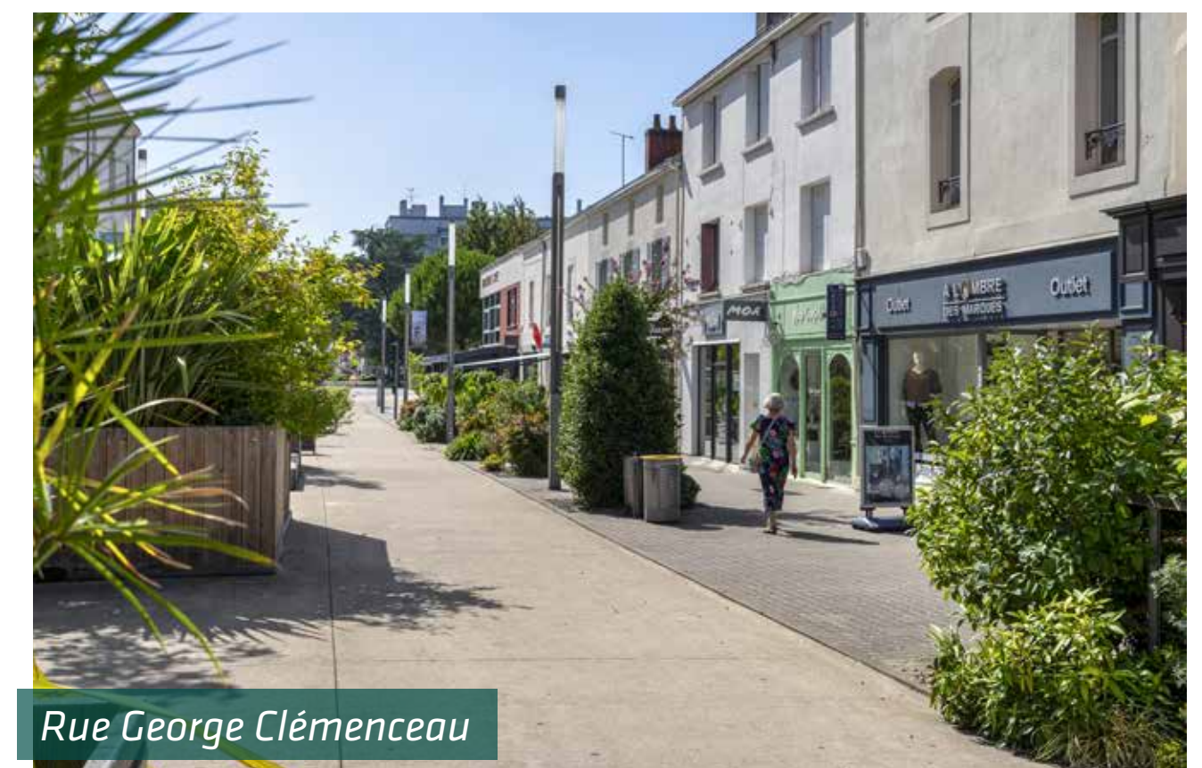
Rue George Clémenceau