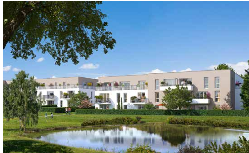
Le Parc de l'Étang - La Roche-sur-Yon Architecte : Agence EG2A