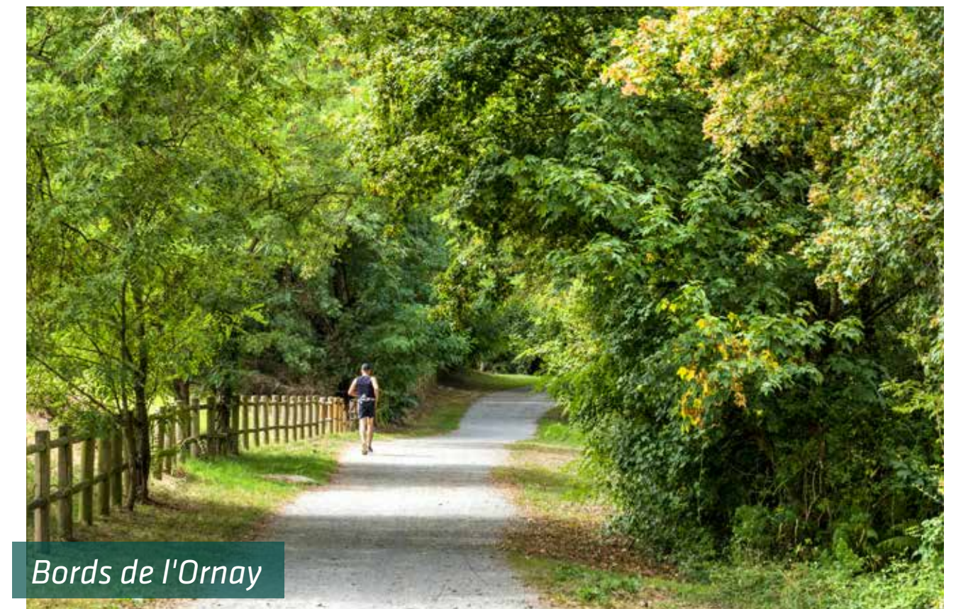
Bords de l'Ornay