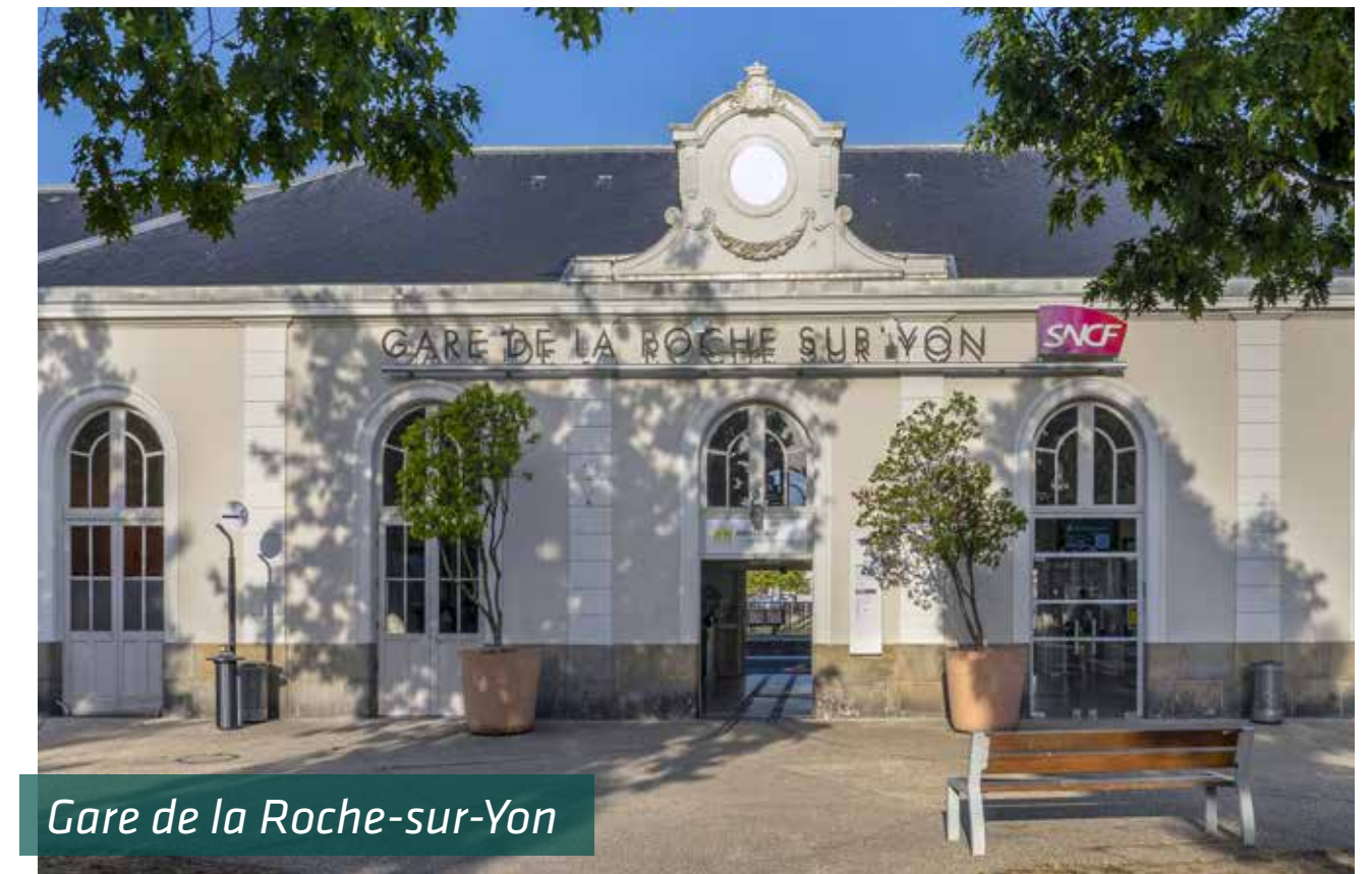
Gare de la Roche-sur-Yon