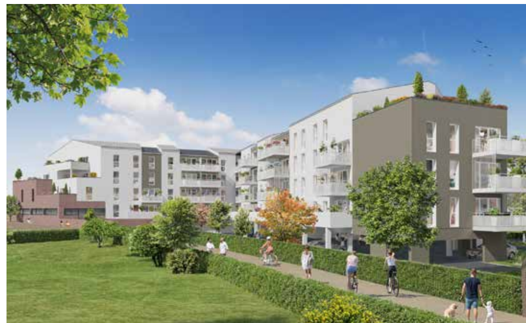
Les Jardins des Mauges - Cholet Architecte : Agence Archidea