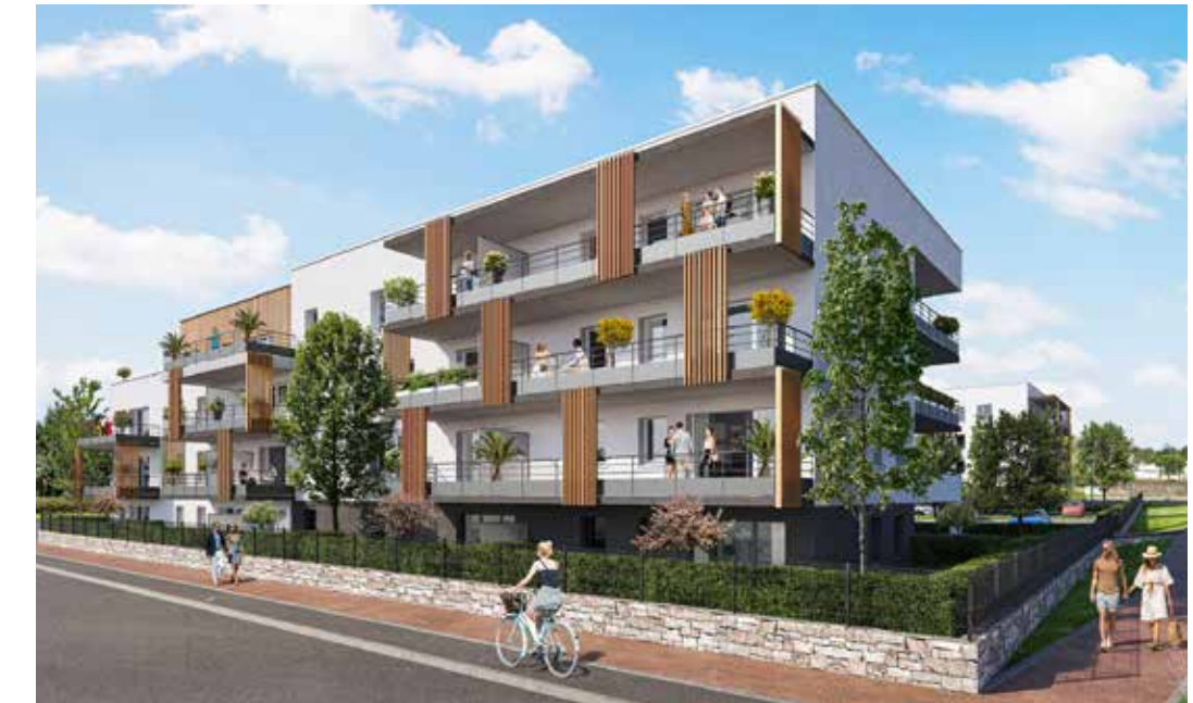
Les Boiseries du Landreau - Les Herbiers Architecte : Agence Archidea