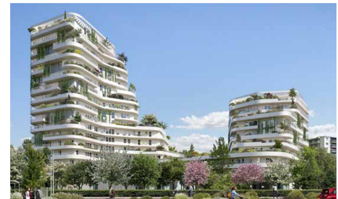
Harmony of the Sky - Saint Nazaire Architecte : Hamonic & Masson