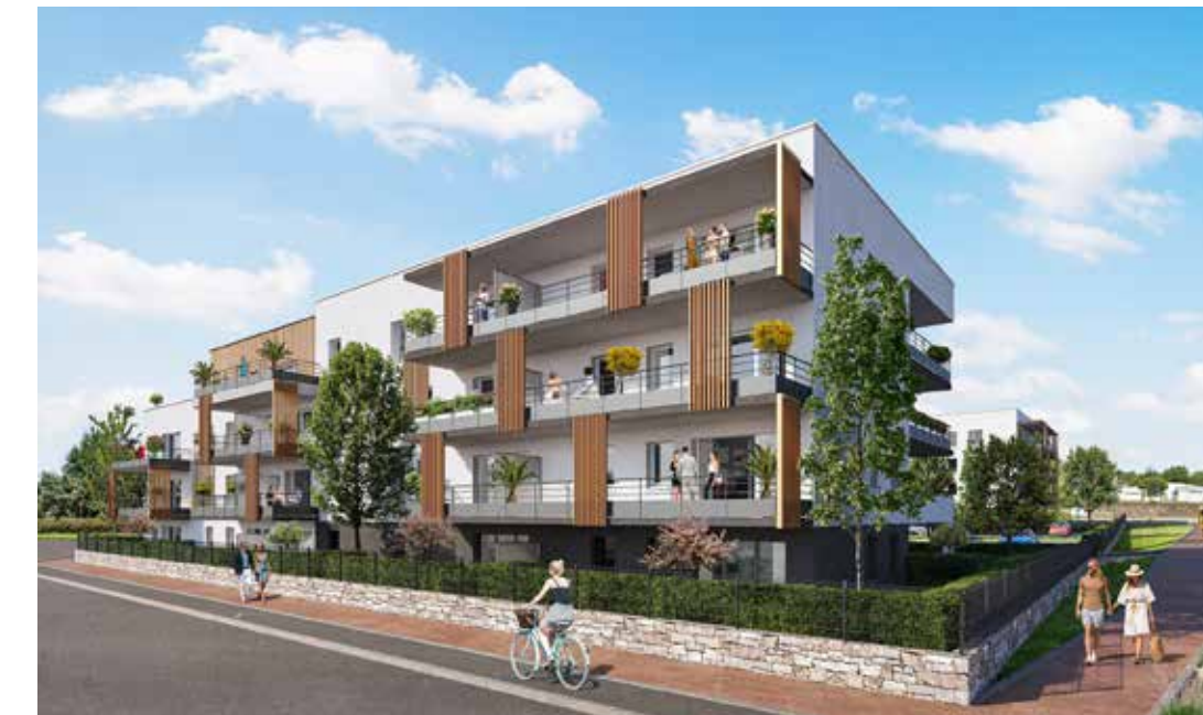
Les Boiseries du Landreau - Les Herbiers Architecte : Agence Archidea