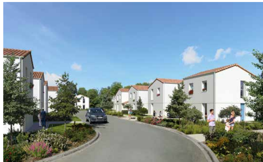
Le Bois Valentin - Saint-Jean-de-Monts Architecte : Agence d'architecture ACDM