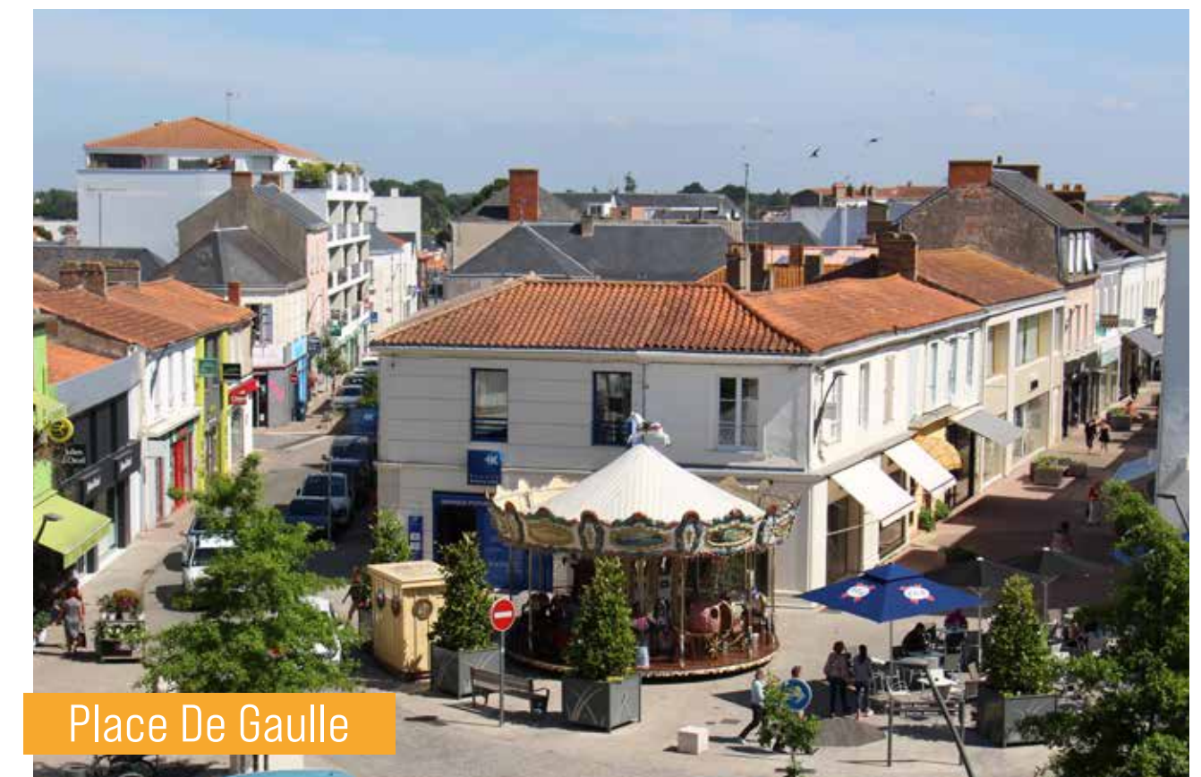
Place De Gaulle