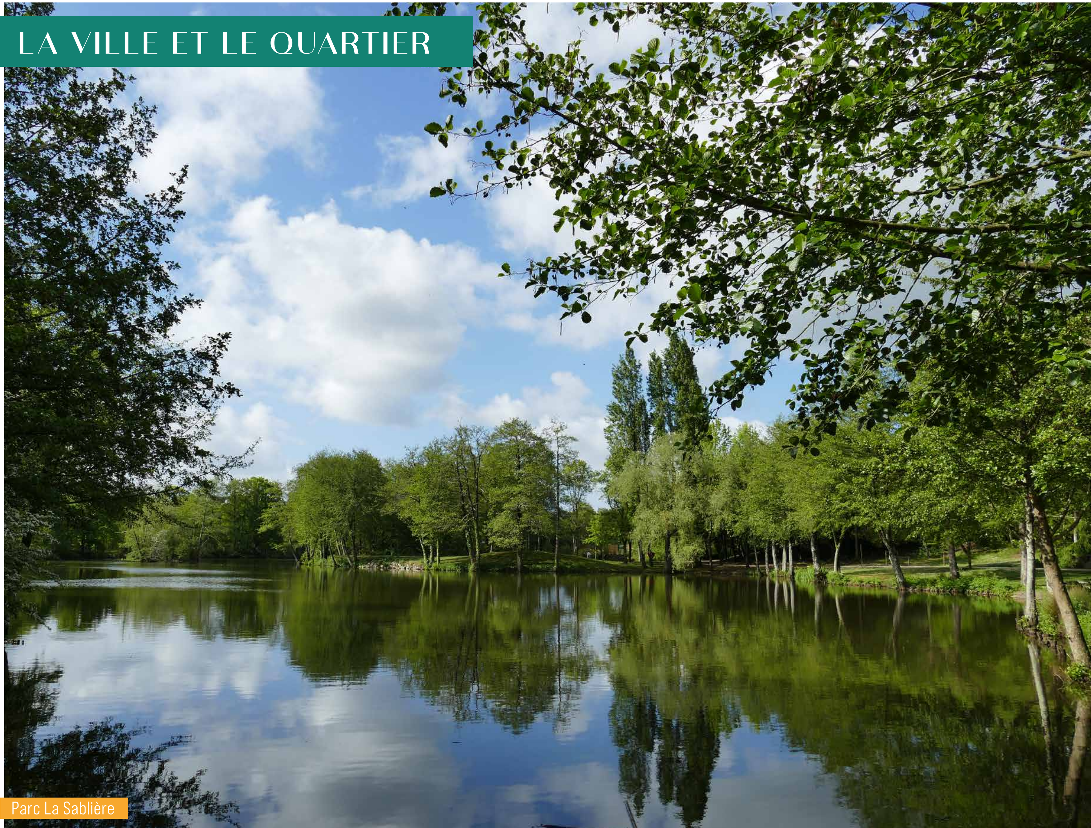
Parc La Sablière