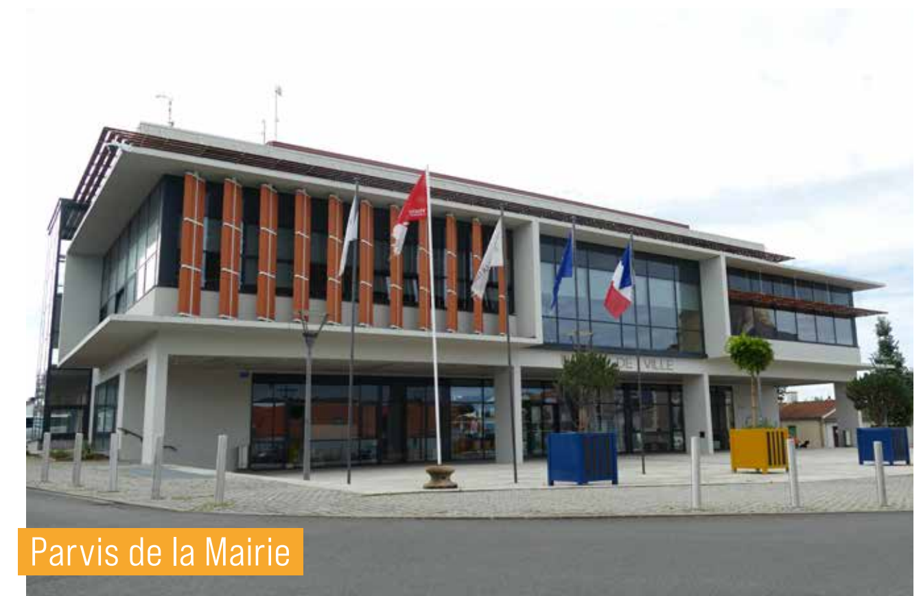
Parvis de la Mairie