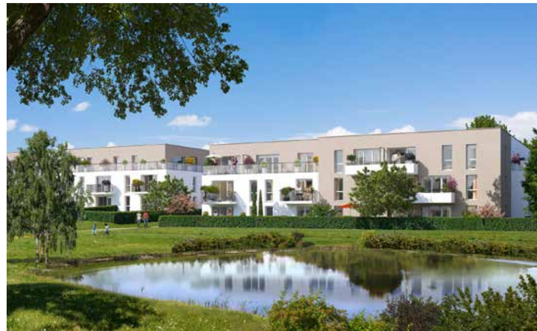
Le Parc de l'Étang - La Roche-sur-Yon Architecte : Agence EG2A