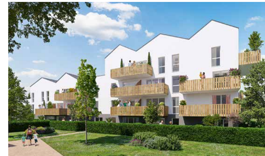
Parc & Plaisance à Blain Architecte : Agence Huca