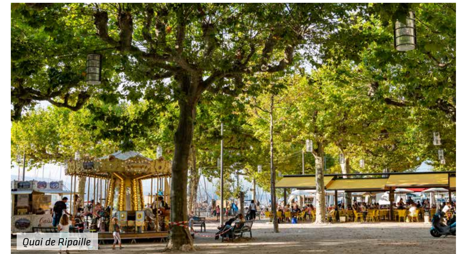
Quai de Ripaille