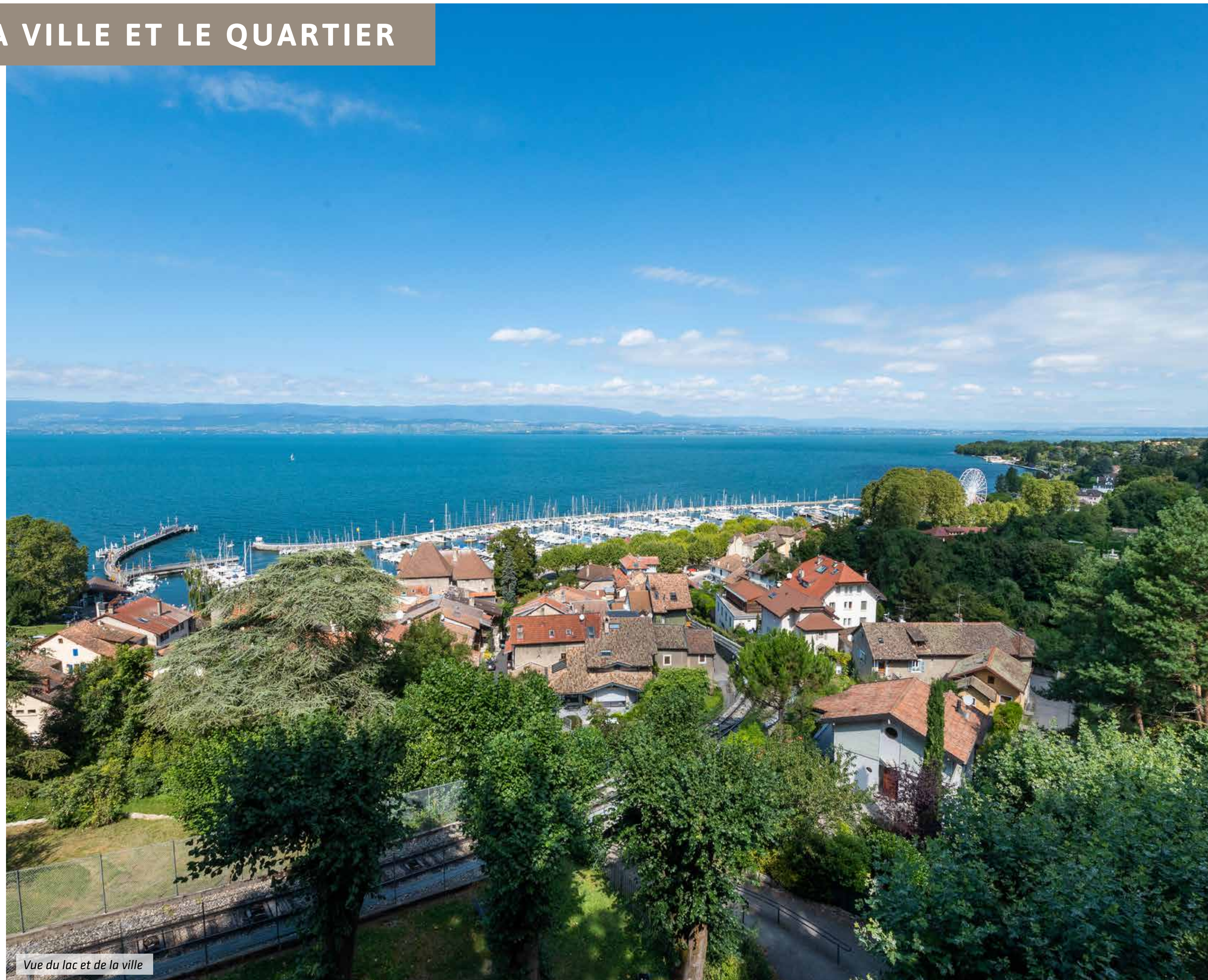
Vue du lac et de la ville