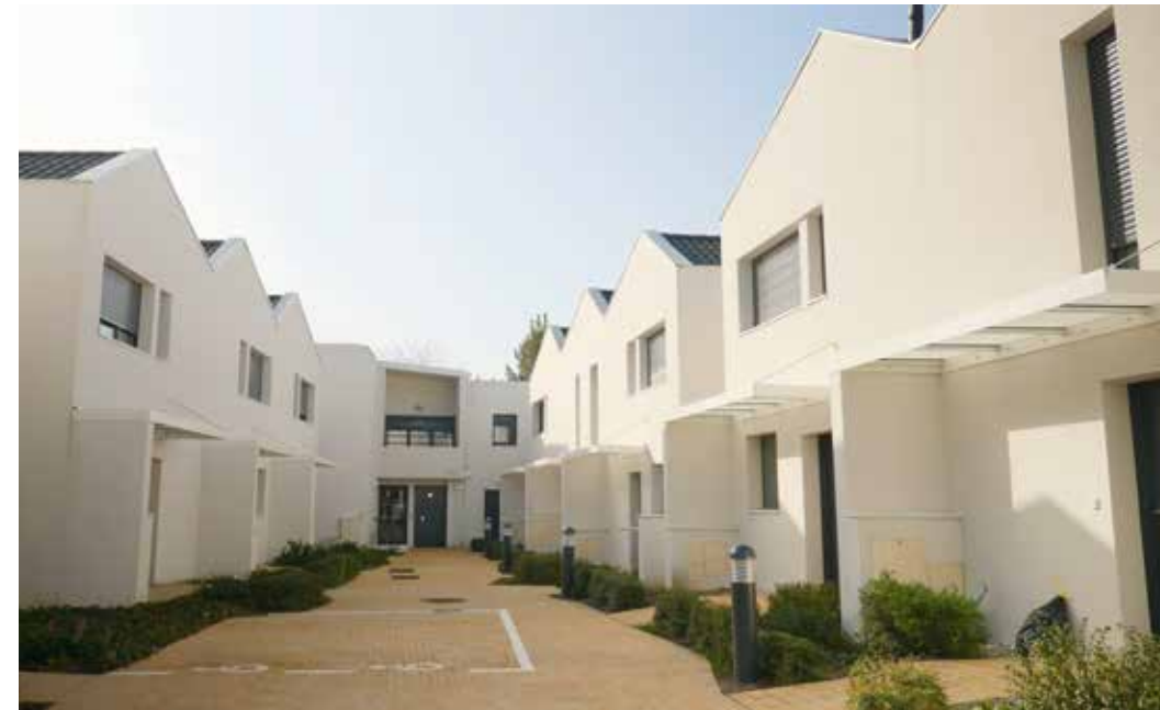
Villa Caudéran - Bordeaux Agence d'architecture : Alonso Sarraute