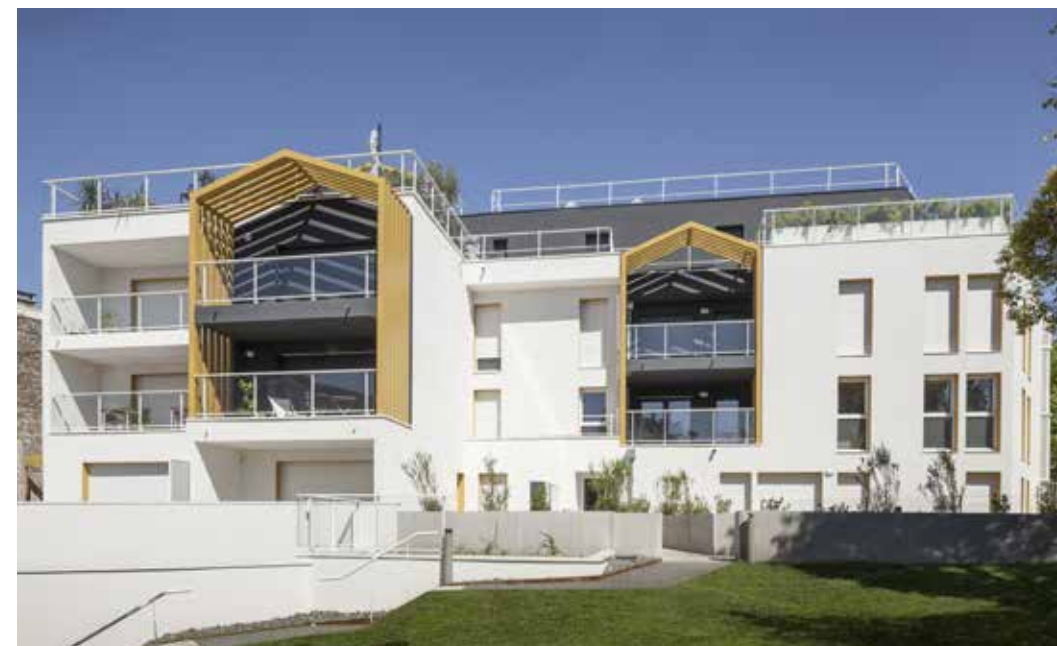
Les Terrasses de Saint-Augustin - Mérignac Agence d'architecture : URB1N