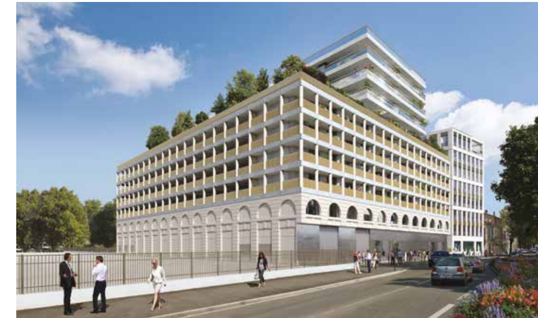
L'Attique de Brienne - Bordeaux Agence d'architecture : COSA Colboc Sachet