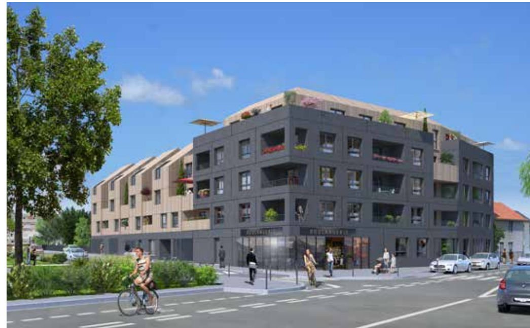
Ginkgo à Nantes Architecte : Agence Huca