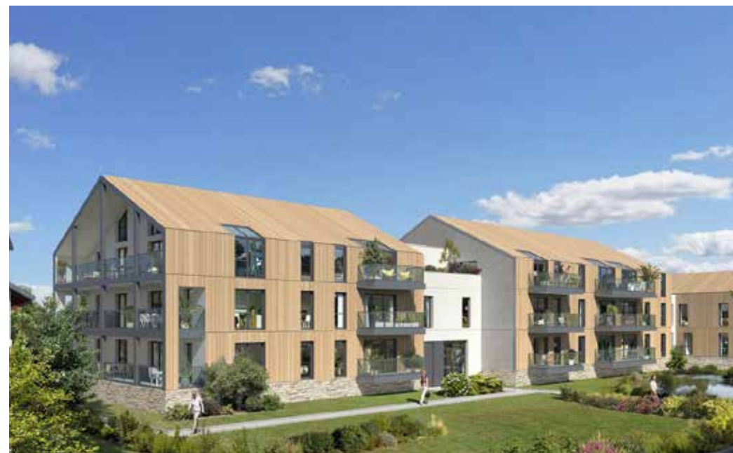
Domaine Saint-Michel à Guérande Architecte : Didier Zozio