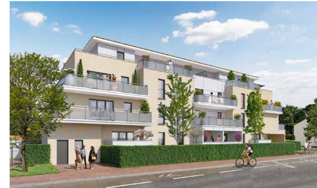
Terrasses des Landes à Basse-Goulaine Architecte : Archi & Partners International