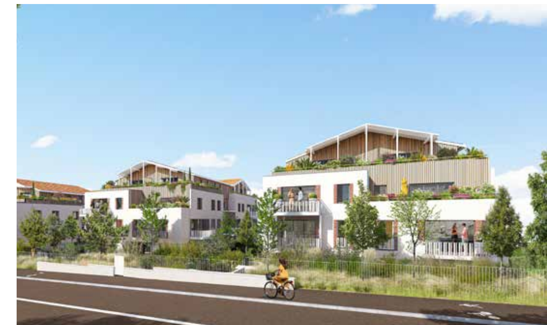
Les Allées de la Ria à Pornic Architecte : Agence ASA Architectes