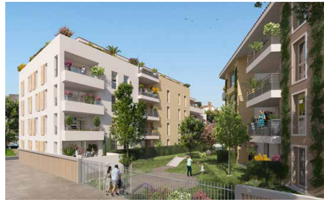
Square République à Givors Architecte : Atelier Architecture Paris & Associés