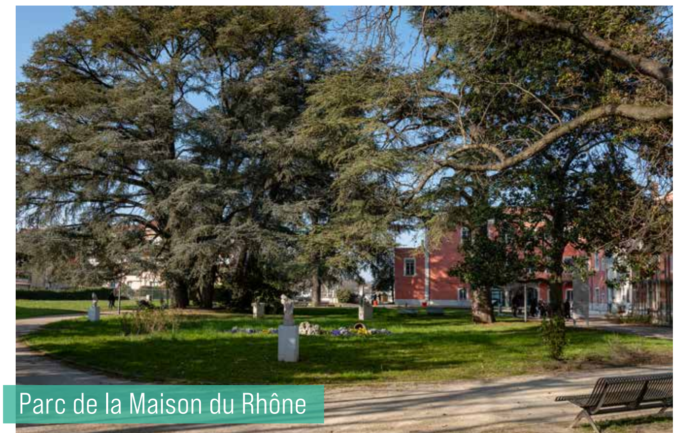
Parc de la Maison du Rhône