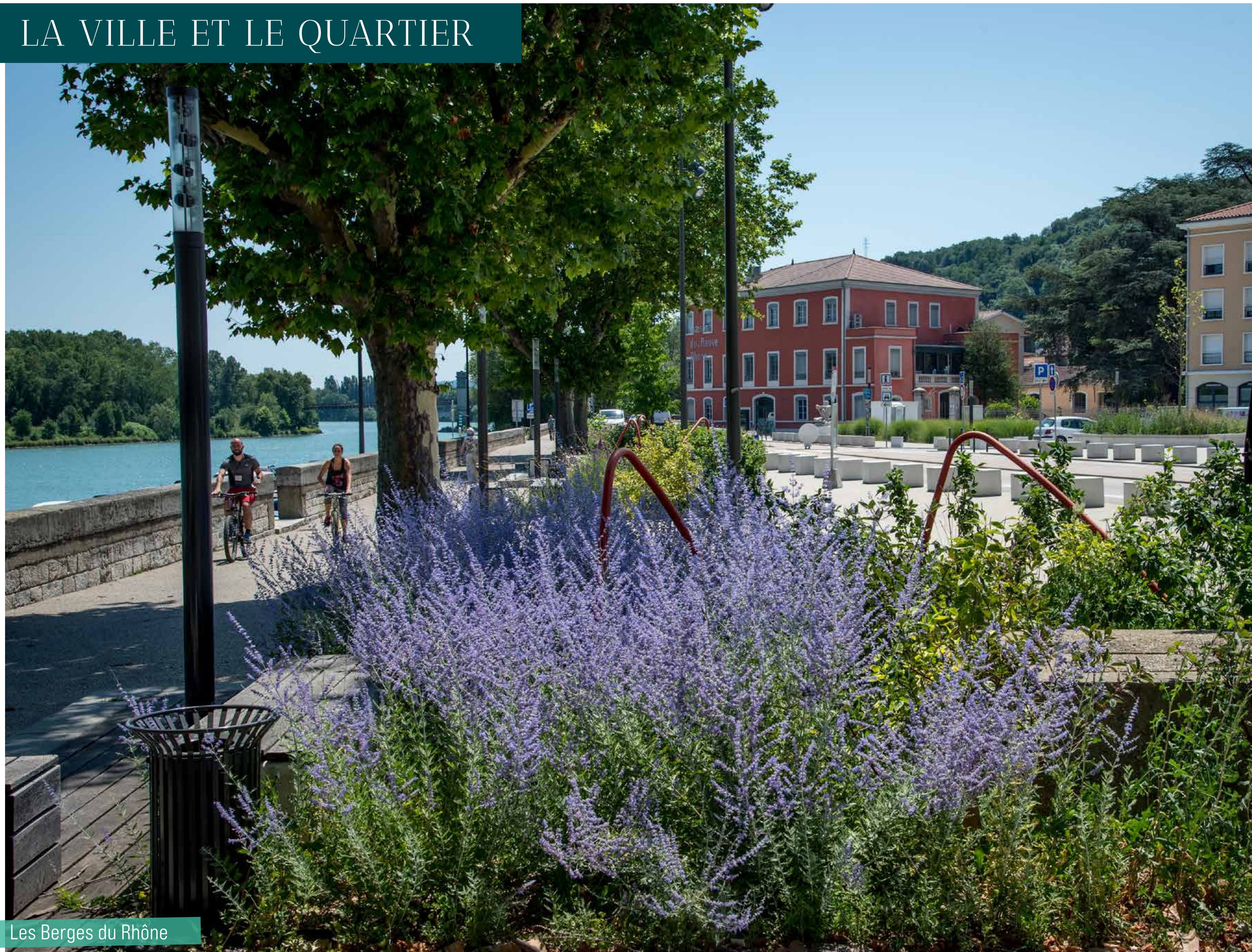
Les Berges du Rhône