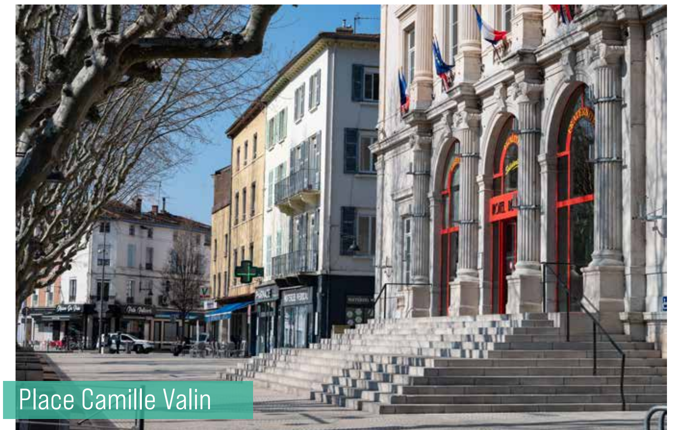
Place Camille Valin