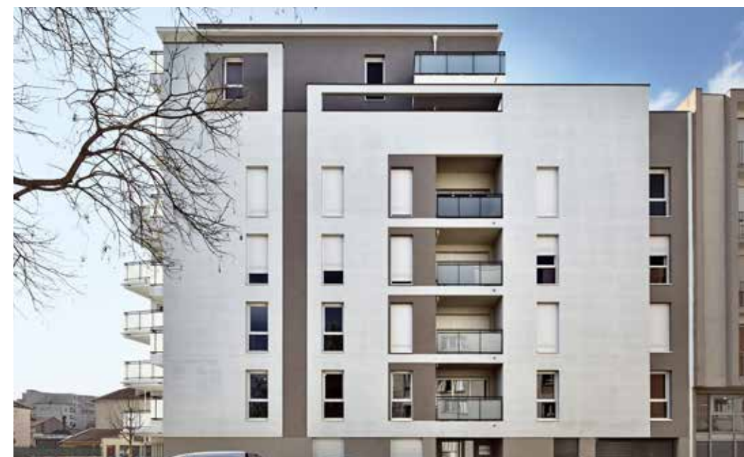
6 avenue Jean-François Raclet à Lyon 7 Architecte : Unanime Architectes