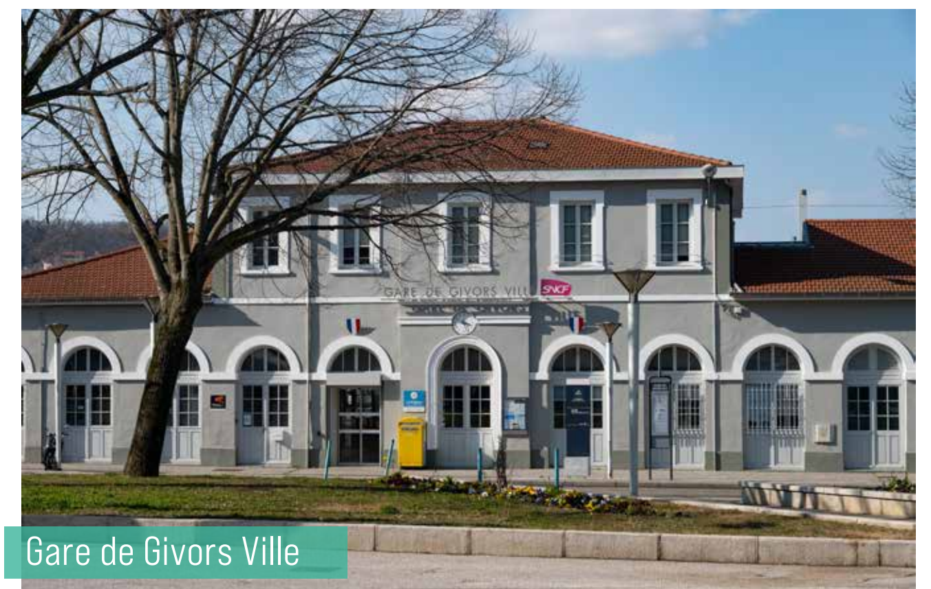
Gare de Givors Ville