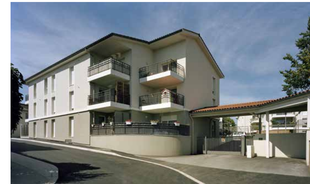
Côté Parc à Vourles Architecte : Maurice Angel