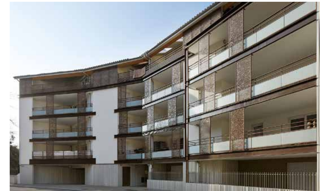
Les Balcons du Centre à Chasse-sur-Rhône Architecte : Atelier William Teissier Architecte