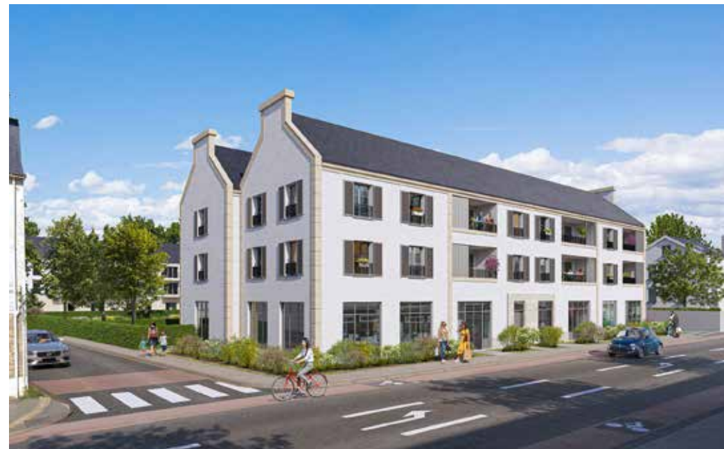
Le Cloc Ty Guen à Auray Architecte : Atelier CAP Architecture