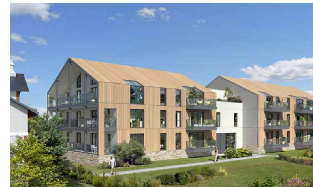
Domaine Saint-Michel à Guérande Architecte : Didier Zozio