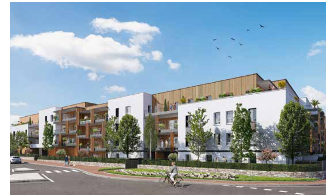
Les Boiseries du Landreau aux Herbiers Architecte : Agence Archidea