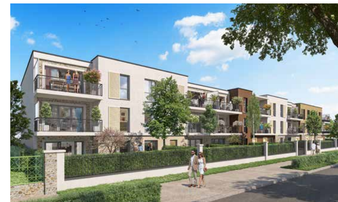
Les Jardins de Courtin à Pomponne Architecte : Cadence Architectes Associés