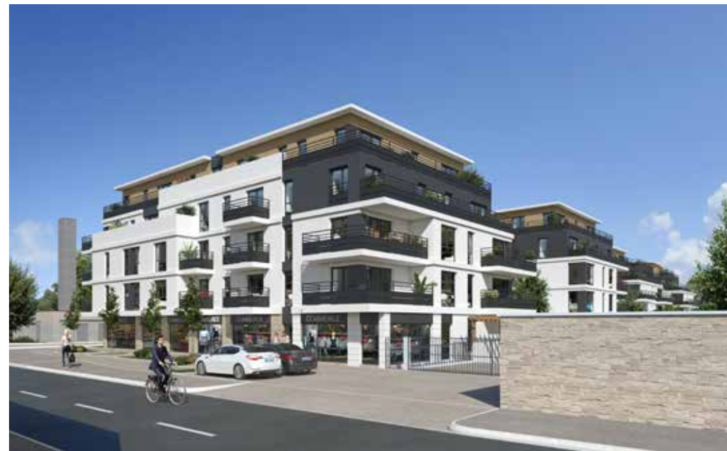
Esprit Canal - Vaires-sur-Marne Architecte : Architectonia