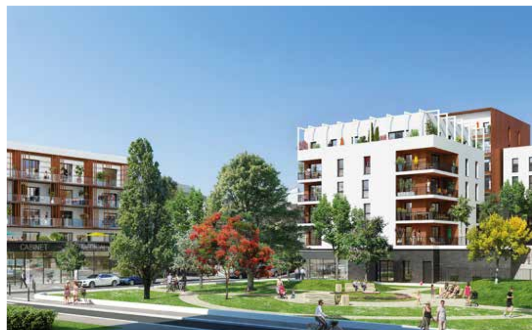
Le Clos de l'Arche - Torcy Architecte : Agence Reichen et Robert & Associés