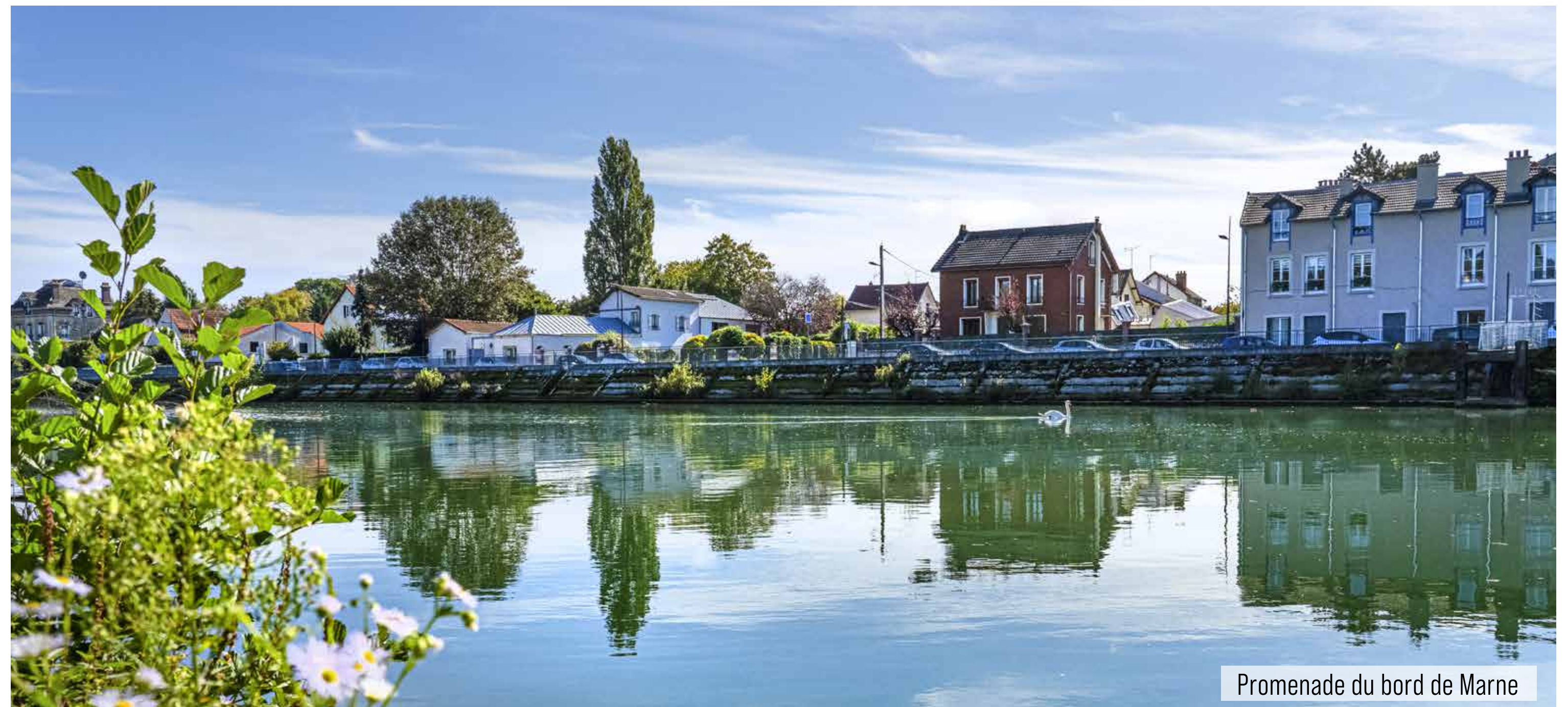
Promenade du bord de Marne