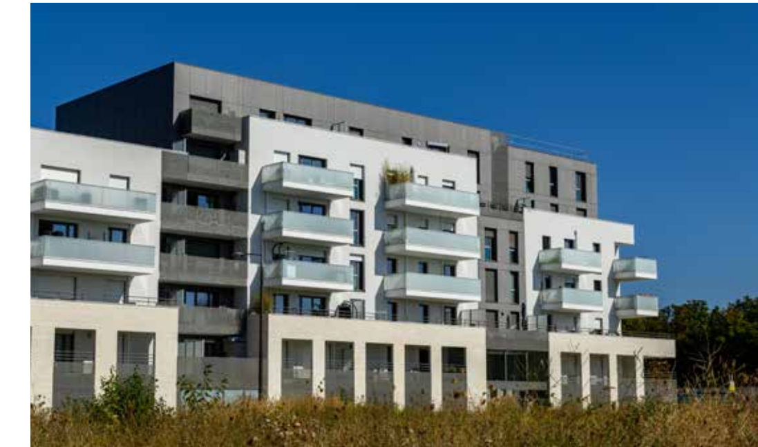
Green Life - Bussy-Saint-Georges Architecte : Architectonia