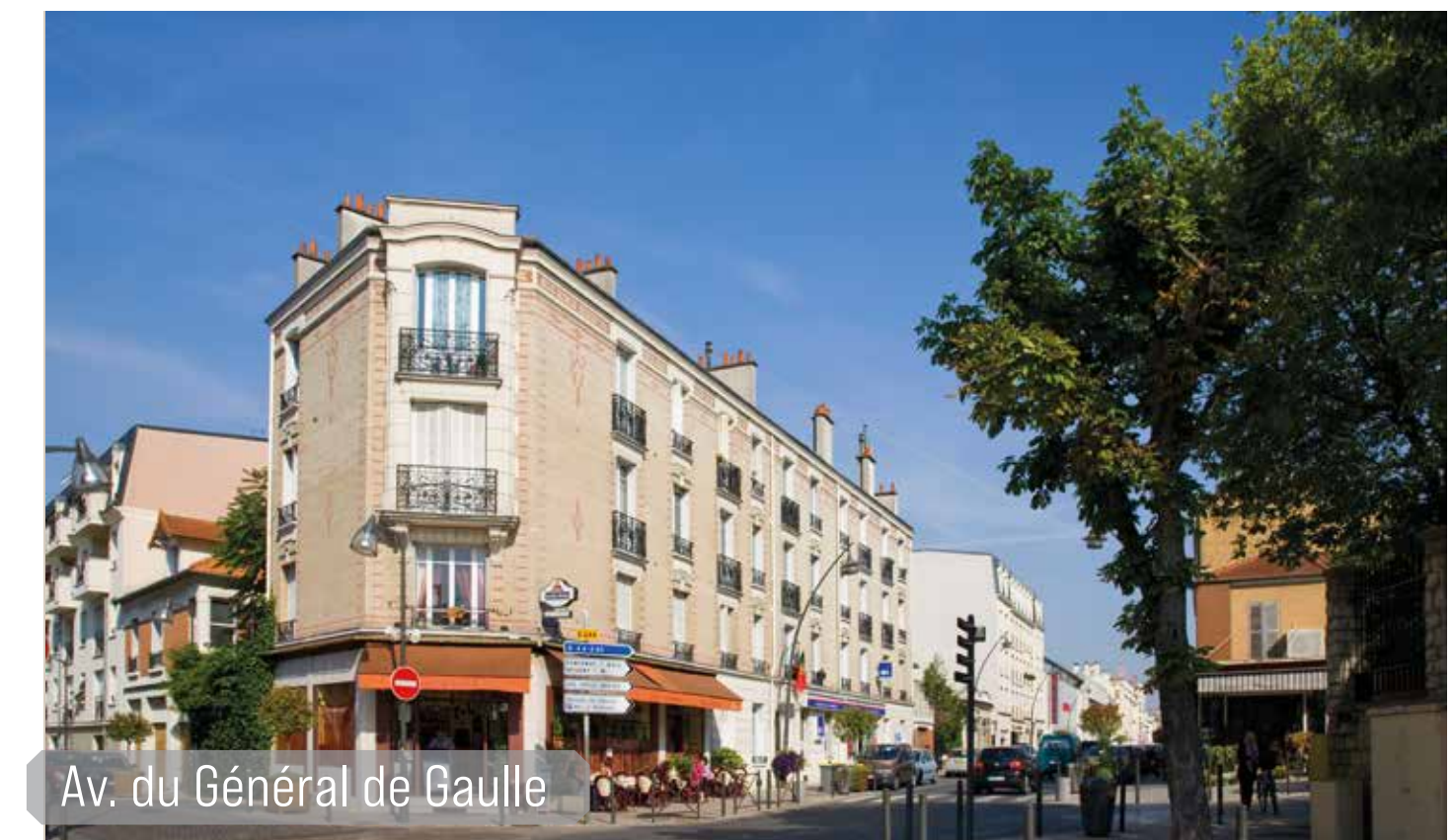
Av. du Général de Gaulle