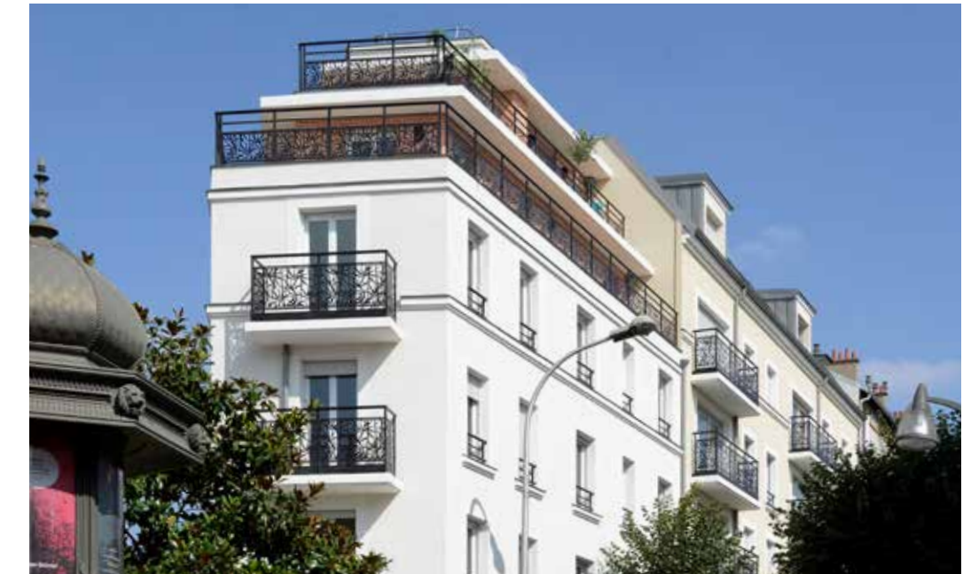
Côté Ville - Le Perreux-sur-Marne Architecte : Lionel de Segonzac