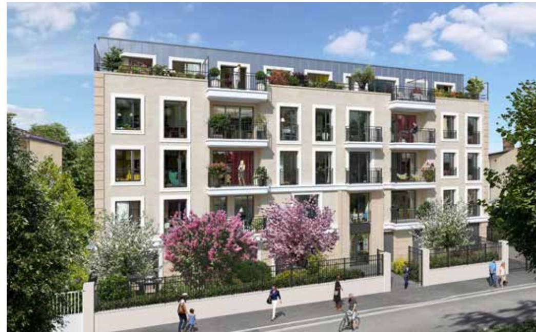
Le Pavillon de la Marne - Le Perreux-sur-Marne Architecte : agence J + L Architectures