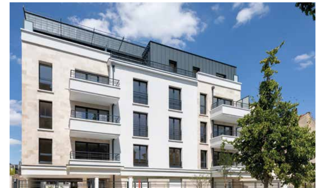
Villa Flora - Fontenay-sous-Bois Architecte : A2D Architecture