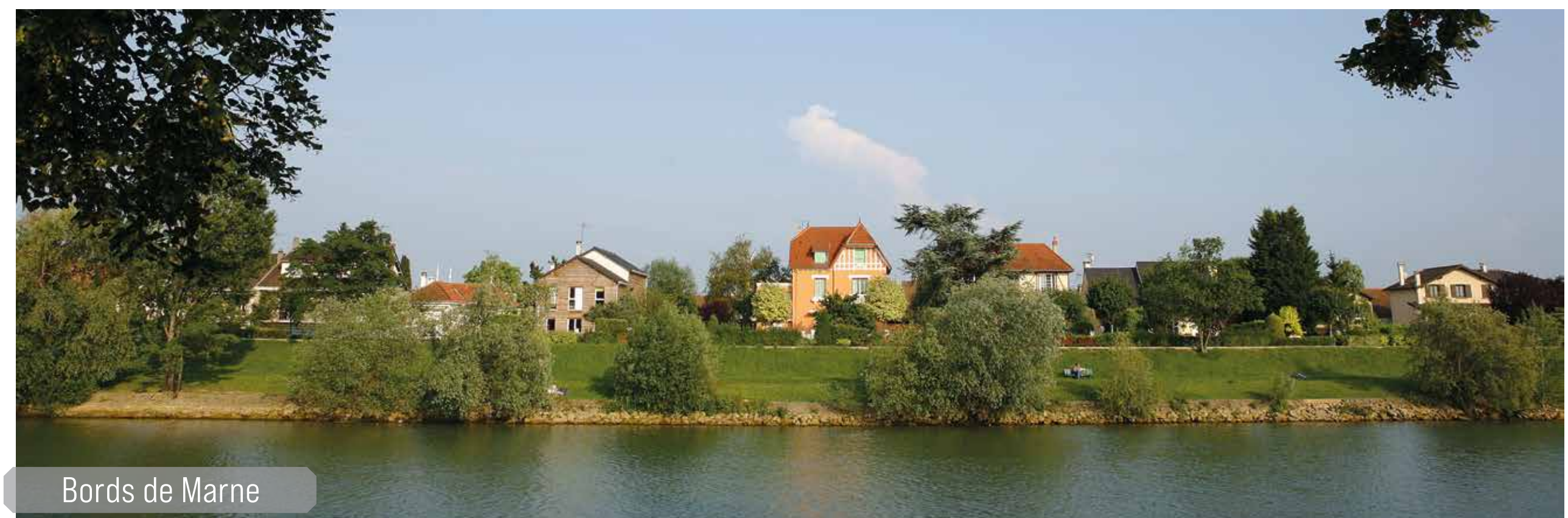
Bords de Marne