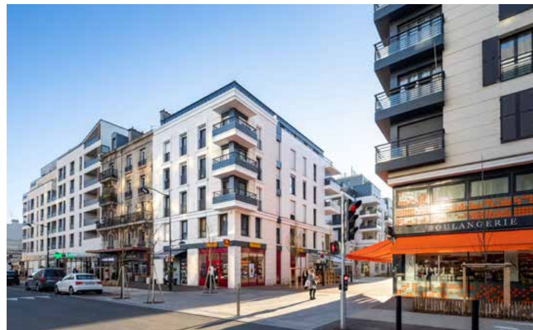
26 rue de Paris - Joinville-le-Pont Architecte : Smaïn Barka