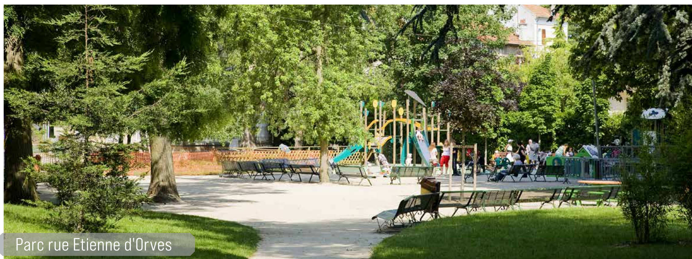
Parc rue Etienne d'Orves