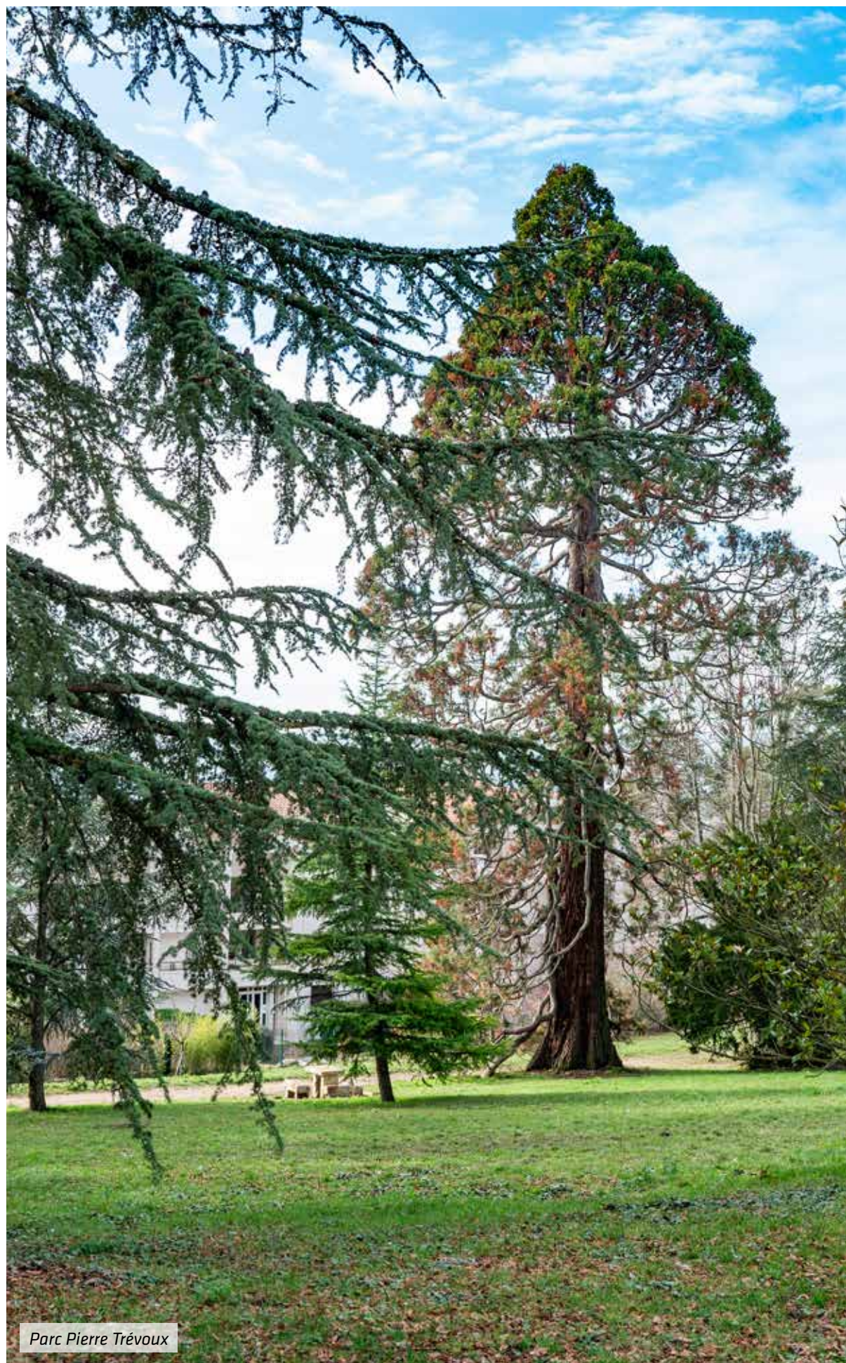
Parc Pierre Trévoux

Au-delà d'un accès rapide sur l'A6 et le boulevard périphérique, Saint-Didier-au-Mont-d'Or tire également avantage de la desserte des bus TCL et de la proximité de la gare de Vaise (gare SNCF et métro D). Les actifs se félicitent aussi de l'accessibilité aisée du centre d'affaires des Monts d'Or. S'y ajoute celle de Techlid, deuxième pôle économique de la métropole, regroupant 71 000 emplois et quelque 16 300 établissements dont les sièges de groupes d'envergure (SEB, Blédina, Materna, LDLC...).