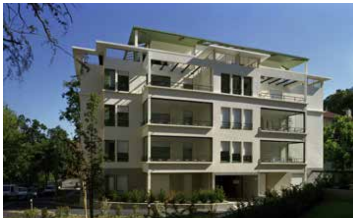
LE PARC DES OMBELLES - LYON 5 ÈME Architecte : Maurice Angel Architecte