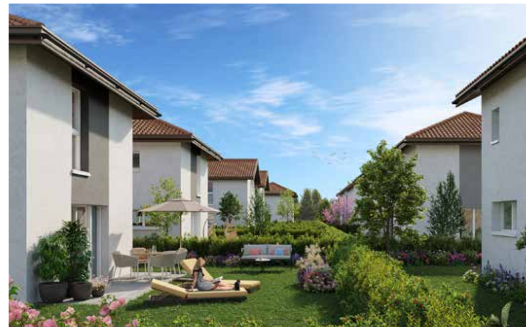
Le Clos des Frêne à Marignier Architectes : Cabinet Ferré