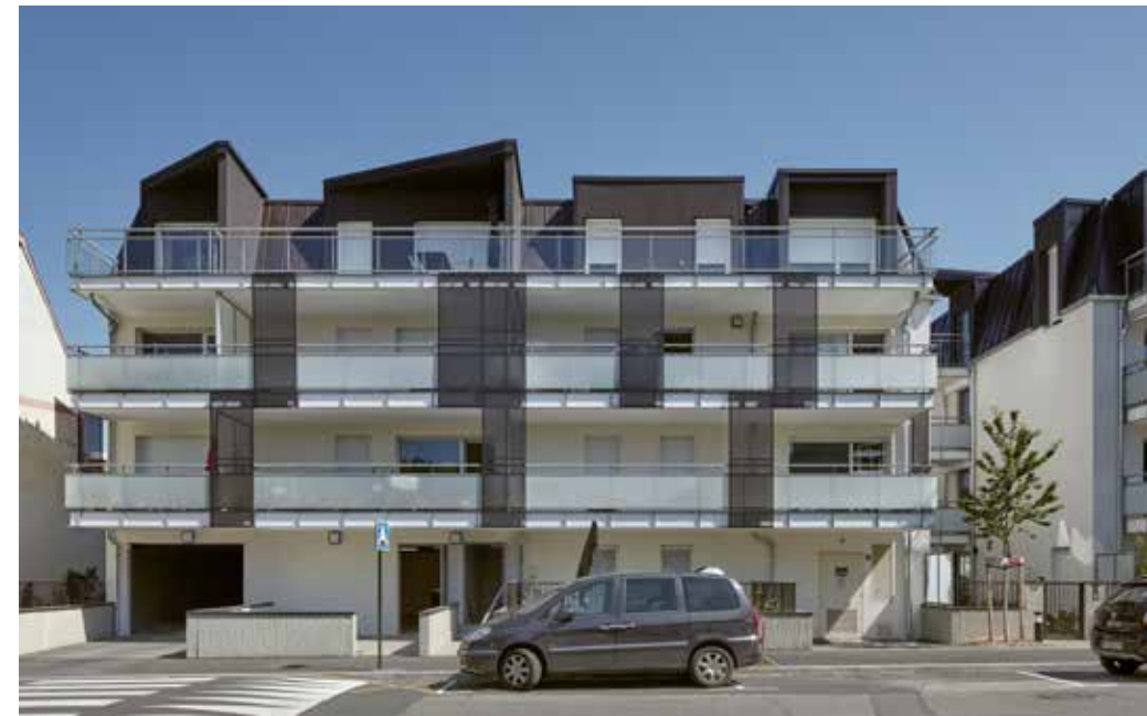
Les jardins du petit port à Aix les bains Architecte : AER Architecture