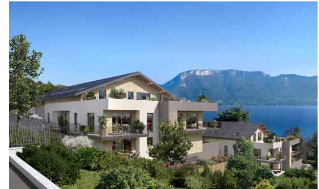
Les terrasses du lac à Sévrier Architecte : David Ferré