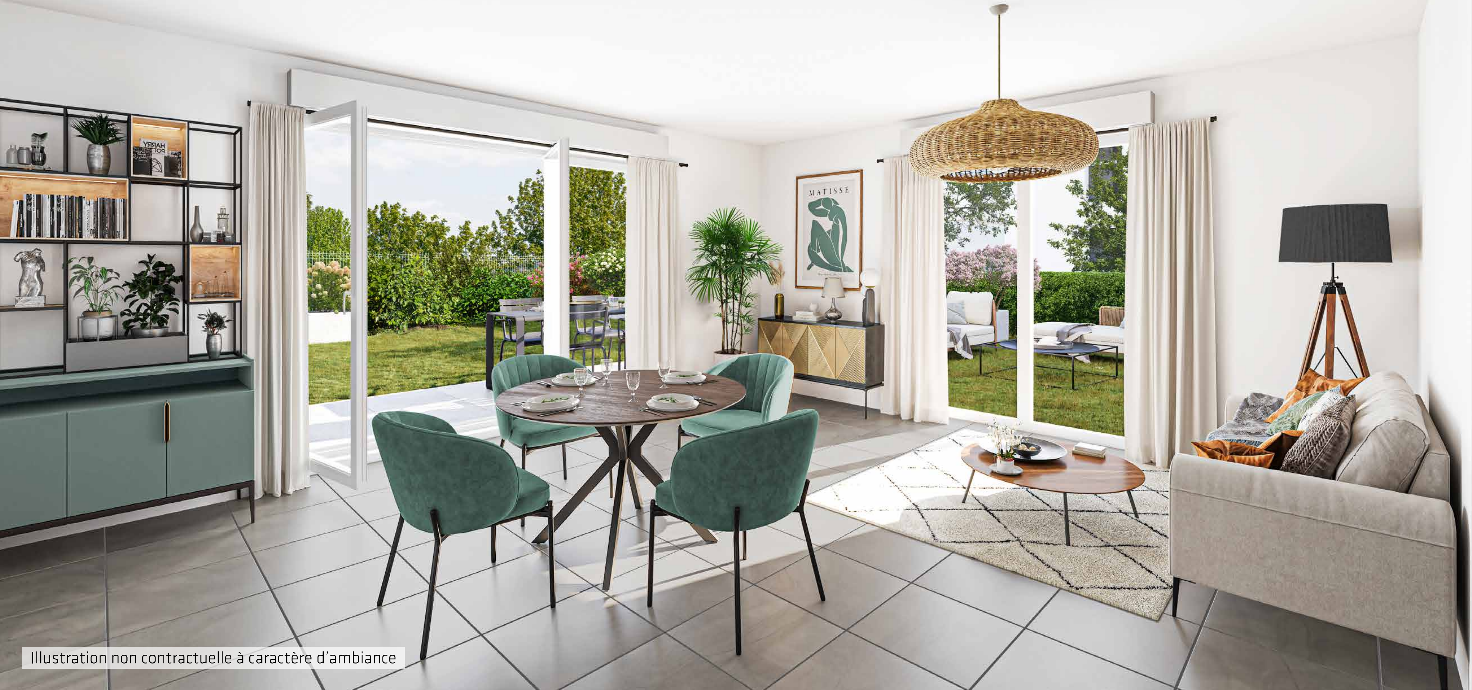
Illustration non contractuelle à caractère d'ambiance