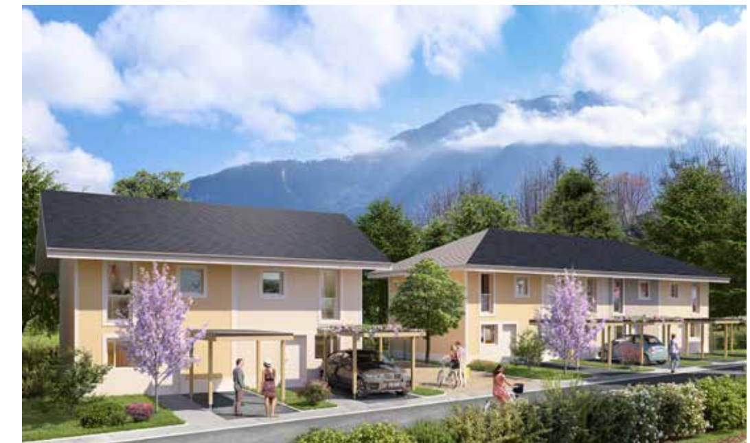
Le Clos de Toisinges à Saint-Pierre-en-Faucigny Architecte : Cabinet d'architecture Floquet Garcia