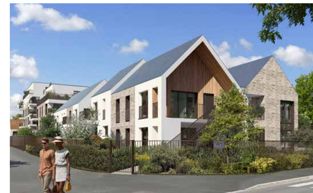
Les Allées de la Chesnaie à Achères Architecte : Agence Elleboode