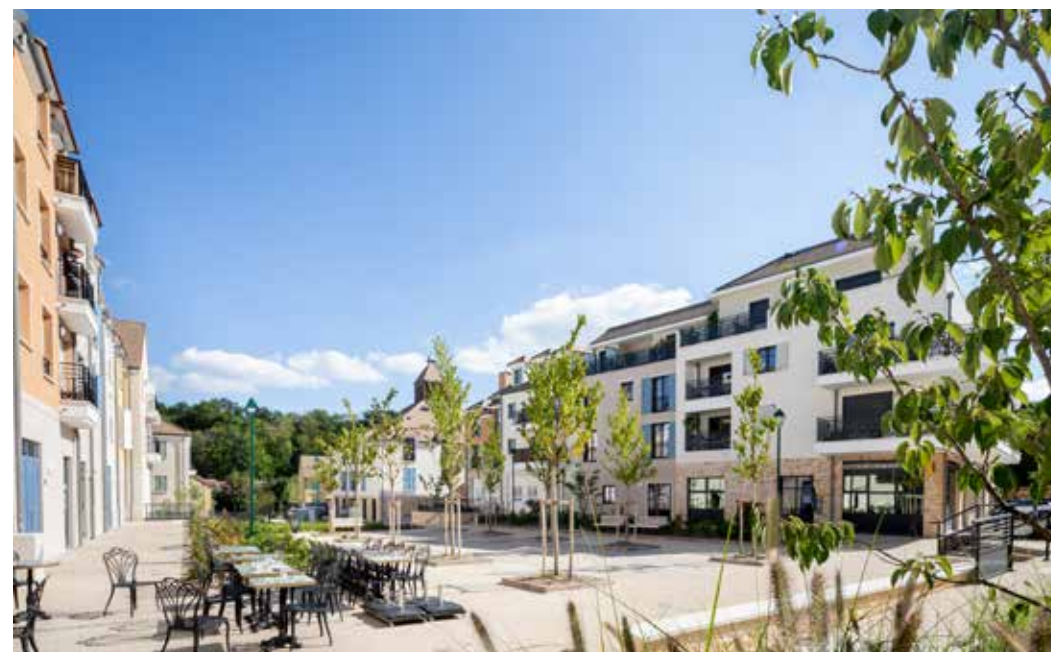
Place du Colombet - Orgeval Architecte : Emmanuel Gutel