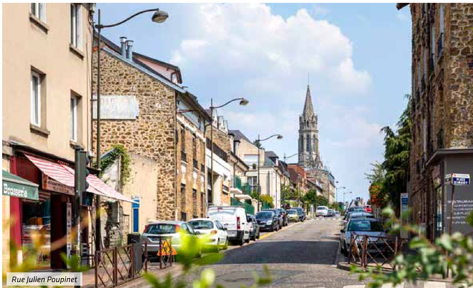
Rue Julien Poupinet