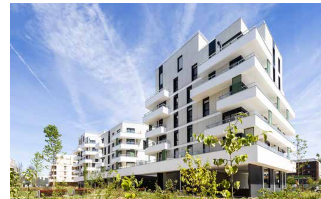
So Green II - Saint-Germain-en-Laye Architecte : Philippe Ma - Arte Charpentier Architectes