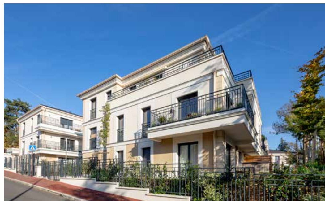
Le Domaine du Roy - Viroflay Architecte : ACP Architecture