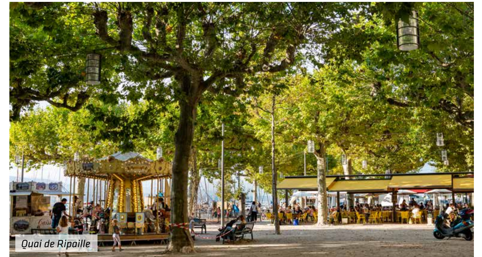
Quai de Ripaille