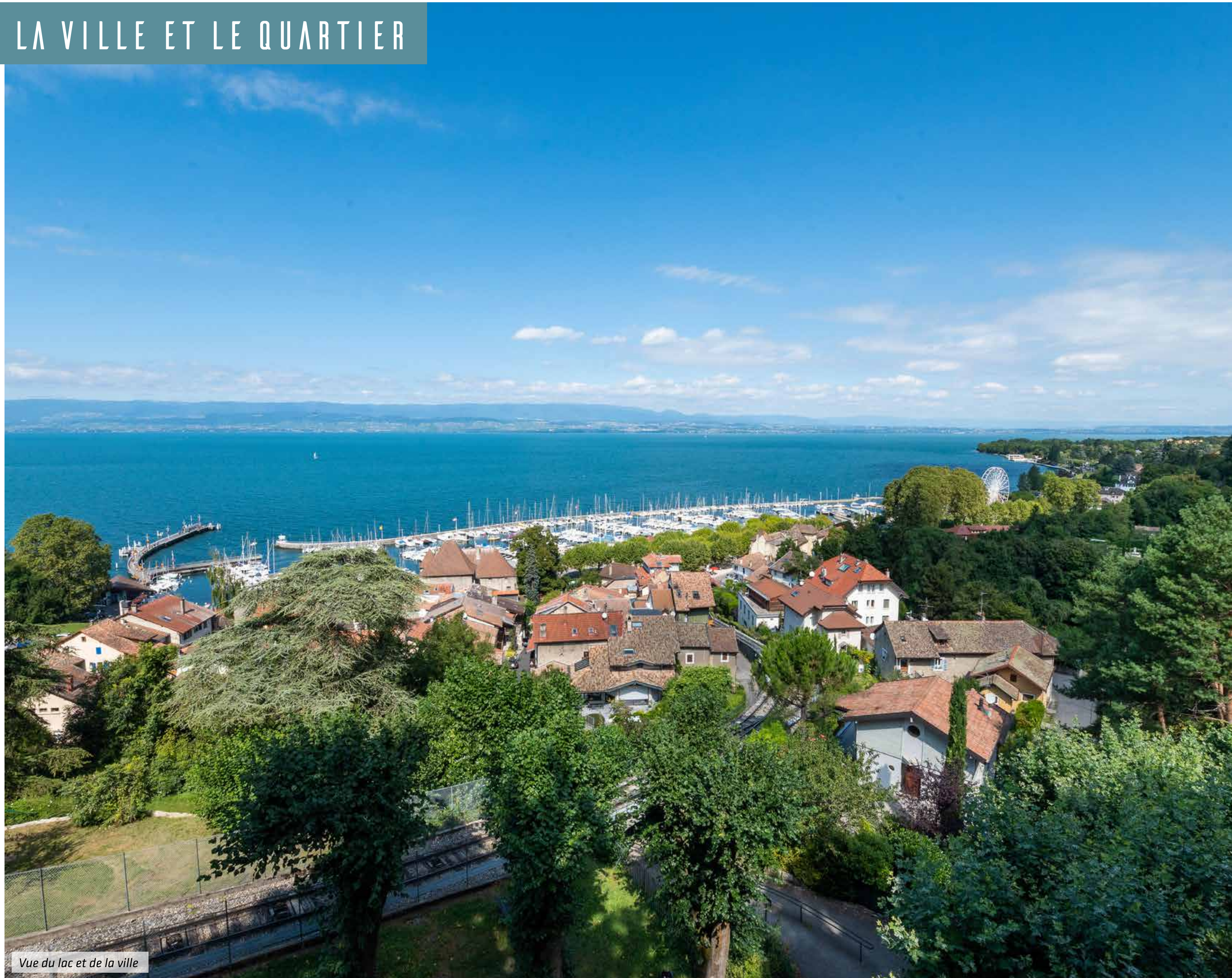
Vue du lac et de la ville