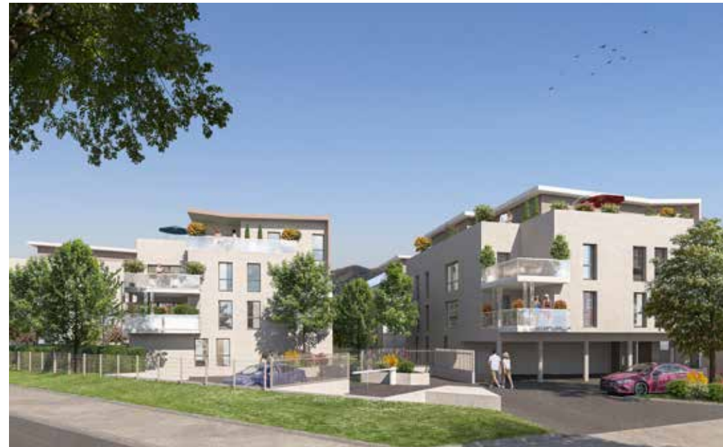
L'Orée du Lac à Sciez Architecte : Agence Oworkshop