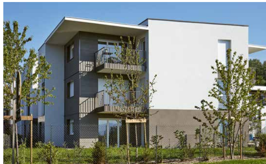
Les Hauts du Lac à Anthy-sur-Léman Architecte : David Ferré