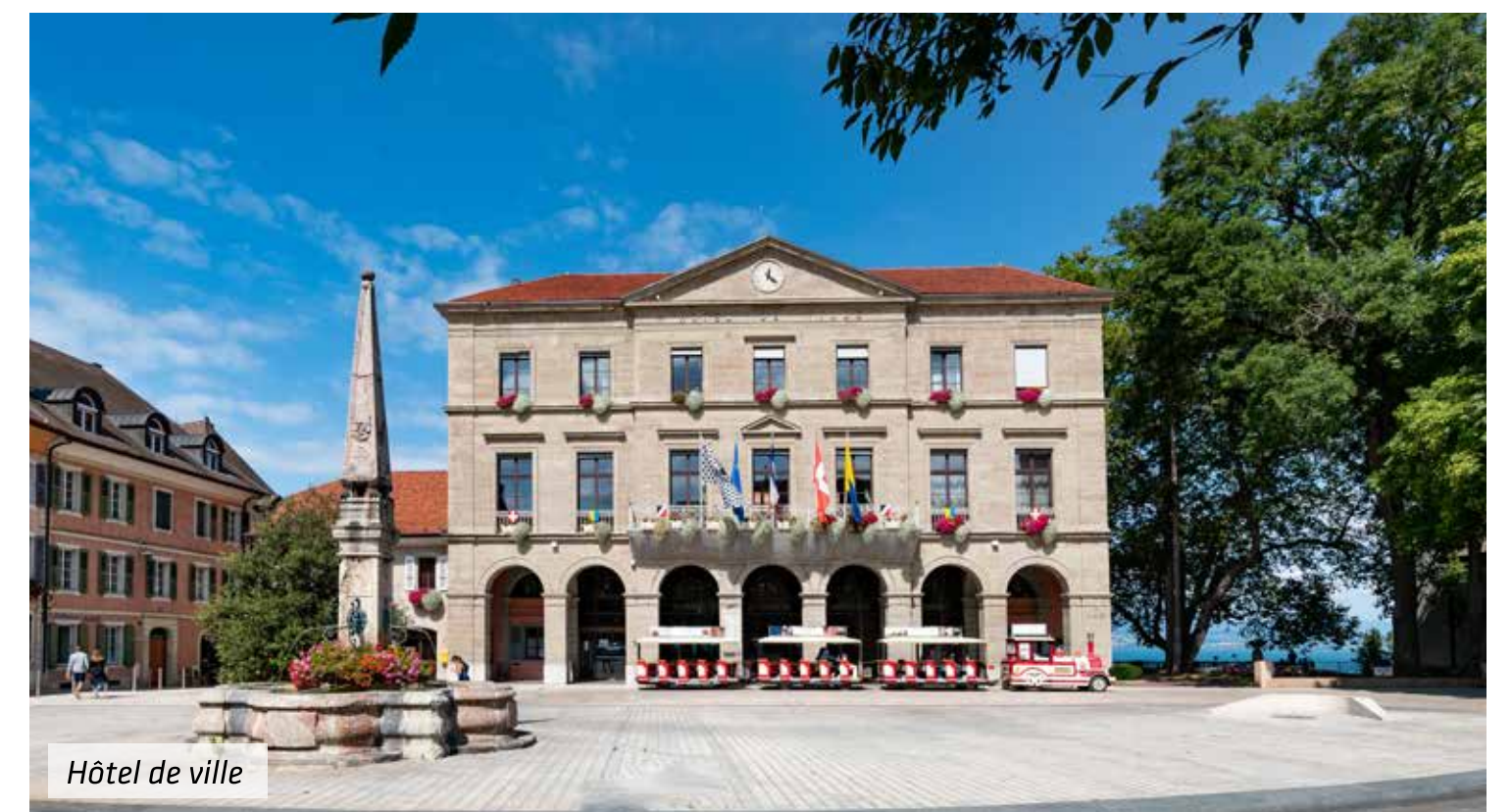
Hôtel de ville