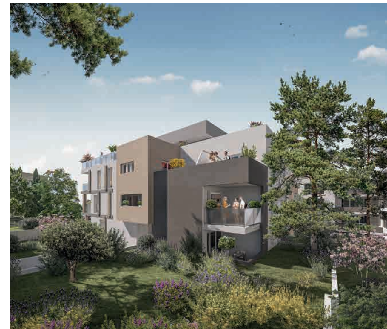
Terralys à Nîmes Architecte : MN-LAB Mary & Nègre Architectes