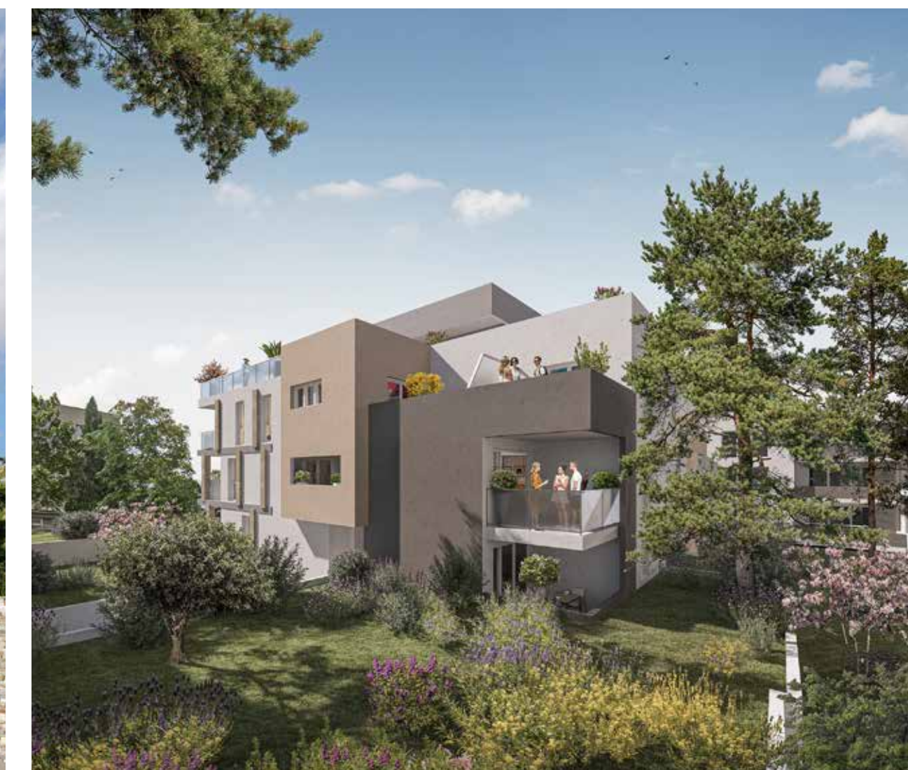
Terralys à Nîmes Architecte : MN-LAB Mary & Nègre Architectes