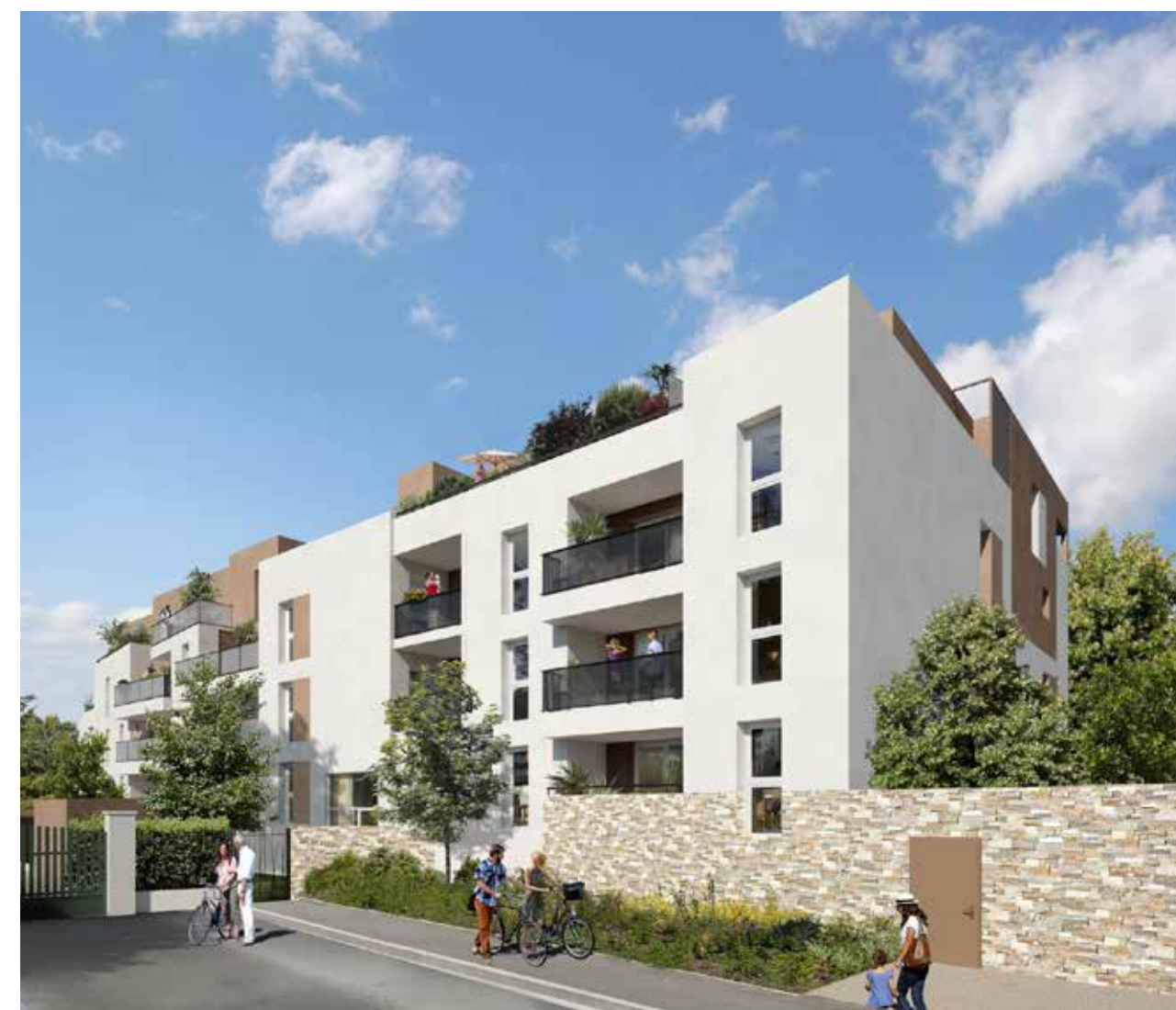
Les Terrasses du Colisée à Nîmes Architecte : Agence Arcotep