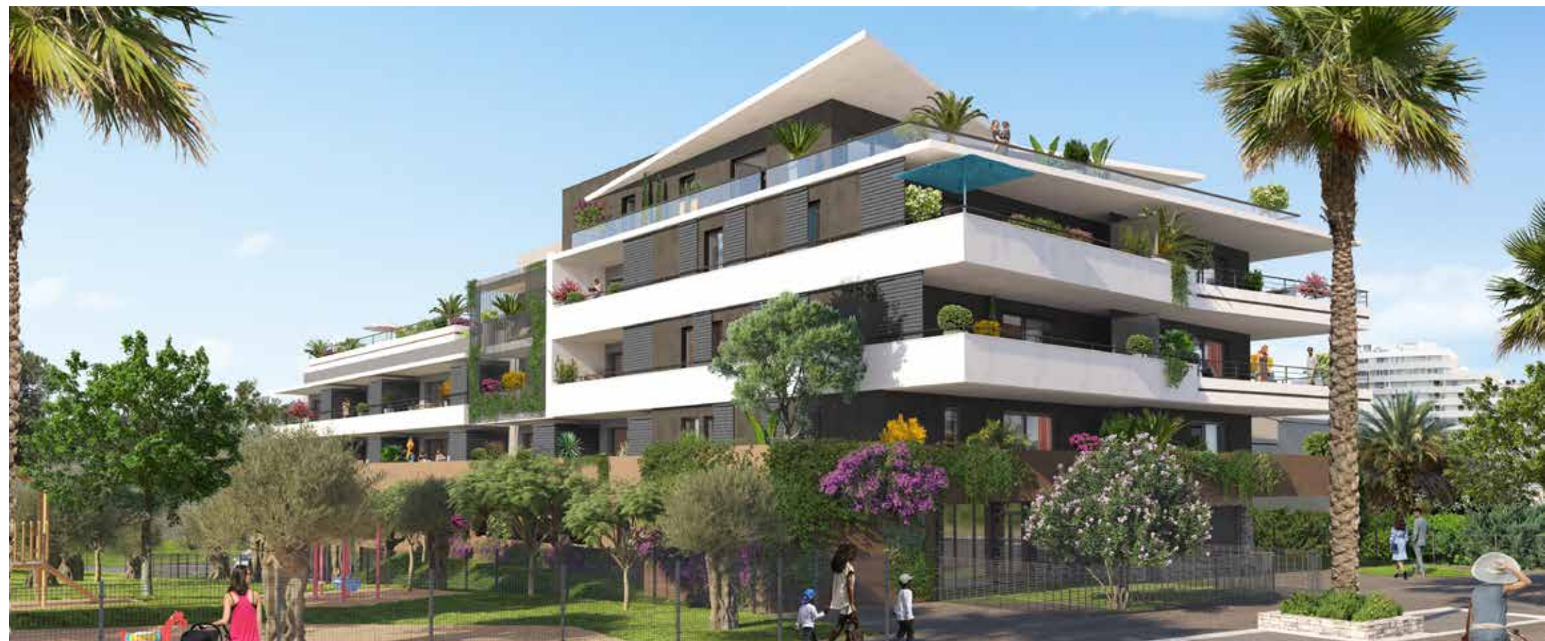
Horizon Marine à Villeneuve-Loubet - Architecte : ABC Architectes Associés