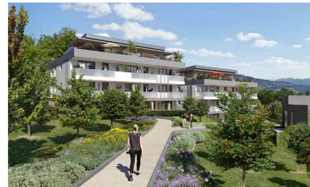
Les Hauts de Rimiez à Nice Architecte : Agence Spagnolo