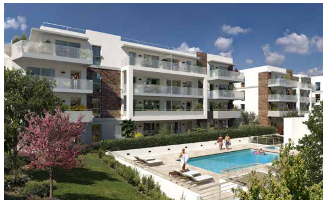
Le Domaine d'Azur à Saint-Laurent-du-Var Architecte : Agence Spagnolo