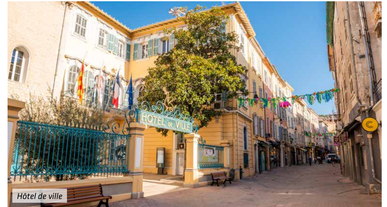
Hôtel de ville