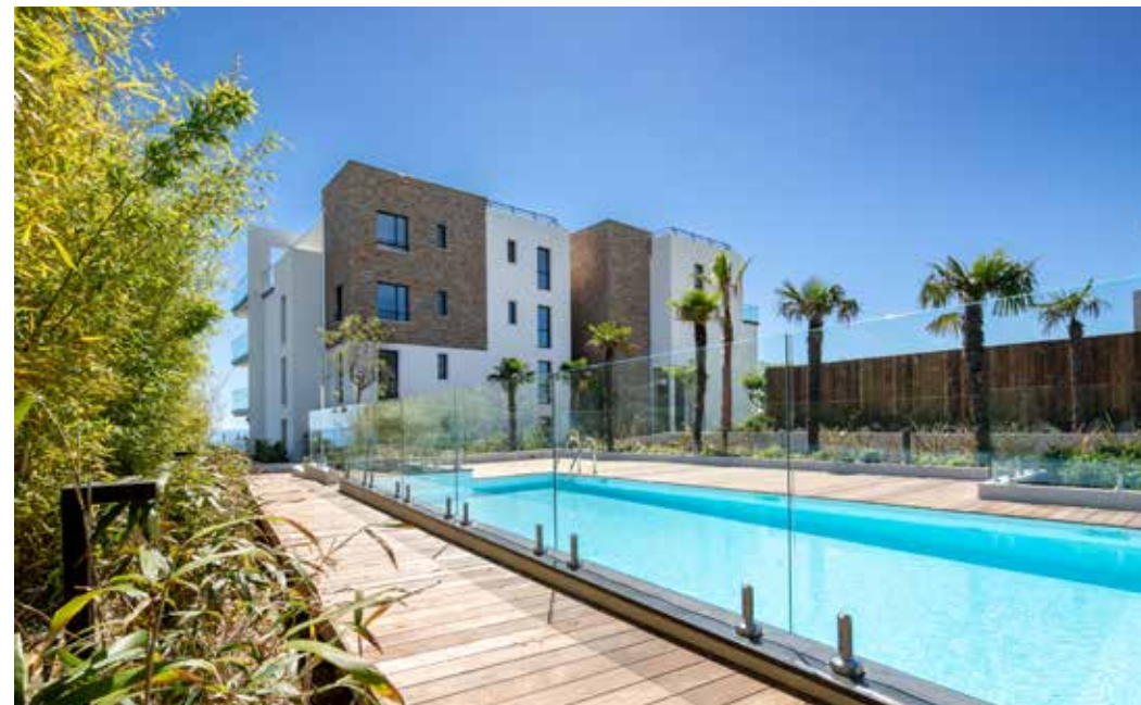
Le Panoramic à Antibes