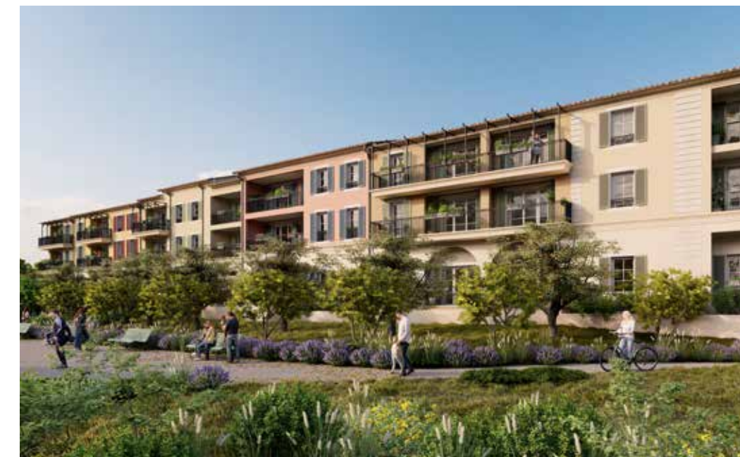
Cœur Village à Roquefort-les-Pins