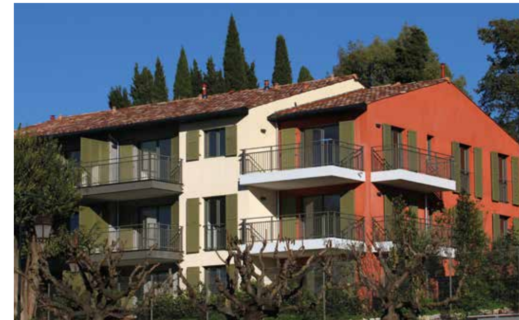
Esprit Village à Valbonne