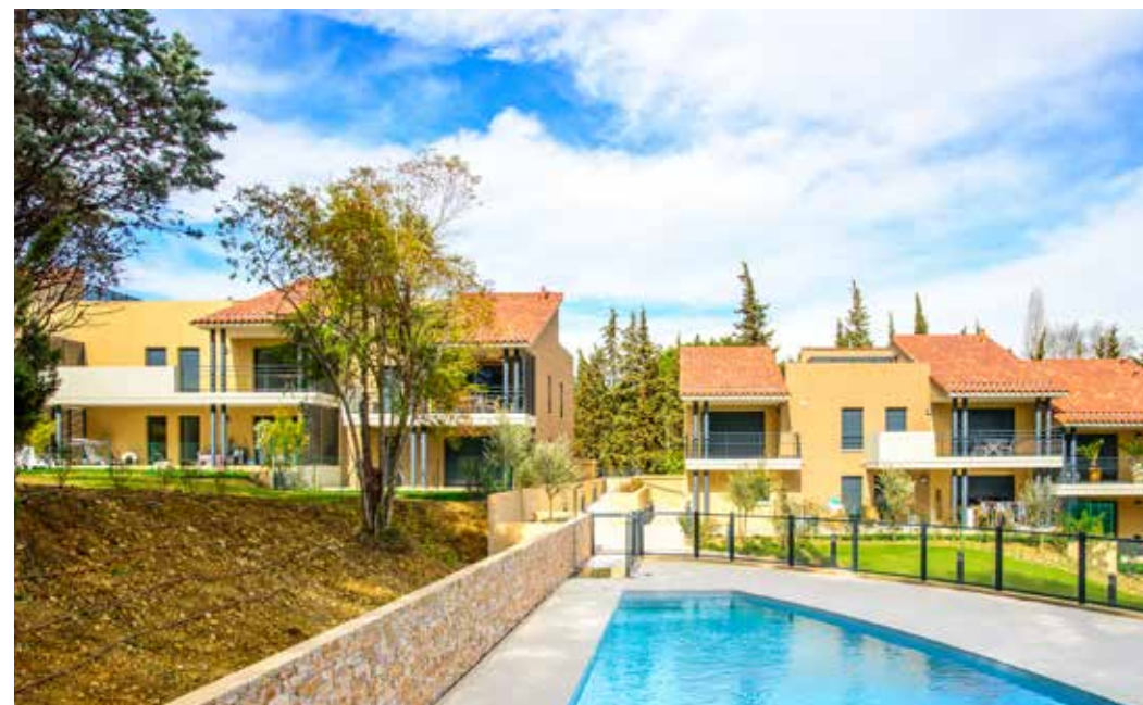
Les Jardins de la Valmasque à Mougins