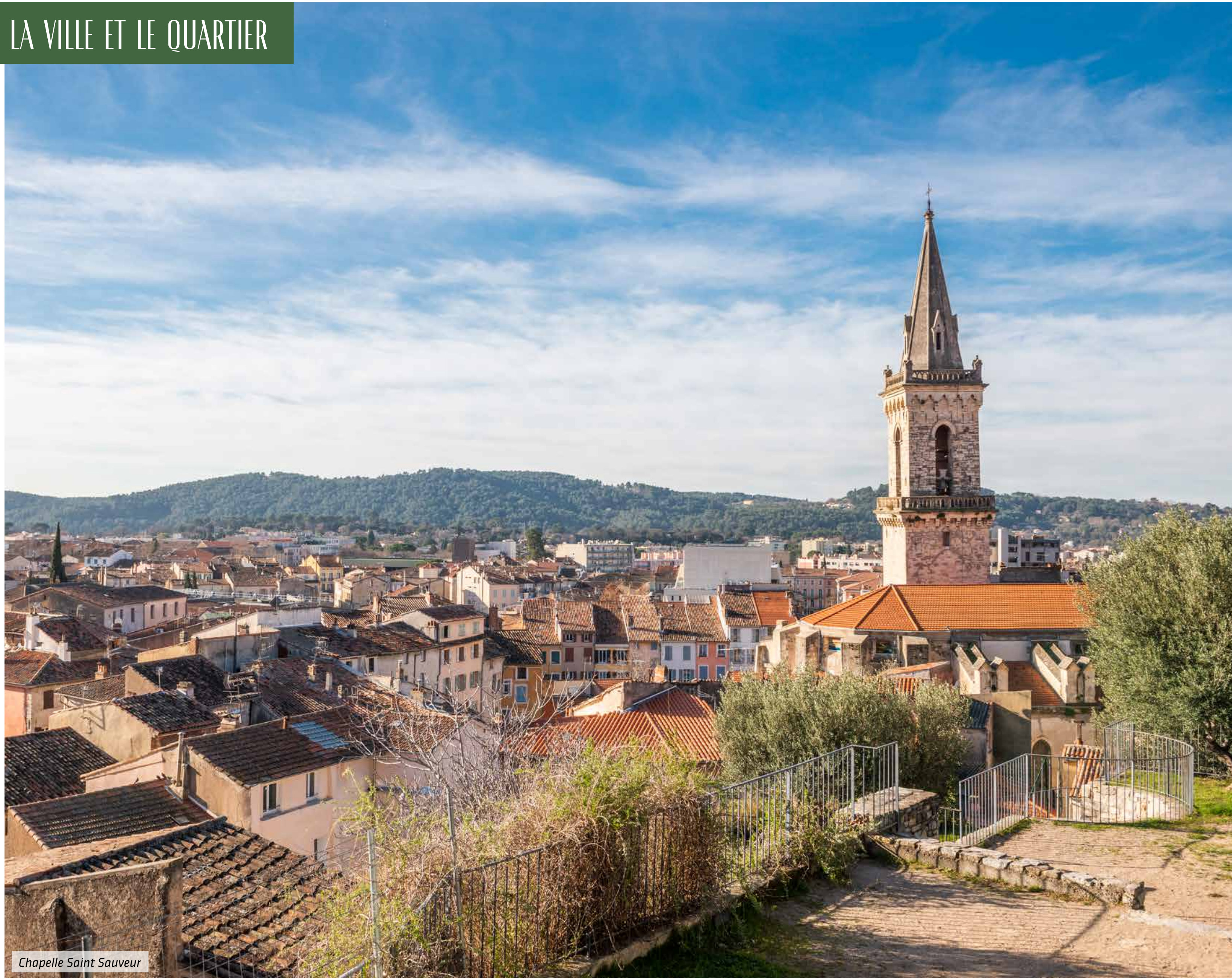
Chapelle Saint Sauveur