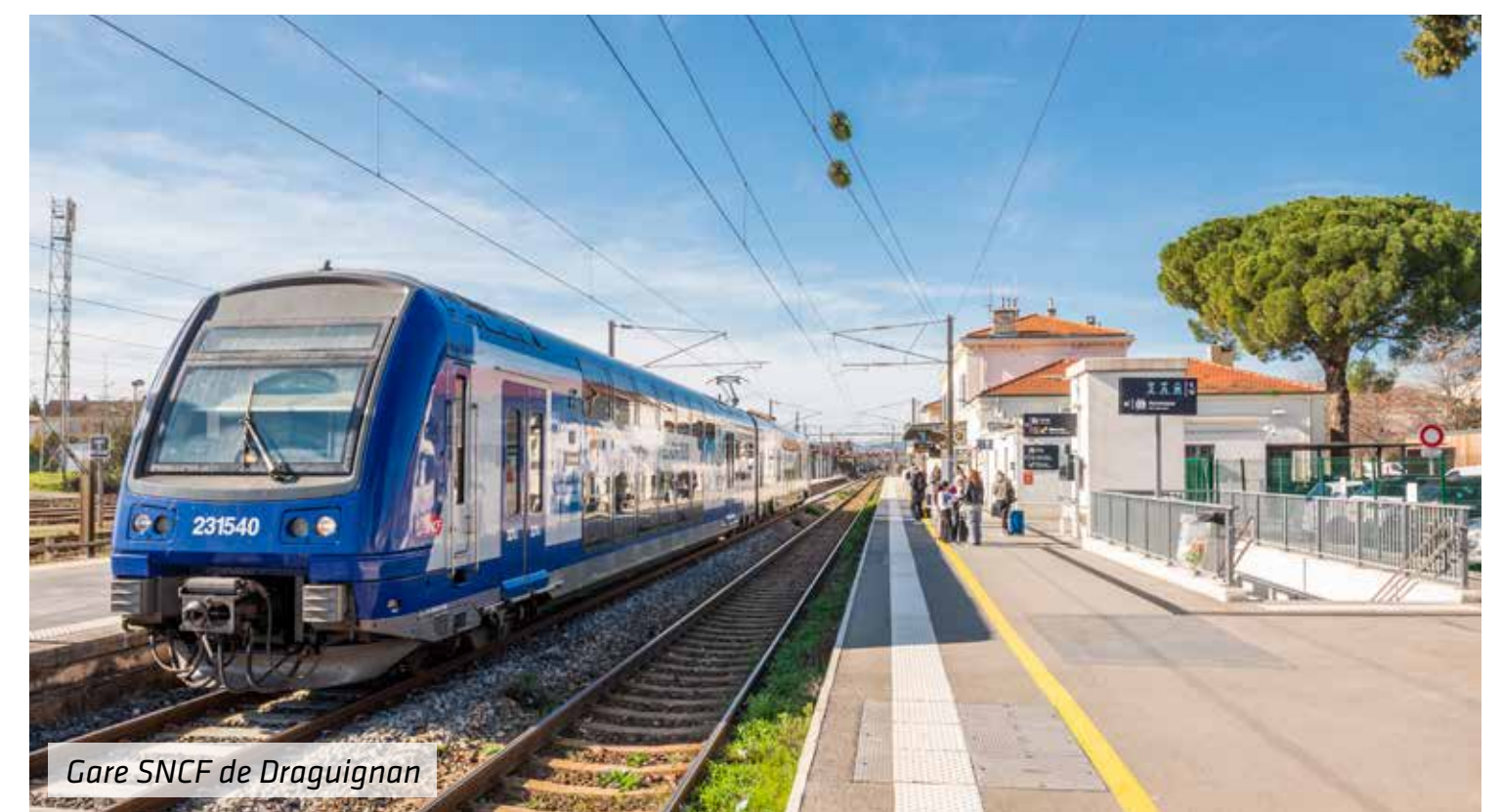
Gare SNCF de Draguignan