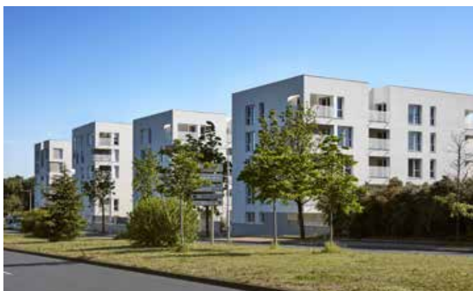
City Garden - Vénissieux Architecte : Cabinet Insolites Architectures