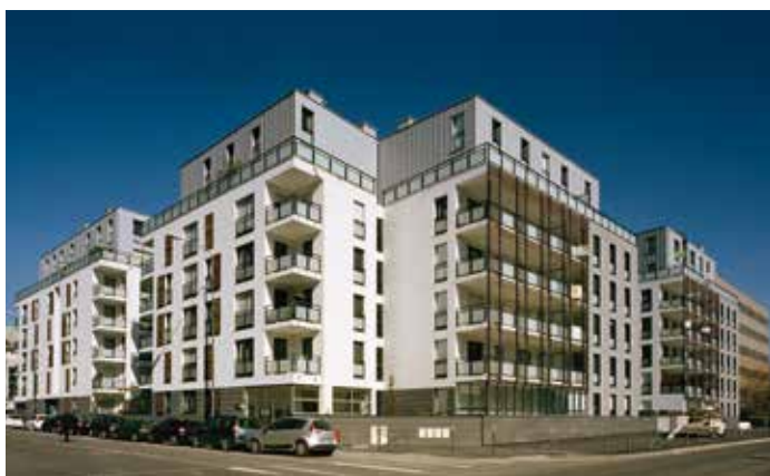
Quai Ouest - Lyon 09 Architecte : Sud Architectes