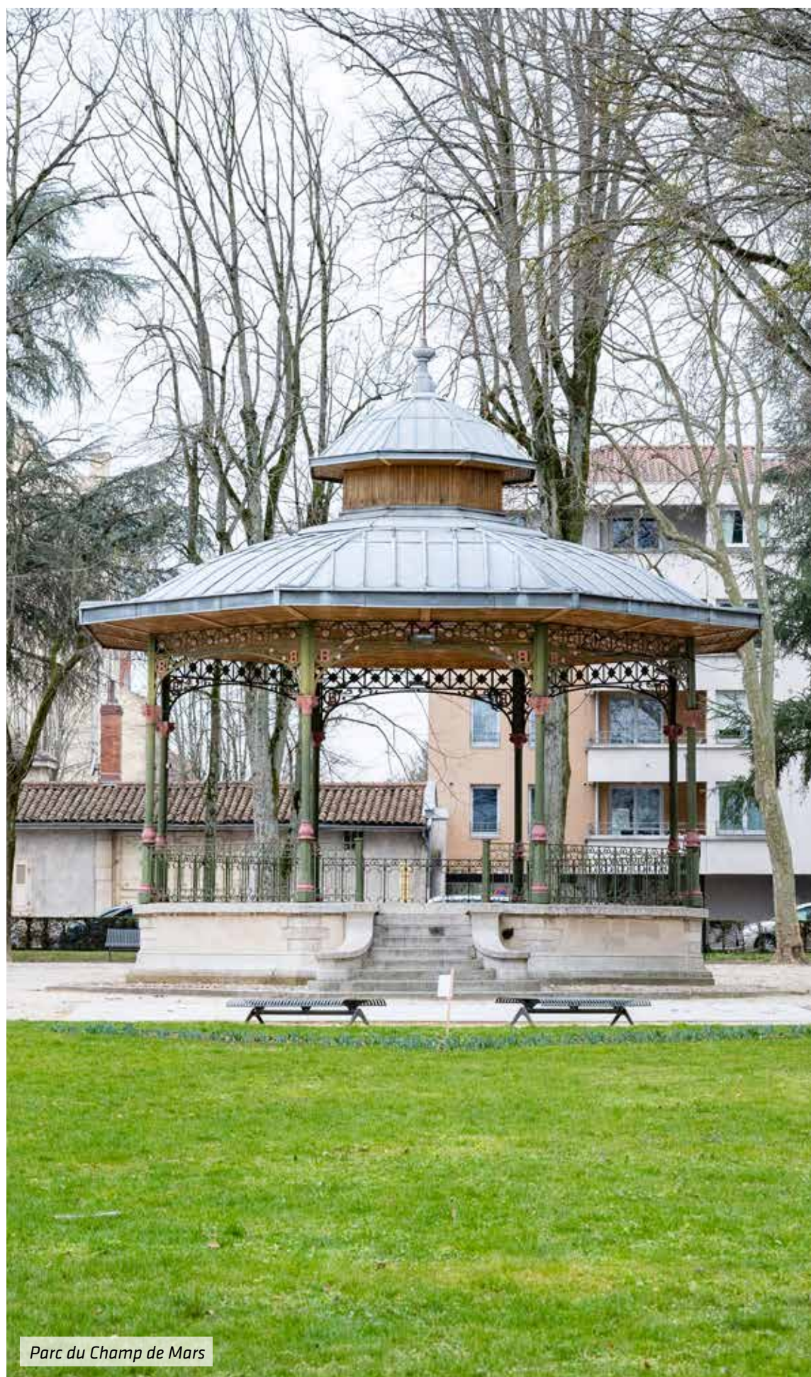
Parc du Champ de Mars