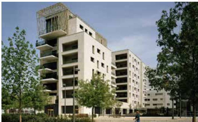
Confluence - Le Denuzière Architecte : Cabinet AFAA