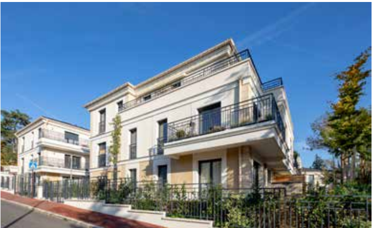
Le Domaine du Roy à Viroflay Architecte : ACP Architecture