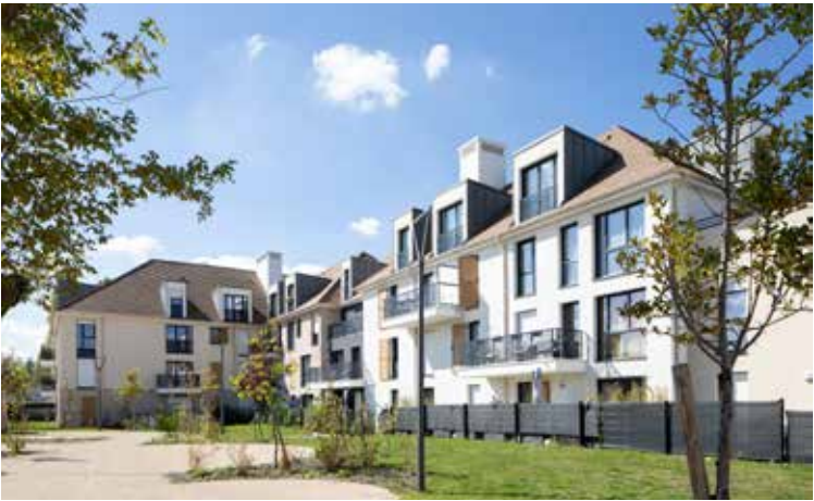
Domaine Villa Verde à Plaisir Architecte : Architectonia