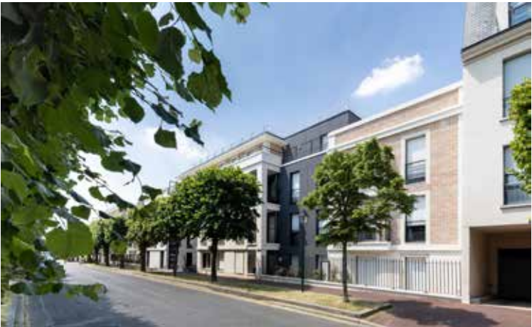
Villa Carnot à Croissy-sur-Seine Architecte : Architectonia