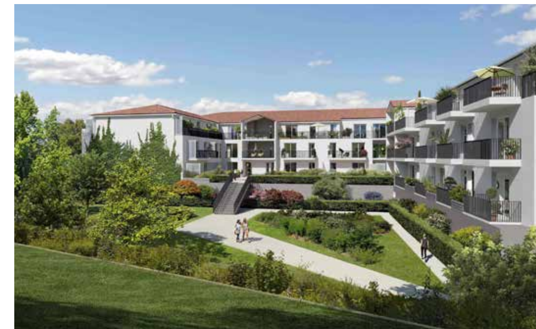
Le Clos Saint François à Challans