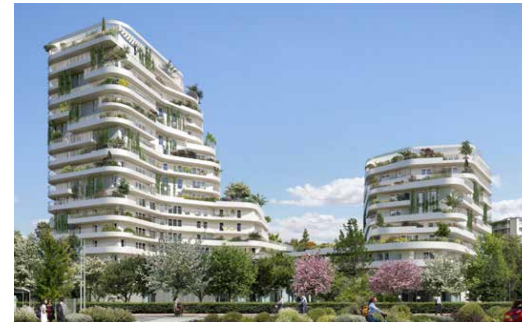
Harmony of the Sky à Saint-Nazaire