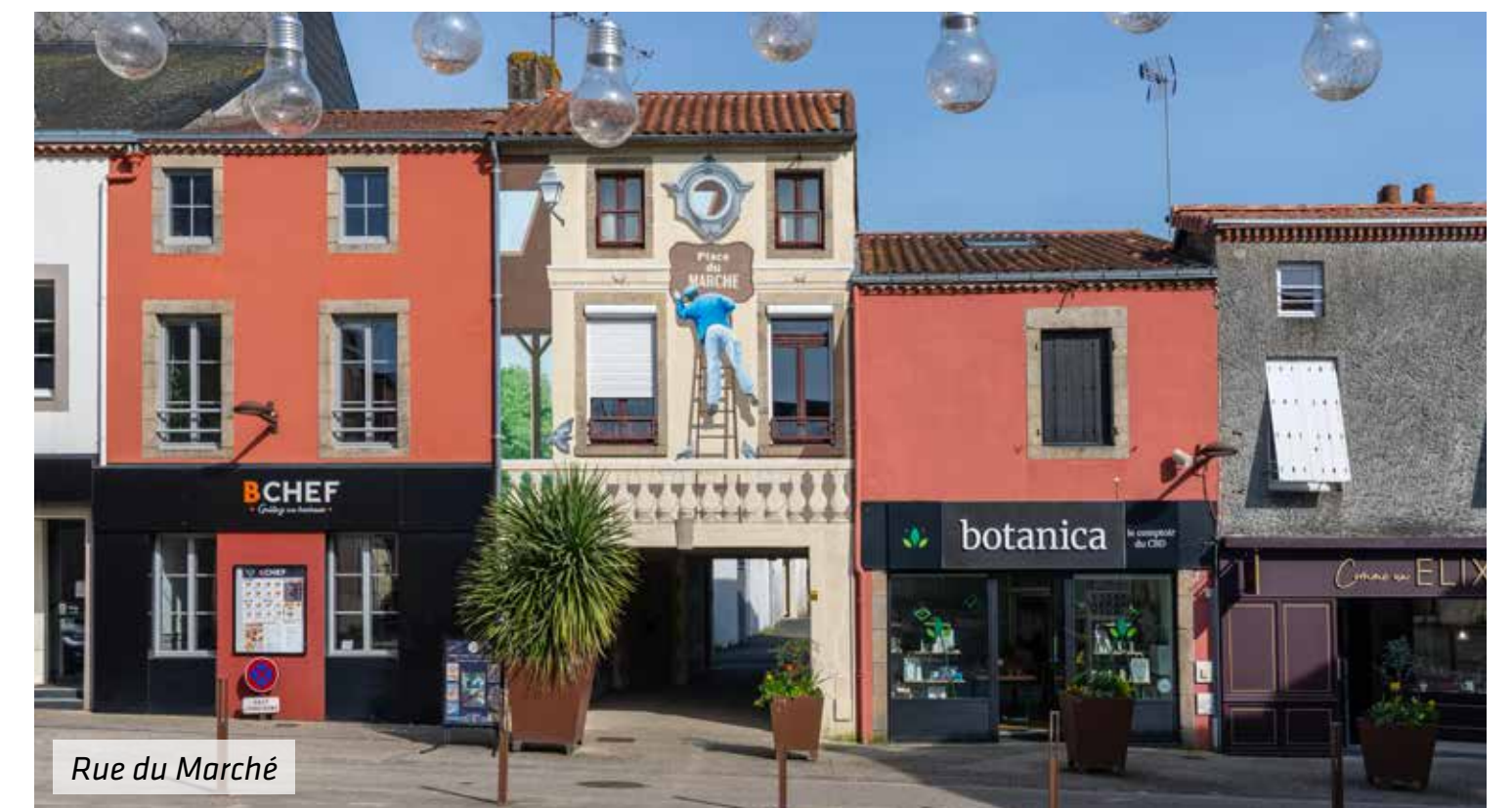
Rue du Marché