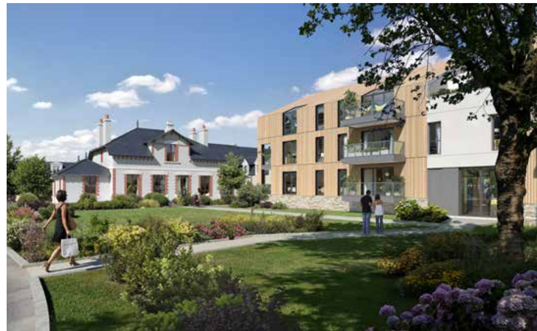
Domaine Saint-Michel à Guérande