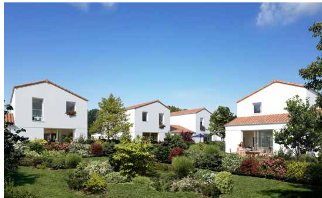
Le Bois Valentin à Saint-Jean-de-Monts