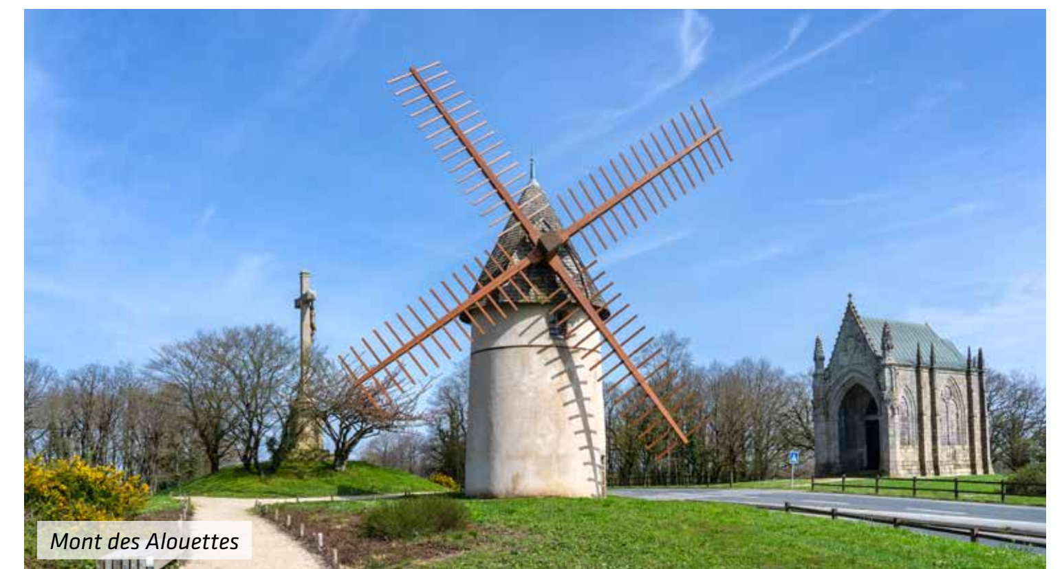
Mont des Alouettes