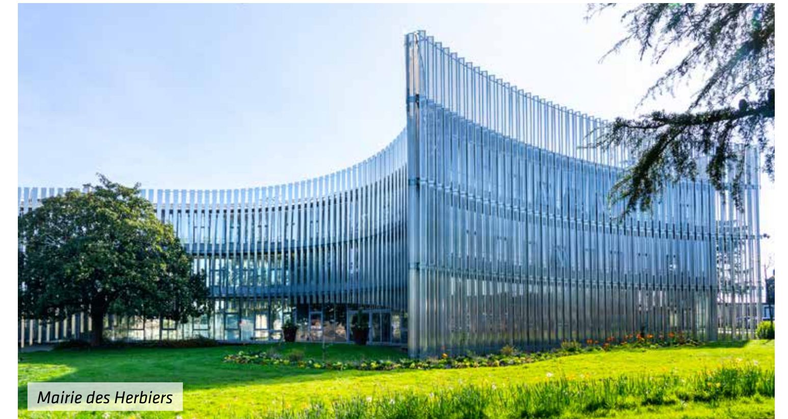
Mairie des Herbiers