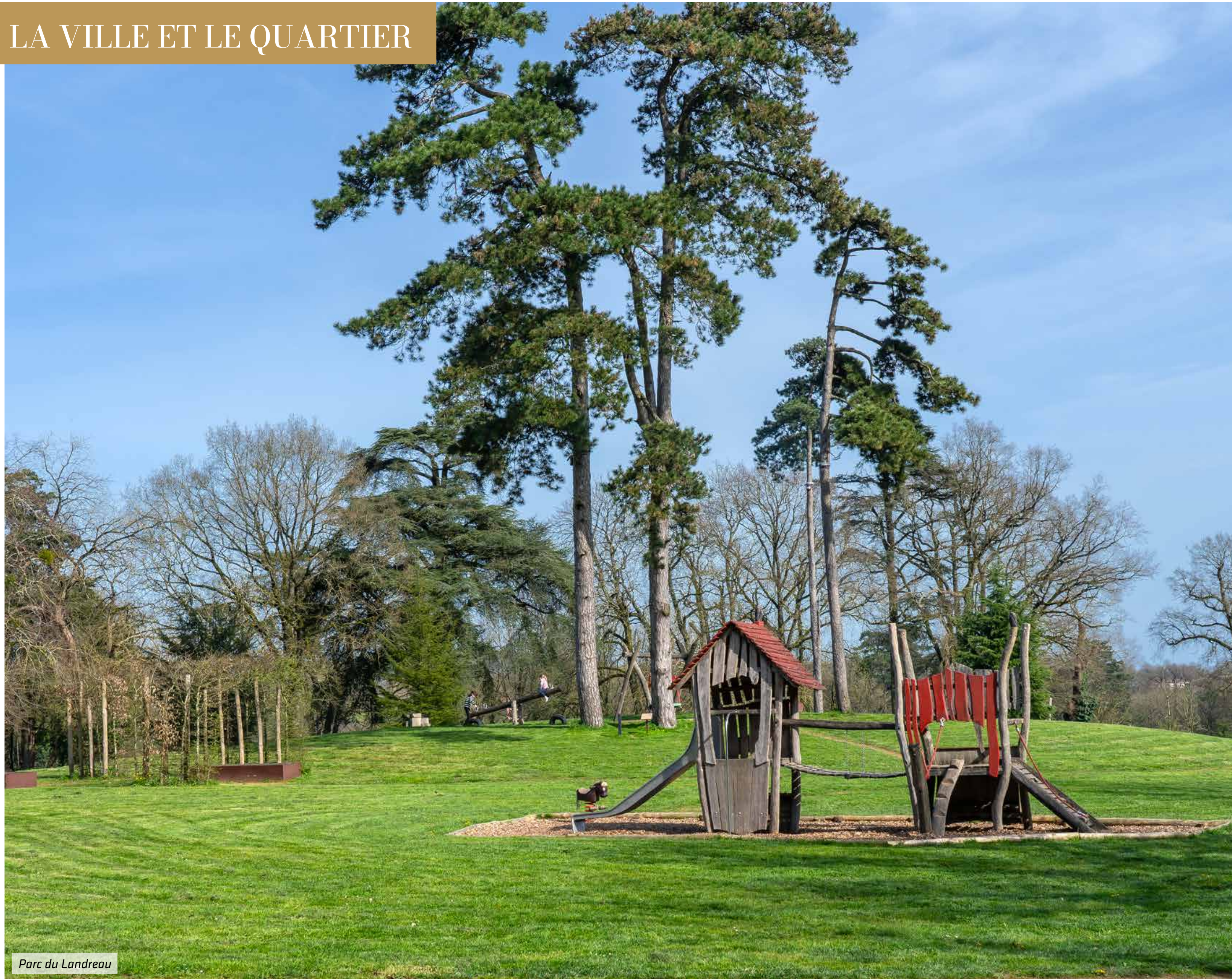
Parc du Landreau