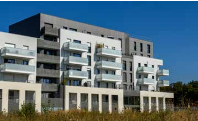
Green Life à Bussy-Saint-Georges (77) Architecte : Architectonia