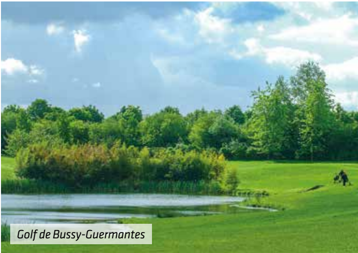
Golf de Bussy-Guermantes