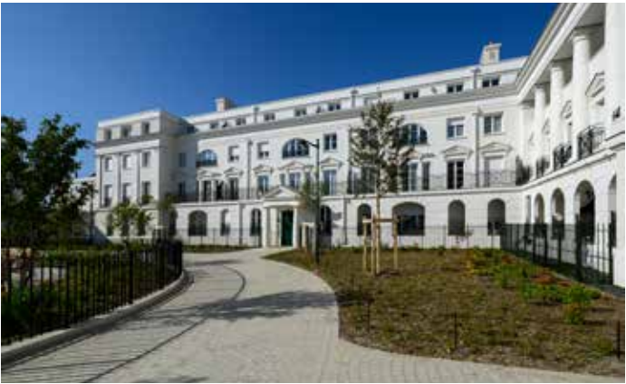
Domaine Régence à Serris (77) Architectes : John Simpson Architects en collaboration avec Ate- lier BLM Architectes-Urbanistes et Paris Classical Architecture