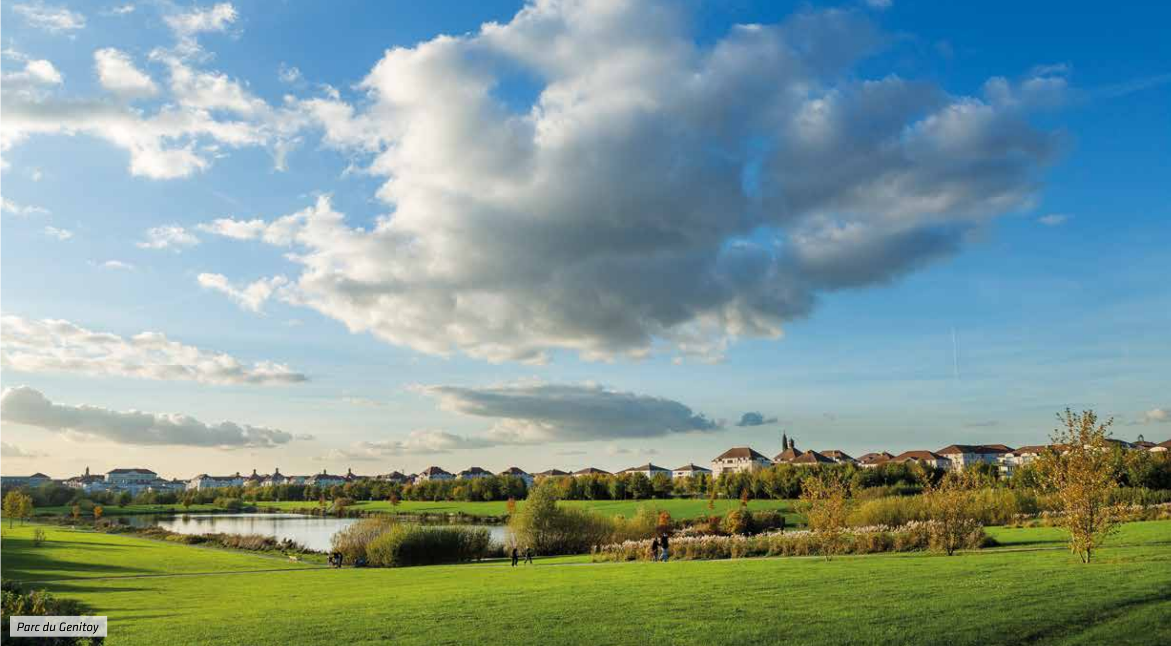
Parc du Genitoy

À ces atouts, Bussy ajoute un cadre généreux de nature. Nichée dans la vallée de la Brosse, elle est parsemée de quelque 155 ha d’espaces verts parmi lesquels des plans d’eau, 10 squares, parcs et jardins, mais aussi un golf 27 trous... Sans compter les 300 ha de la forêt de Ferrières toute proche... Bussy-Saint-Georges est si verte de cœur qu’on la surnomme à raison « la ville des parcs et des jardins ». La croissance de sa population depuis 10 ans illustre le fort pouvoir d’attraction d’une commune attachée à l’urbanisme maîtrisé et à la qualité de ses services.