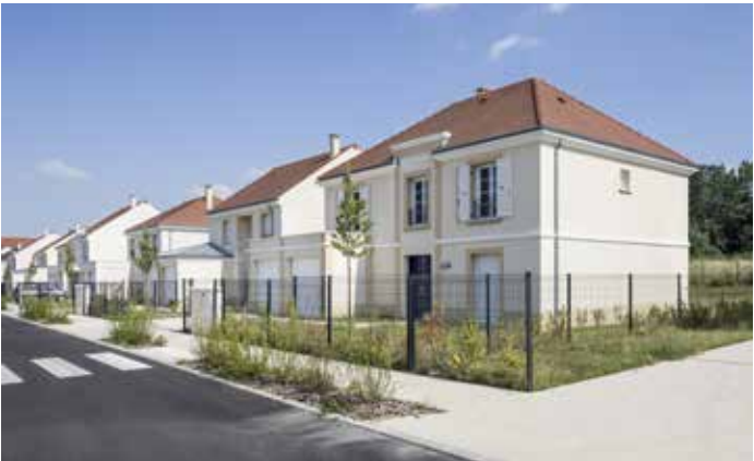
Domaine de l'Orangerie à Montevrain (77) Architectes : Emmanuel Gutel et Paul Meyer