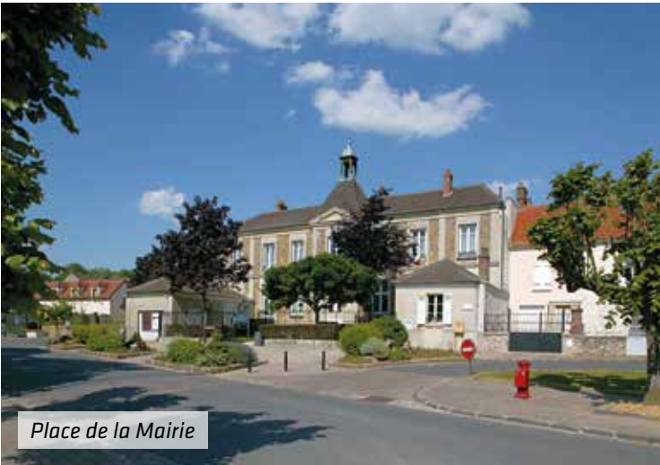
Place de la Mairie

S’inscrivant dans une démarche d’urbanisme durable, votre nouveau quartier de vie est composé de logements, d’activités et d’équipements. Il concentre également de nombreux services et commerces qui simplifient votre organisation quotidienne. Ici, vous vous sentez infiniment bien.