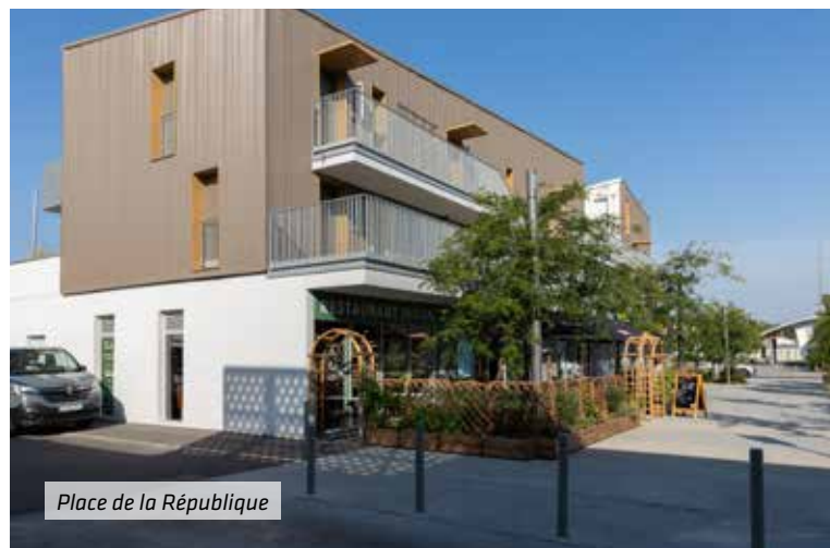
Place de la République