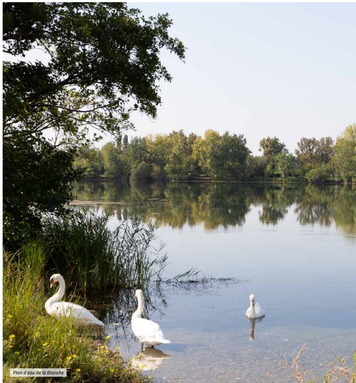
Plan d'eau de la Blanche

Participant à un quotidien serein : commerces, marché et grandes enseignes pour les courses ; crèches et écoles où les enfants s'épanouissent ; équipements de loisirs variés donnant des ailes aux passions. Sans compter les projets dédiés à l'embellissement permanent de votre futur cadre de vie !