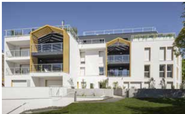
Les Terrasses de Saint-Augustin à Mérignac (33) Architecte : Agence d'architecture URB1N