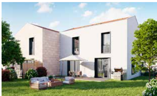
Villa Brugeaise à Bruges (33) Architecte : Atelier Alonso Sarraute