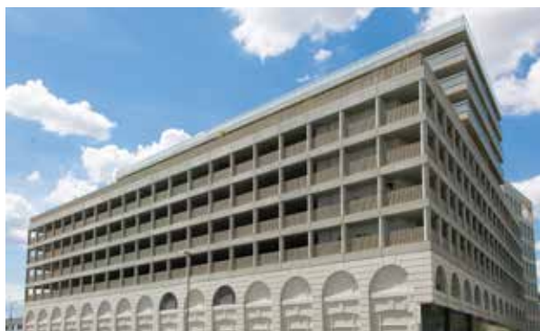
Attique de Brienne à Bordeaux (33) Architecte : Colboc Sachet architecture