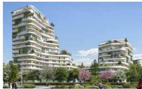
Harmony of the Sky - Saint Nazaire Architecte : Hamonic & Masson