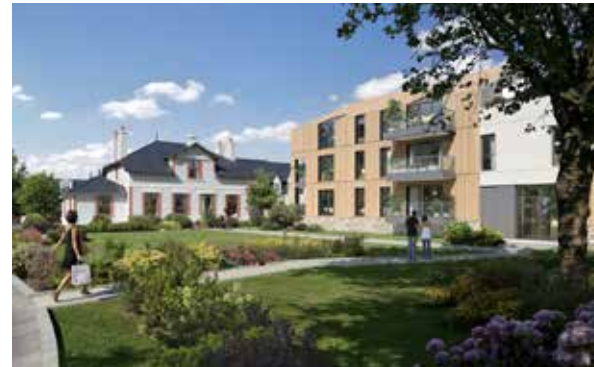
Domaine Saint-Michel - Guérande Architecte : Didier Zozio