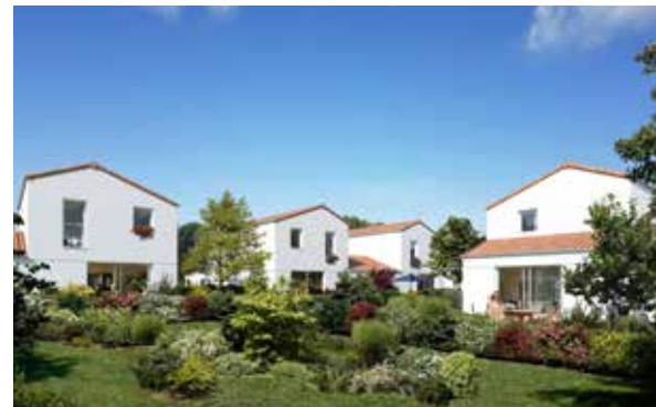
Le Bois Valentin - Saint-Jean-de-Monts Architecte : Agence d'architecture ACDM