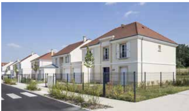
Domaine de l'Orangerie à Montevrain (77) Architectes : Emmanuel Gutel et Paul Meyer