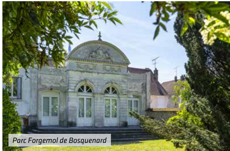
Parc Forgemol de Bosquenard