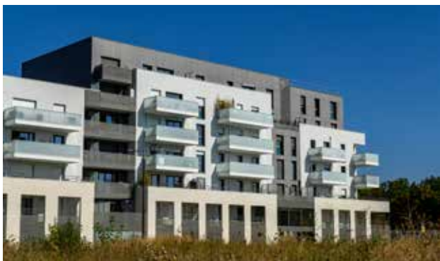
Green Life à Bussy-Saint-Georges (77) Architecte : Architectonia