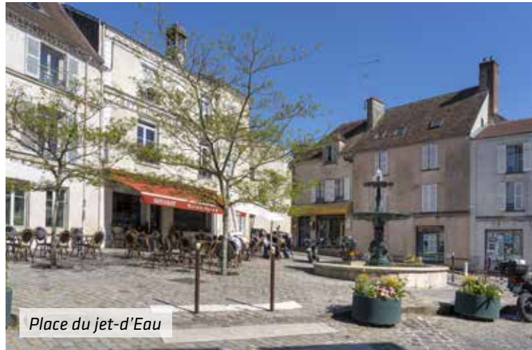
Place du jet-d'Eau