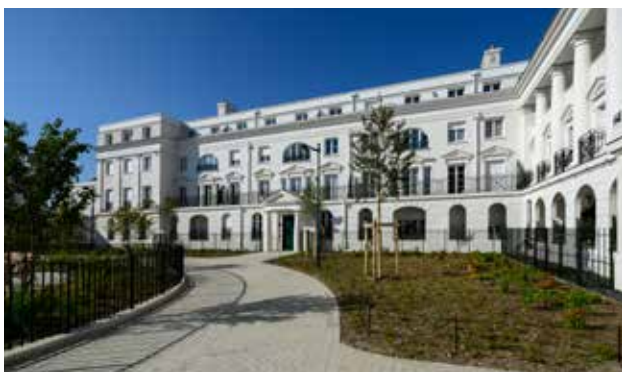
Domaine Régence à Serris (77) Architectes : John Simpson Architects en collaboration avec Atelier BLM Architectes-Urbanistes et Paris Classical Architecture