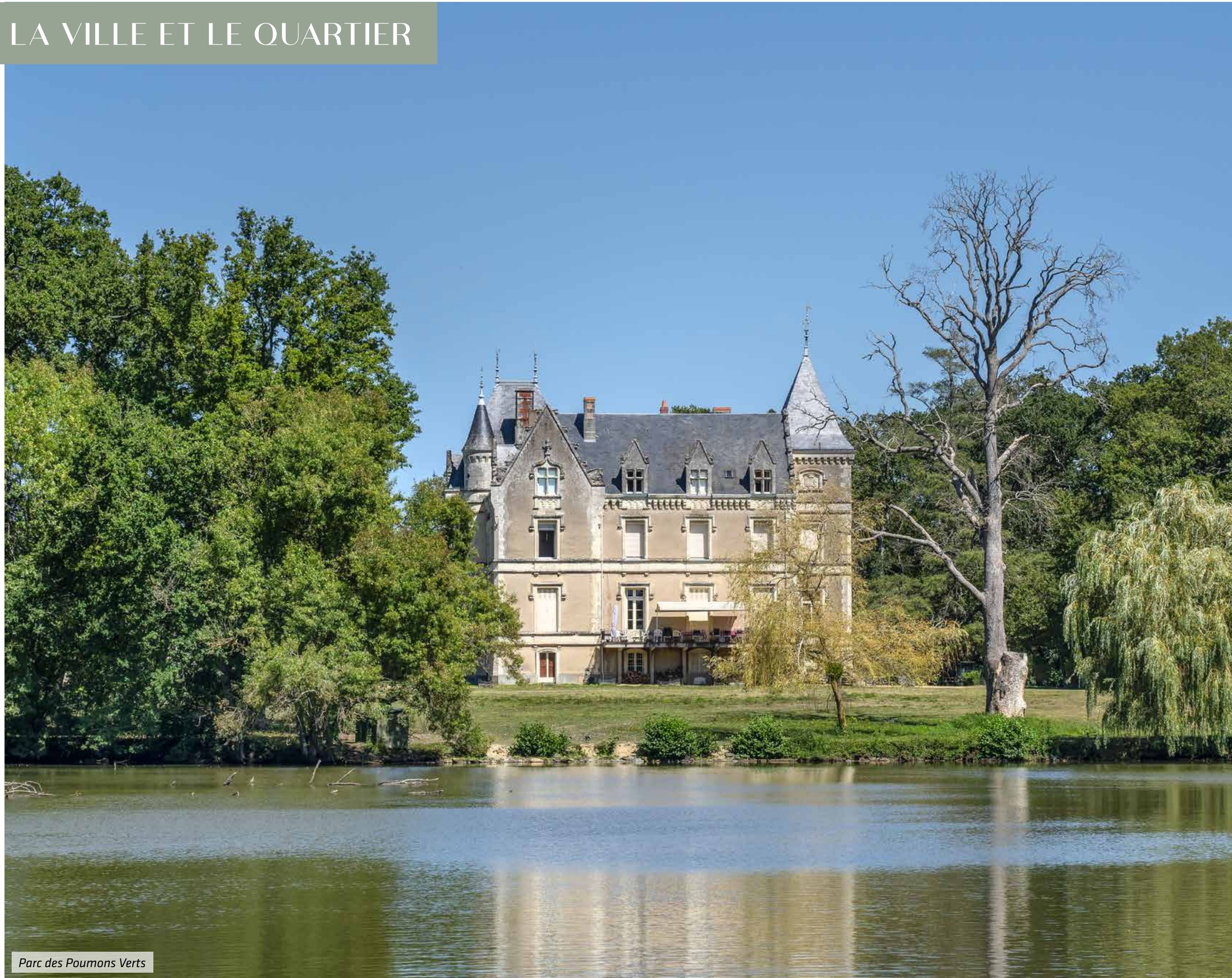
Parc des Poumons Verts