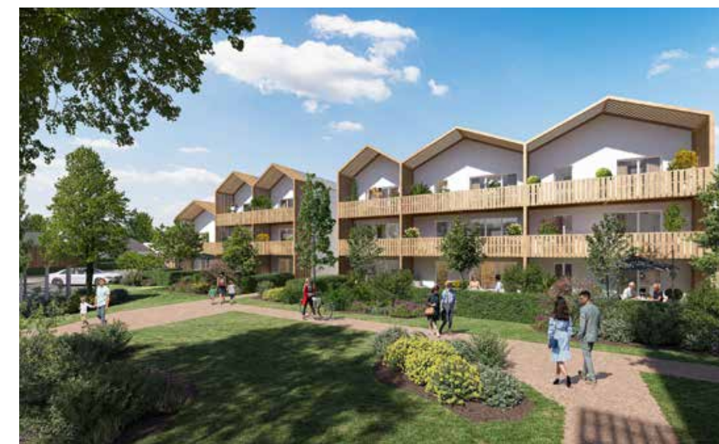
Parc & Plaisance à Blain