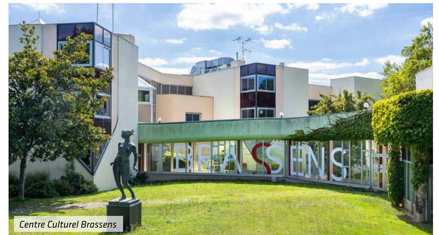
Centre Culturel Brassens