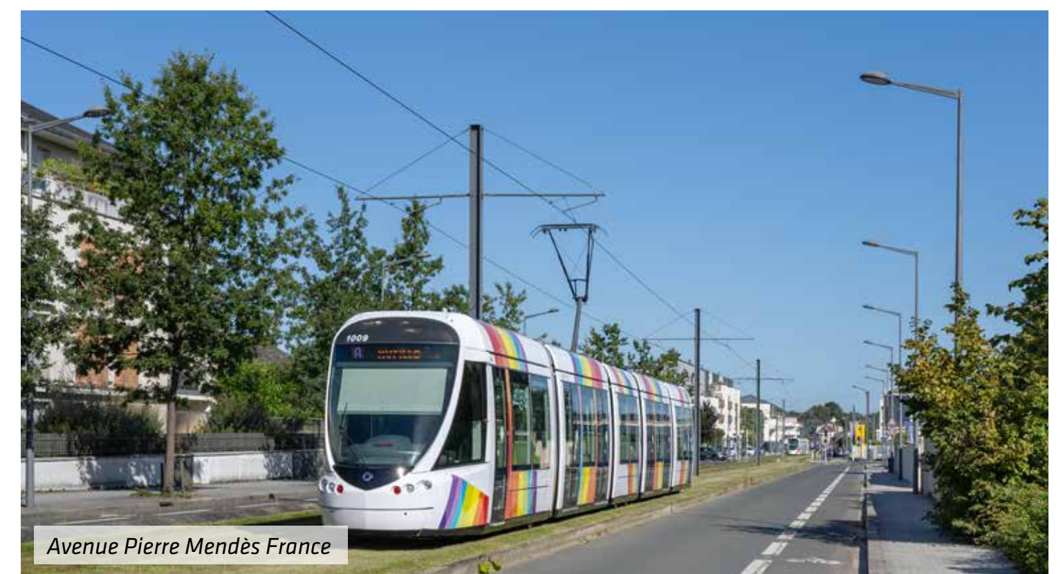
Avenue Pierre Mendès France