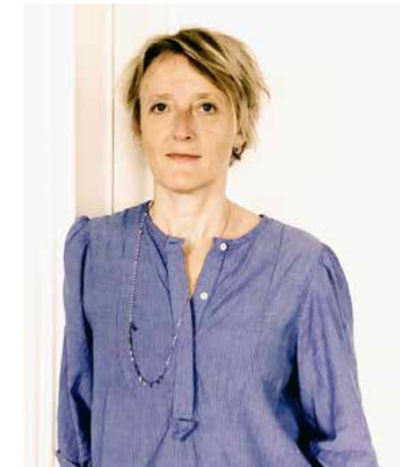
Solveig Tønning Atelier 123 Couleur

Créateurs de liens, ces halls d'entrée comprennent également deux bibliothèques partagées en chêne massif et métal permettant aux habitants de s'échanger des livres. Un miroir serti de bois qui agrandit visuellement la pièce et une applique XL en laiton finition graphite parachèvent l'aménagement. Véritable parenthèse entre la vie extérieure et la quiétude intérieure de la résidence, ces halls et leurs beaux matériaux laissent deviner le confort des appartements et l'attachement à l'espace, sublimé jusque dans les moindres détails.