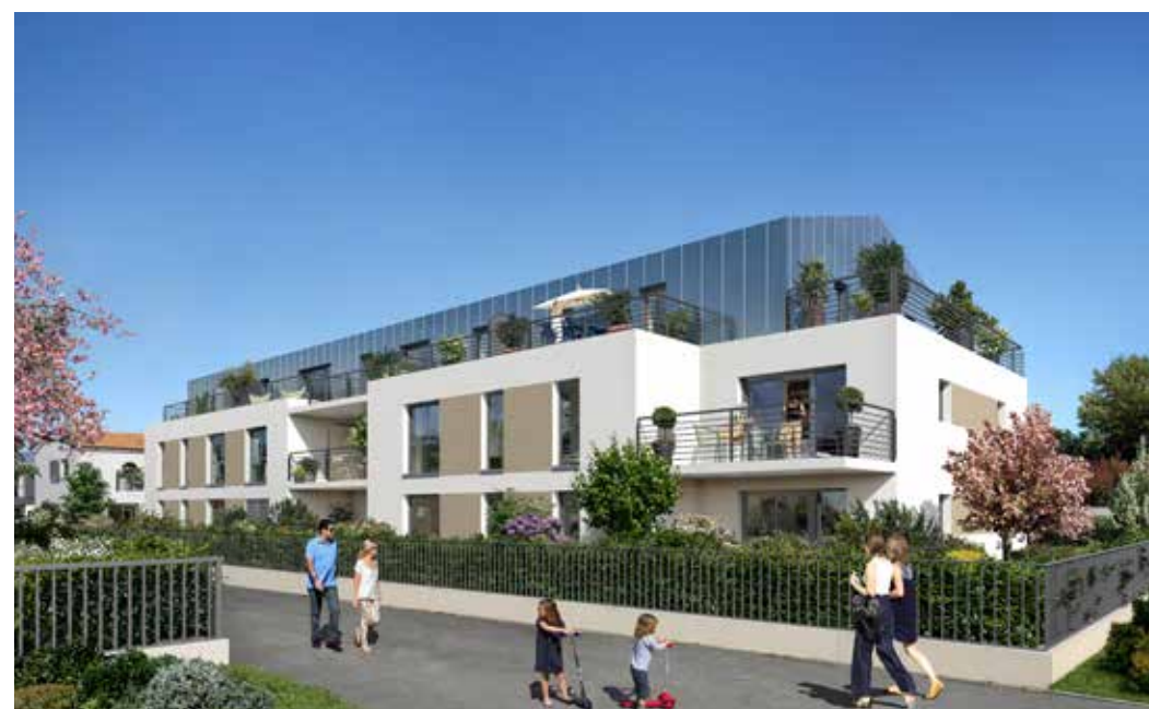
Le Clos Cambronne à Saint-Sébastien-sur-Loire