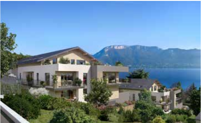
Les terrasses du lac - Sévrier Architecte : David Ferré