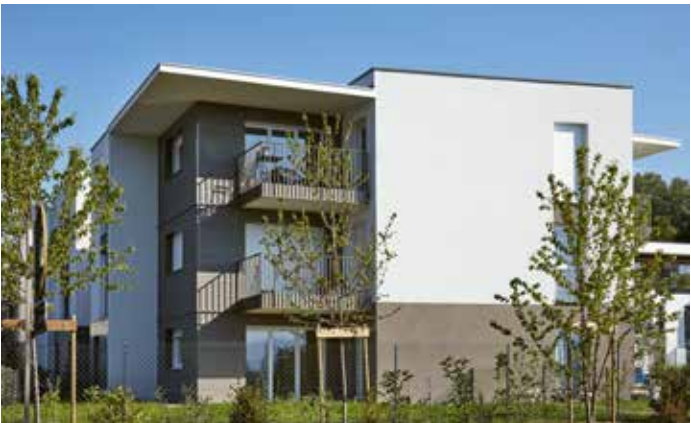
Les Hauts du Lac - Anthy-sur-Léman Architecte : David Ferré