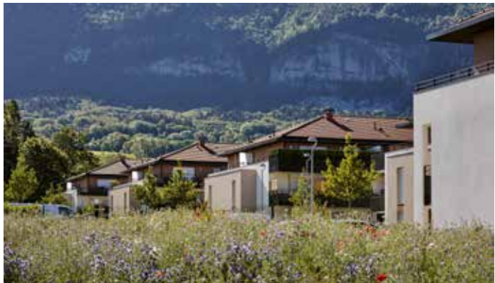
Terrasses Bellevue - Beaumont Architecte : Agence d'architecture David Ferré