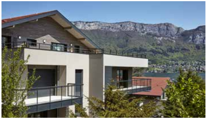
Les Terrasses du Lac - Sevrier Architecte : Agence d'architecture Yves Poncet et David Ferré