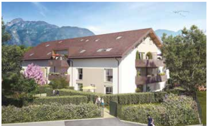
Villas Aravis - St-Pierre-en-Faucigny Architecte : Agence d'architecture David Ferré