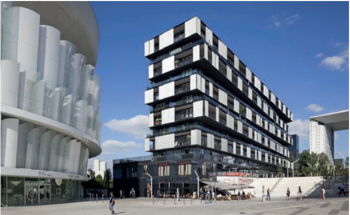
The ONE - Nanterre Architecte : Farshid Moussavi Architecture