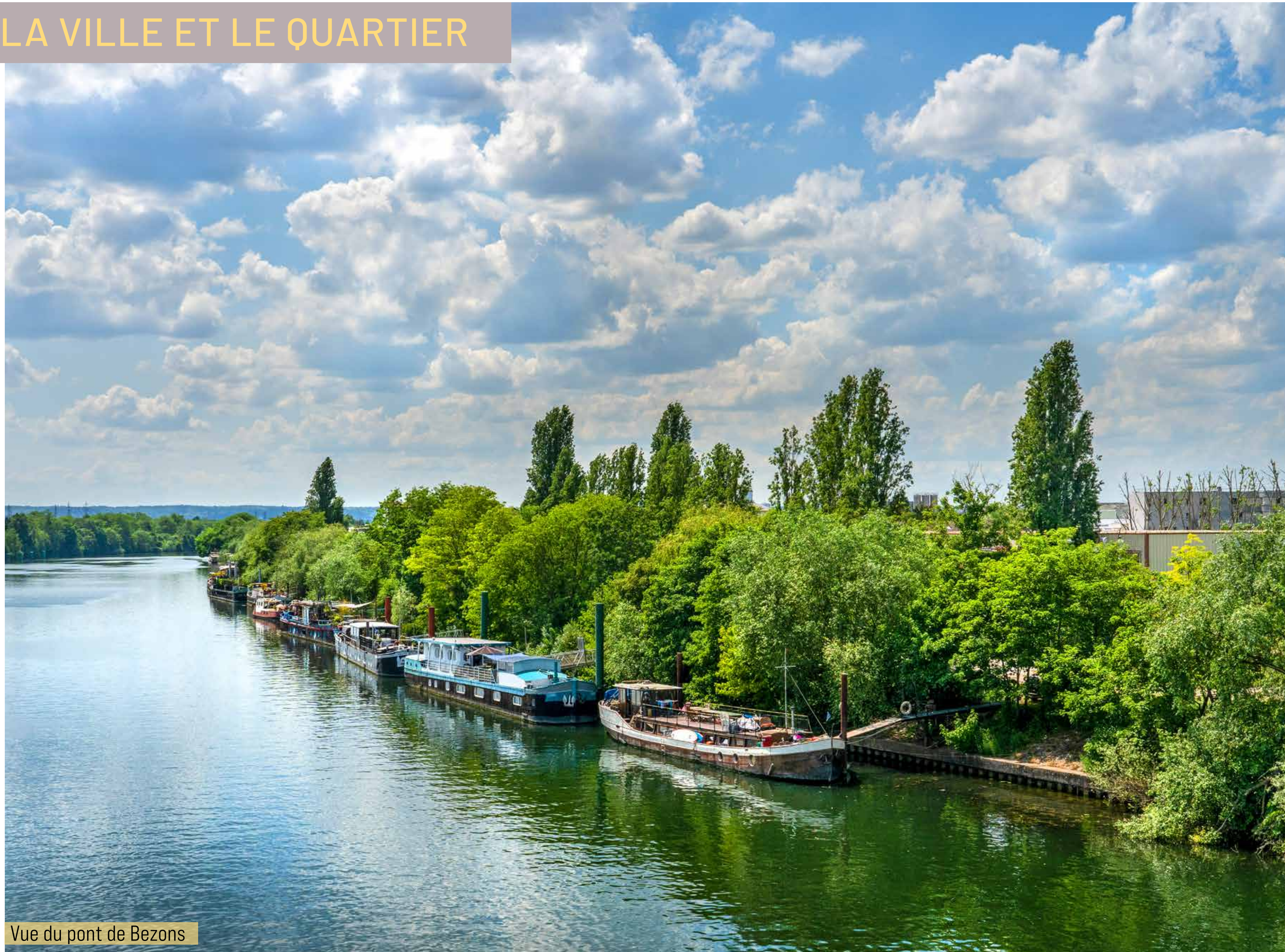
Vue du pont de Bezons