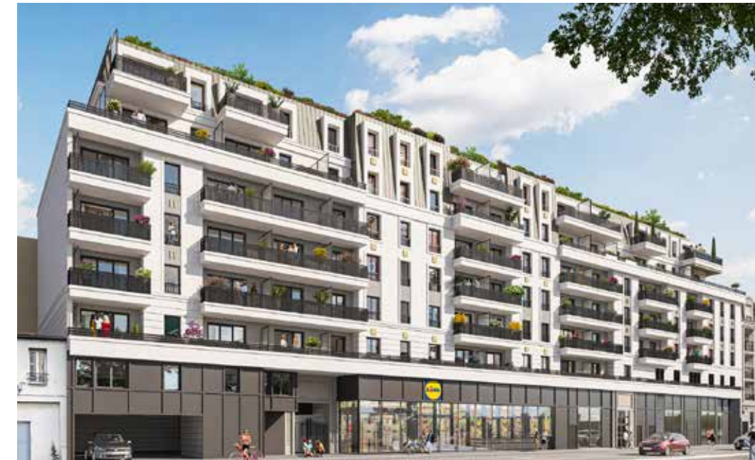
Les Balcons de Zola à Bezons Architecte : EBSG Architectes