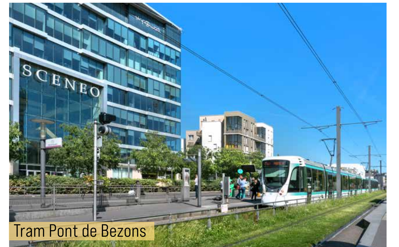
Tram Pont de Bezons