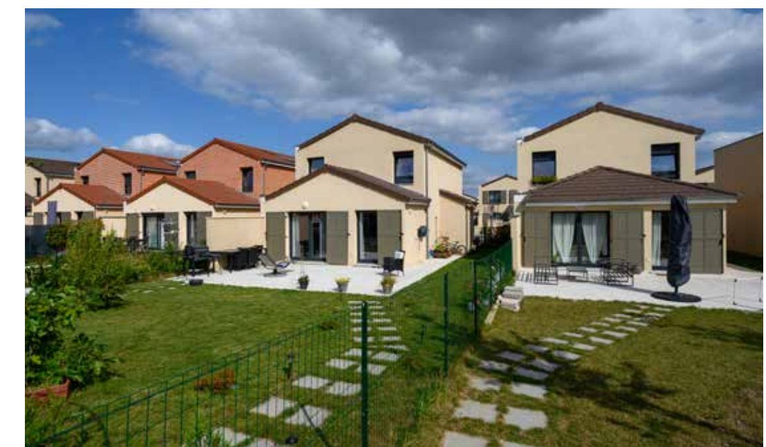
Les Allées De Beauvoir à Cormeilles-en-Parisis Architecte : Agence d'architecture 2AD