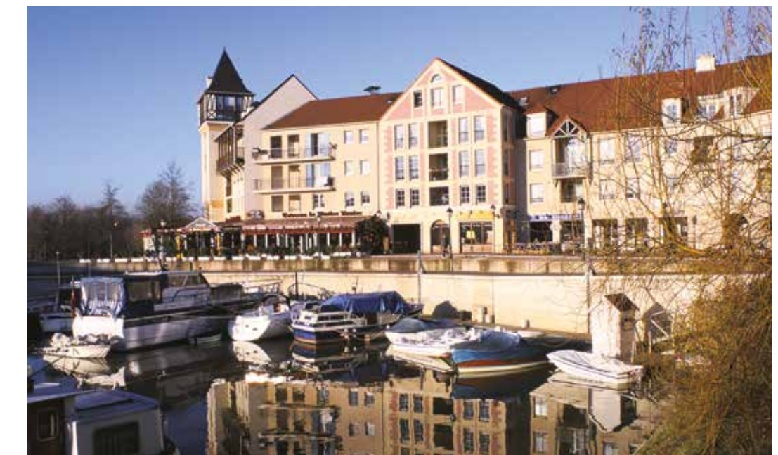
Port Cergy à Cergy Architecte : François Spoerry