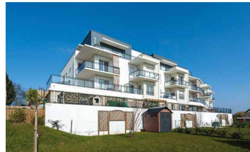
Les Hauts de Valdomont à Domont Architecte : Atelier BLM : Elliott Laffitte