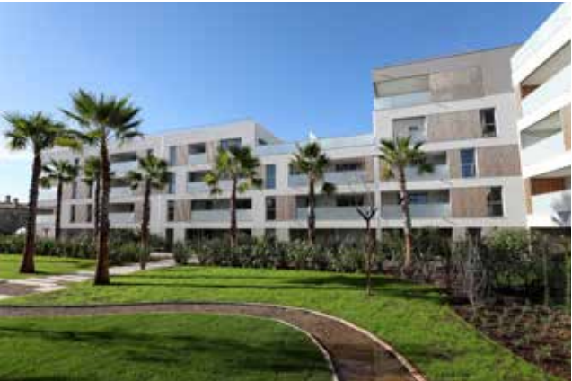
Le Jardin de Matisse - Saint-Laurent-du-Var Architecte : Cabinet Es-Pace