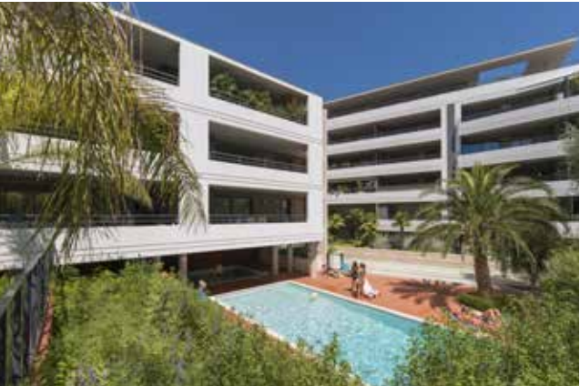
28, Montfleury - Cannes Architecte : ABC Architectes