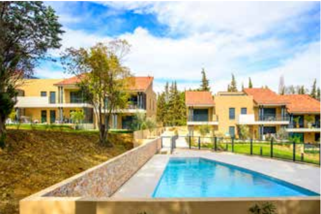
Les Jardins de Valmasque - Mougins Architecte : ABC Architectes