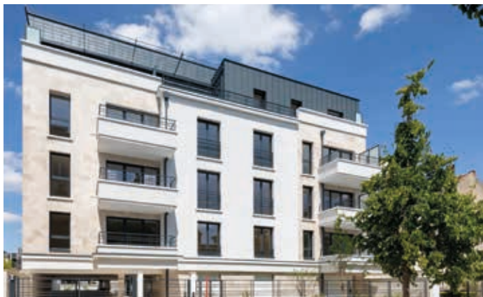
Villa Flora - Fontenay-sous-Bois Architecte : A2D Architecture