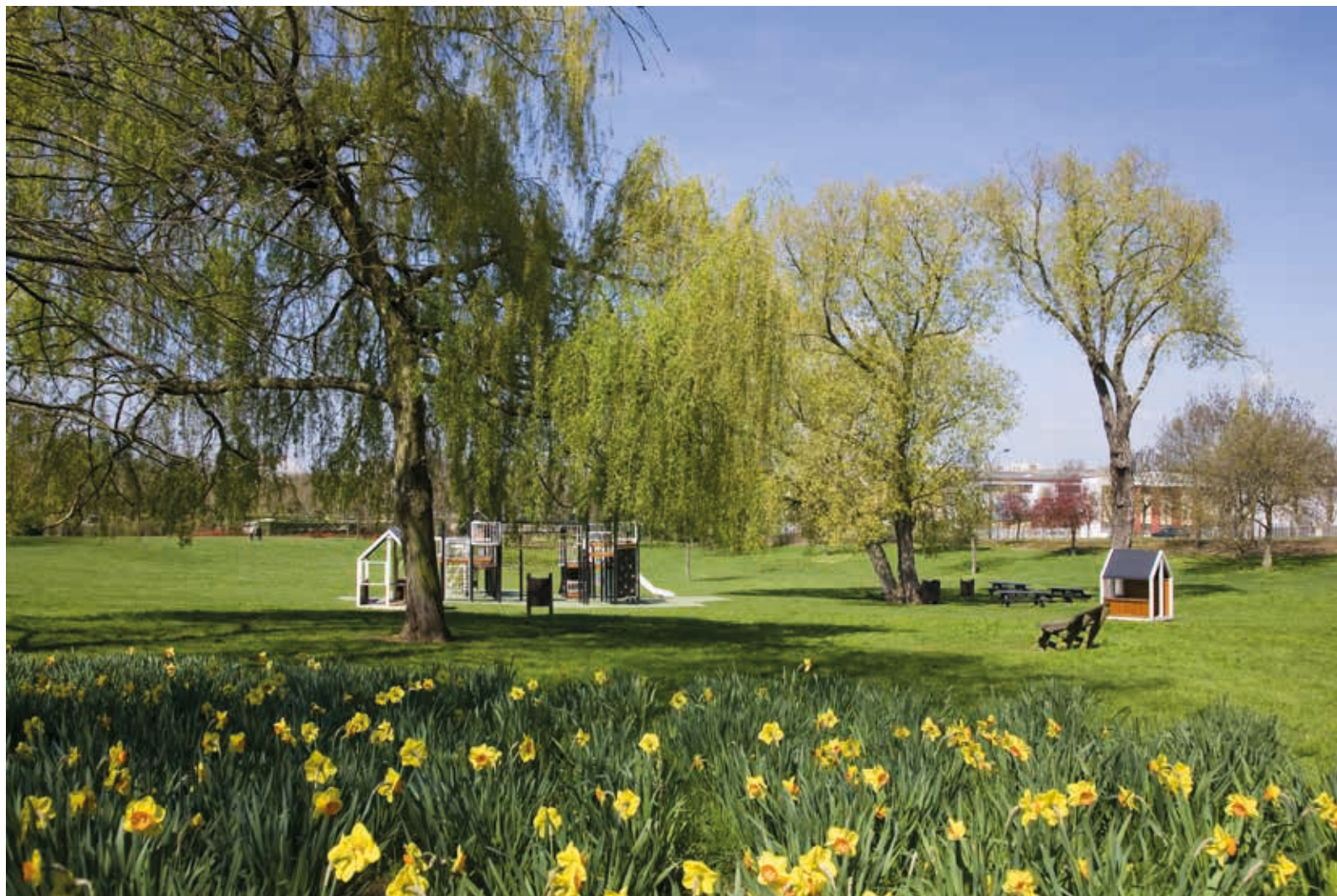
Le confort de la ville et le bien-être de la nature, à Champigny-sur-Marne