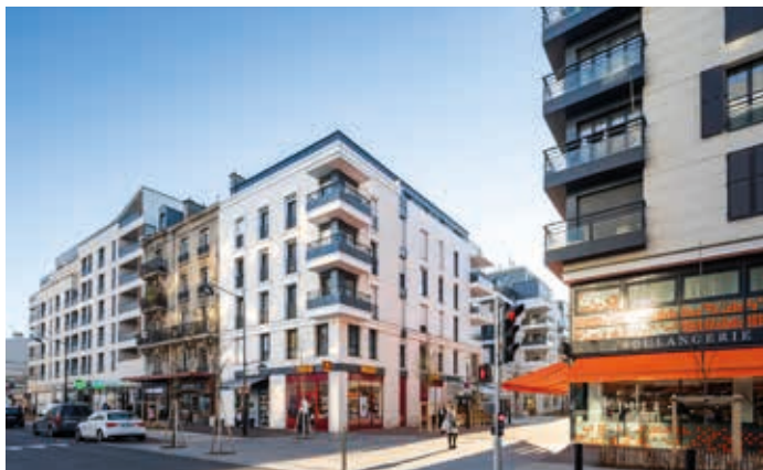
26 rue de Paris - Joinville-le-Pont Architecte : Smaïn Barkat