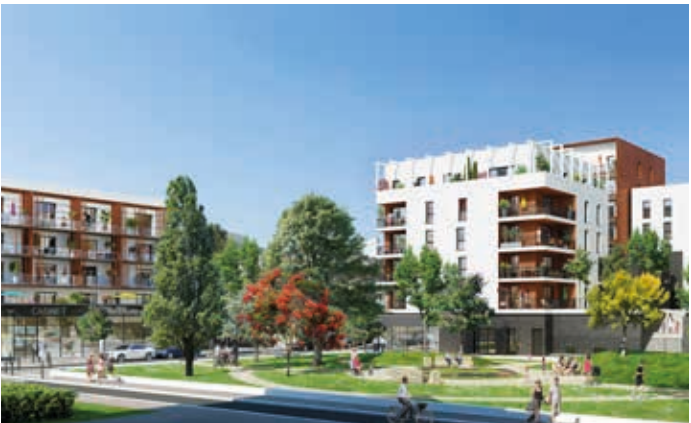
Le Clos de l'Arche - Torcy Architecte : Agence d'architecture Reichen et Robert & Associés