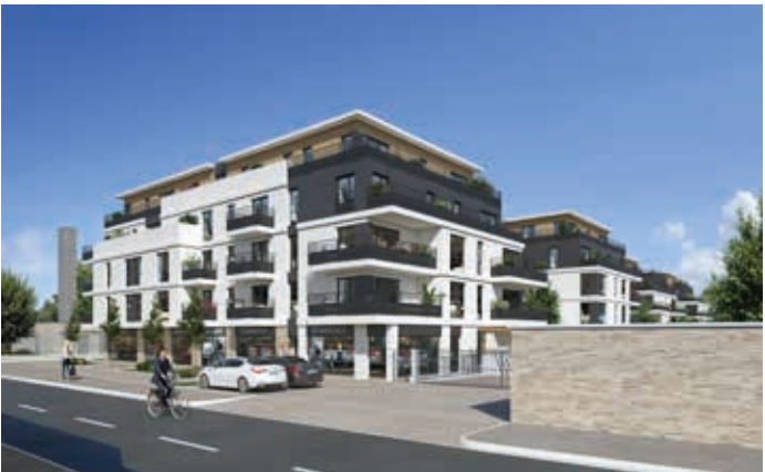
Esprit Canal - Vaires-sur-Marne Architecte : Architectonia