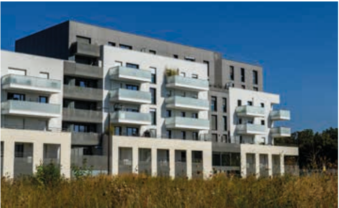
Green Life - Bussy-Saint-Georges Architecte : Architectonia