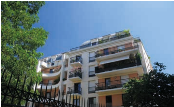
Les Jardins d'Atalante - Les Lilas Architecte : Eric Marmorat