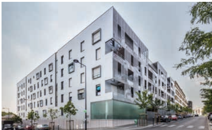
Pierrefitte-sur-Seine - Jardin des Poètes Architecte : François Daune