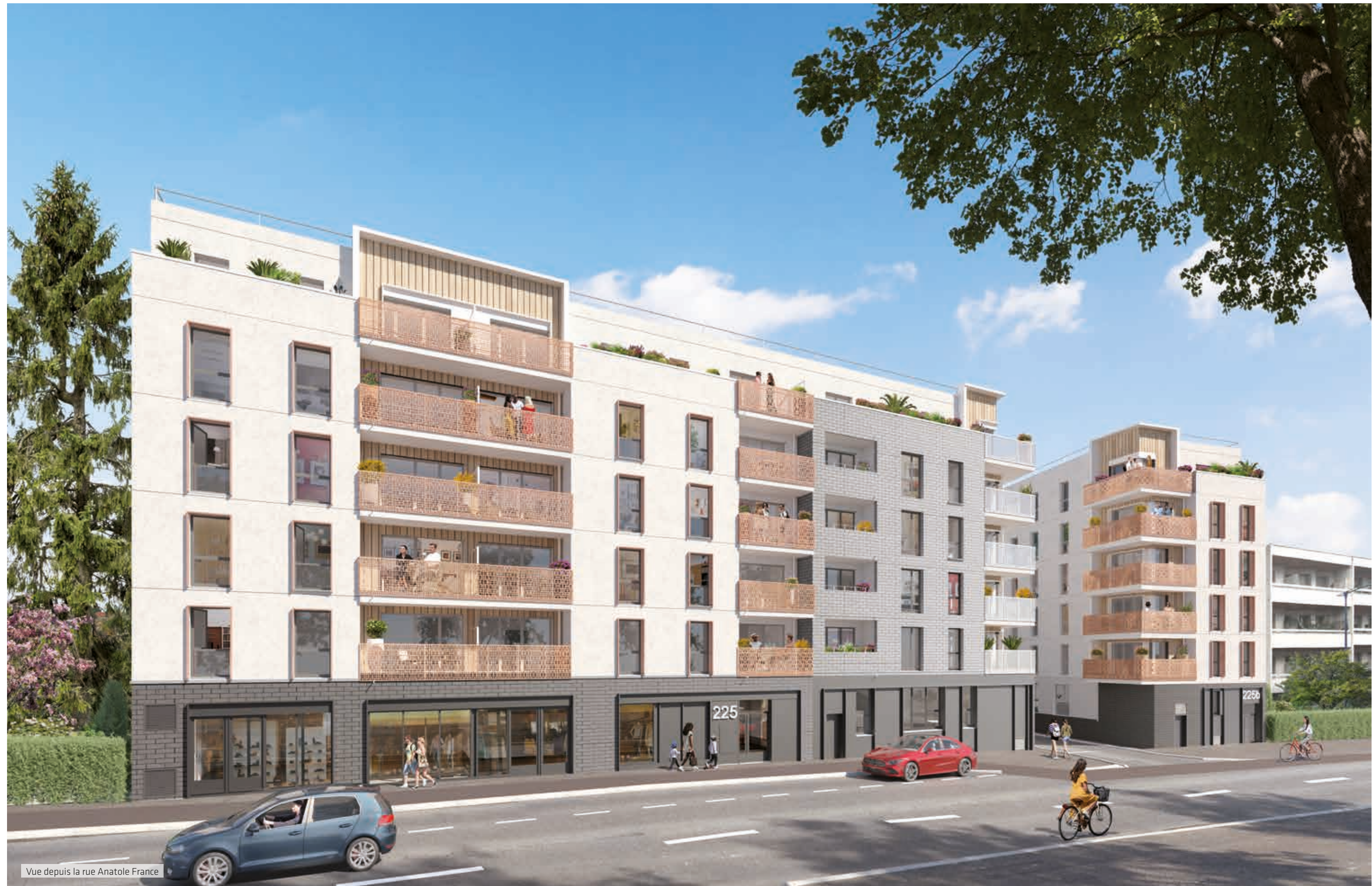
Vue depuis la rue Anatole France

Revêtue sur toute la hauteur de parement brique, la partie centrale de la résidence contribue aussi à rythmer le volume. Elle dialogue par contraste avec le rez-de-chaussée ponctué d'un parement de briques d'un gris plus soutenu, et accueillant 2 commerces.