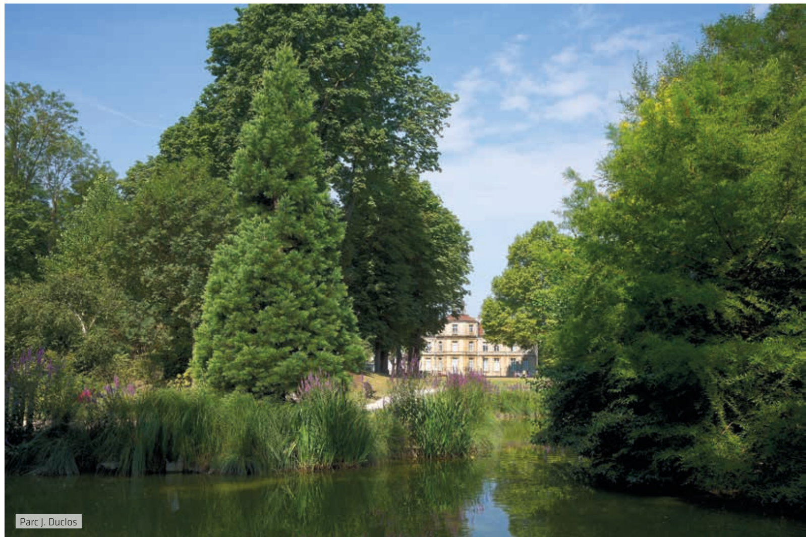
Parc J. Duclos