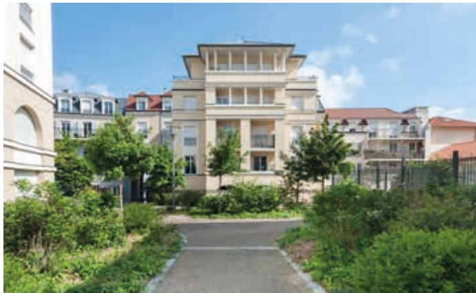
Carré Renaissance - Noisy-le-Grand Architecte : Cabinet Lionel de Segonzac et Cabinet Le Meur