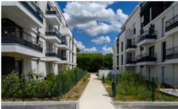
Vaires-sur-Marne - Esprit Canal Architecte : Agence Architectonia