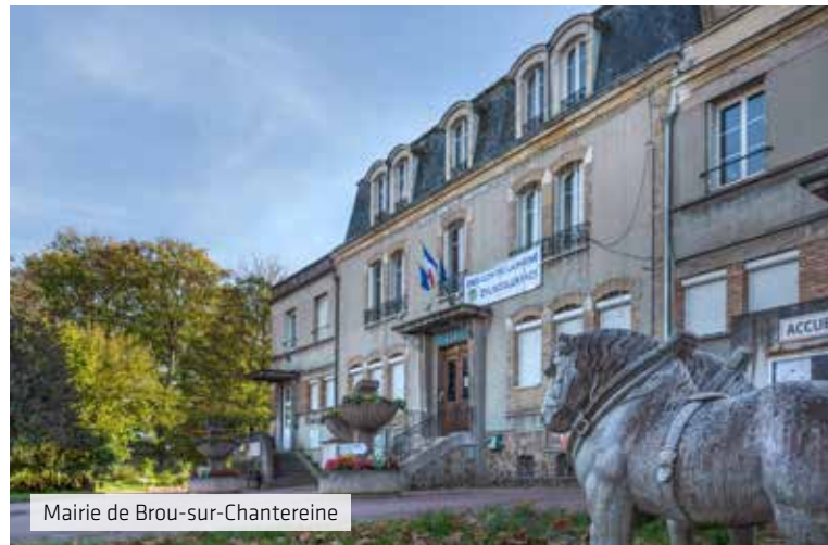
Mairie de Brou-sur-Chantereine