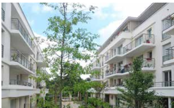
Noisiel - Les Jardins de Noisiel Architecte : Atelier Gera