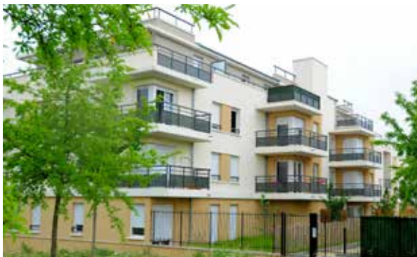
Montévrain - Les Terrasses du Parc Architecte : Cabinet Emmanuel Gutek Architecte et Associés