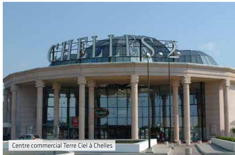
Centre commercial Terre Ciel à Chelles