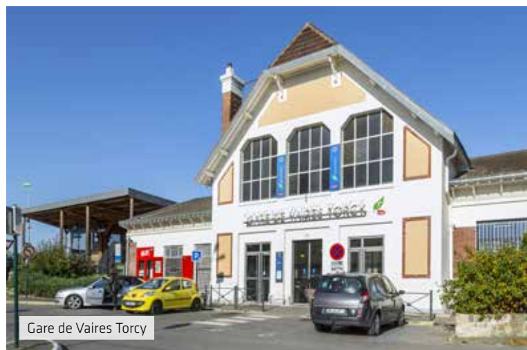
Gare de Vaires Torcy