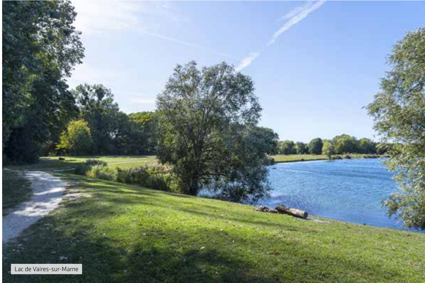
Lac de Vaires-sur-Marne